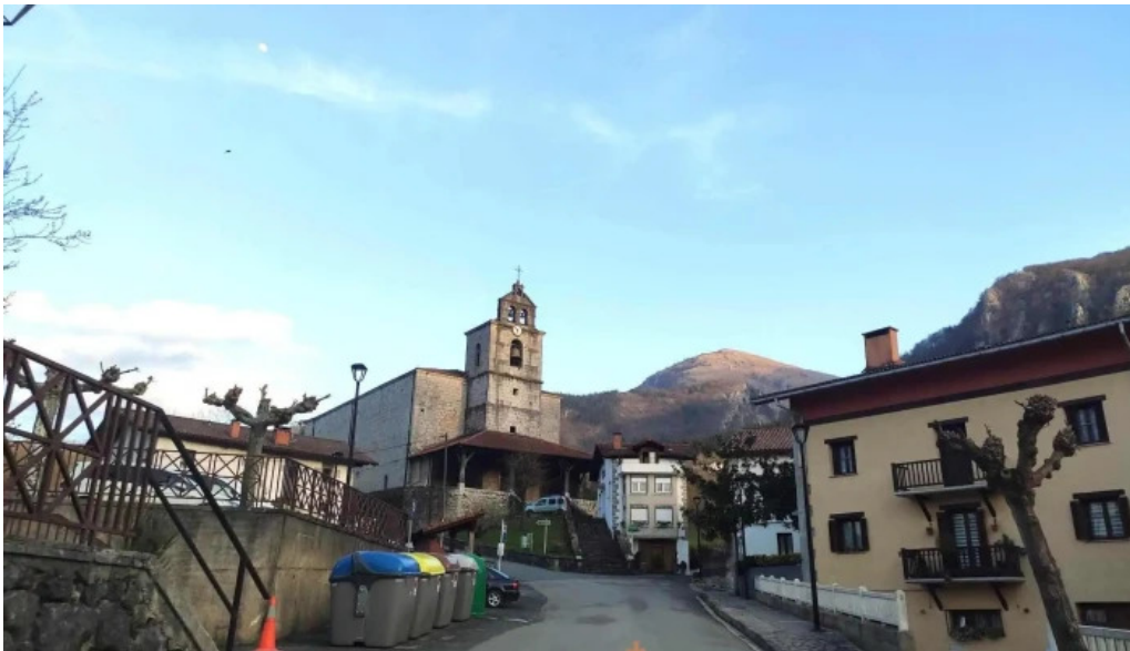
Bartolome deunaren elizaiglesia de san bartolome iglesia catolica