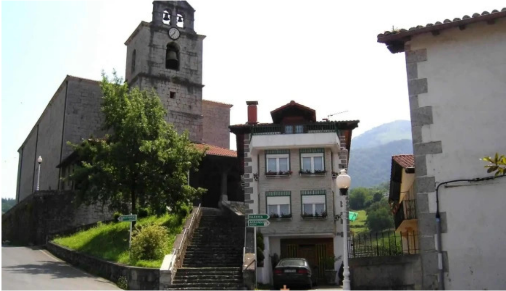
Bartolome deunaren elizaiglesia de san bartolome iglesia