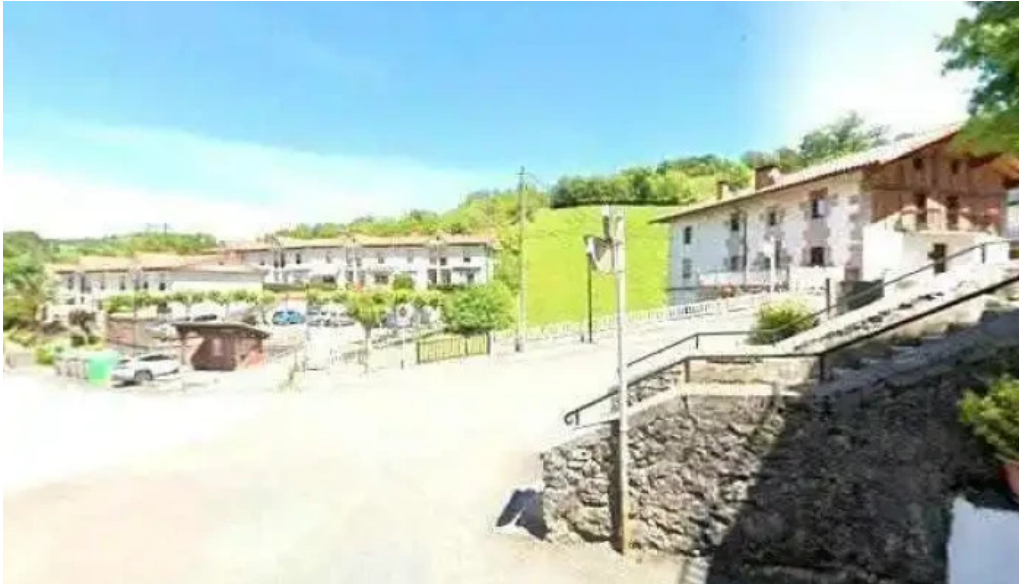
Bartolome deunaren elizaiglesia de san bartolome zona