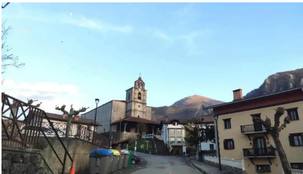
Bartolome deunaren eliza iglesia de san bartolome ergoiena