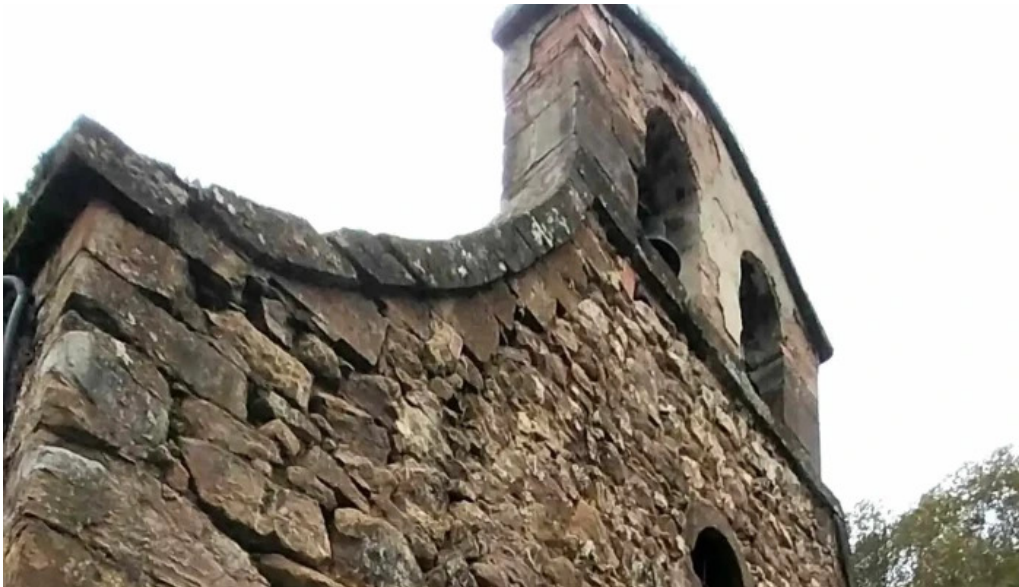
Ermita del visu el viso