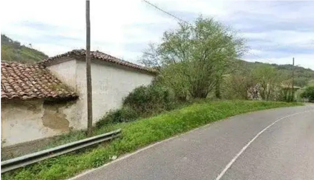
Ermita del visu iglesia catolica