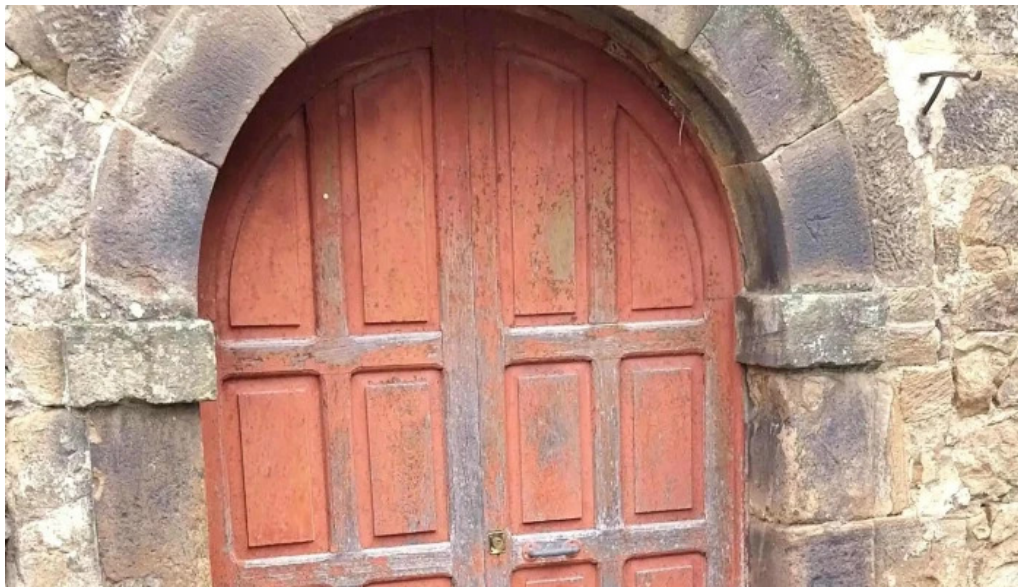
Ermita del visu telefono