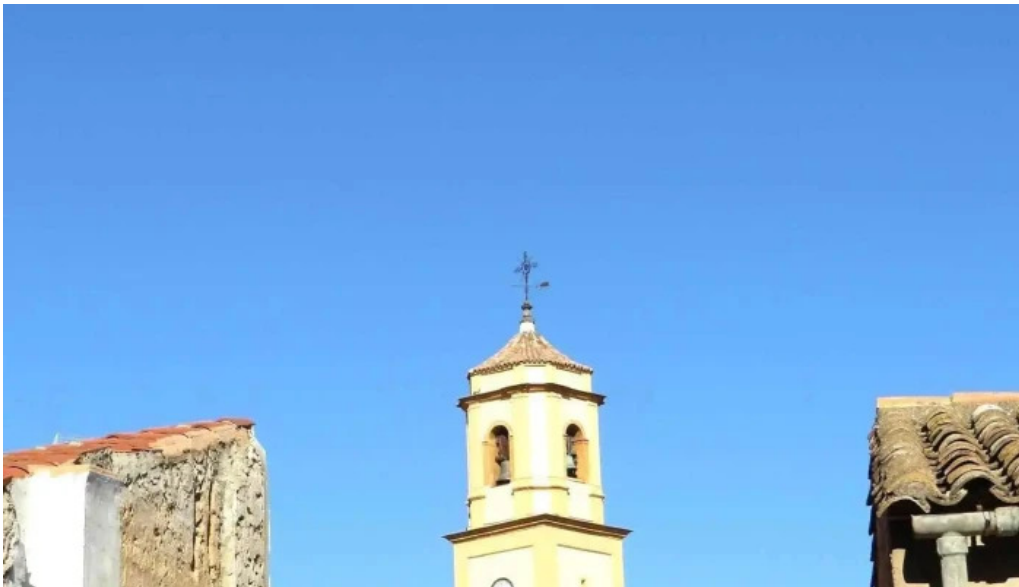
Parroquia san lorenzo iglesia