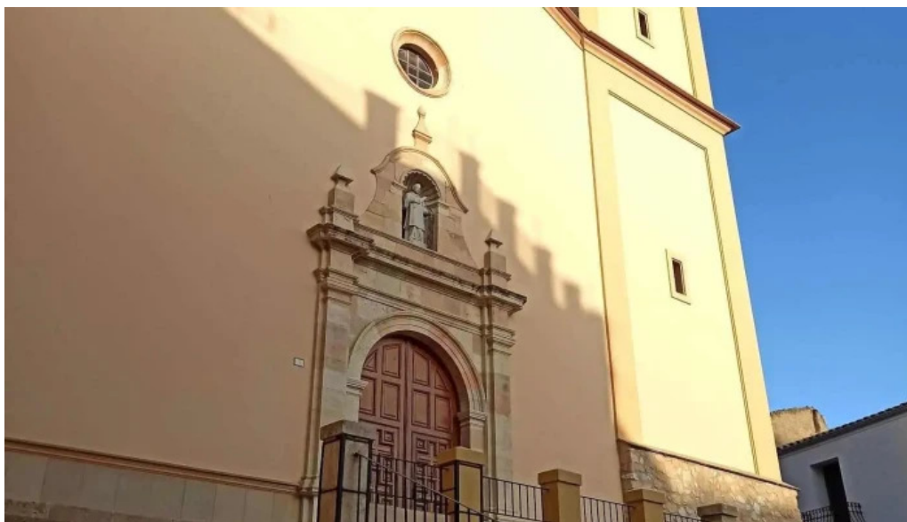
Parroquia san lorenzo iglesia catolica