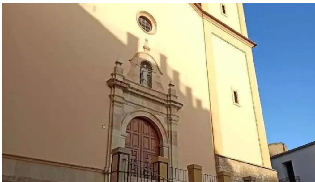
Parroquia san lorenzo el pinell de brai