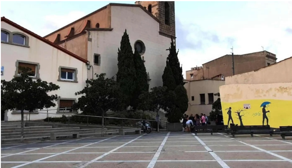
Iglesia de san pedro el masnou