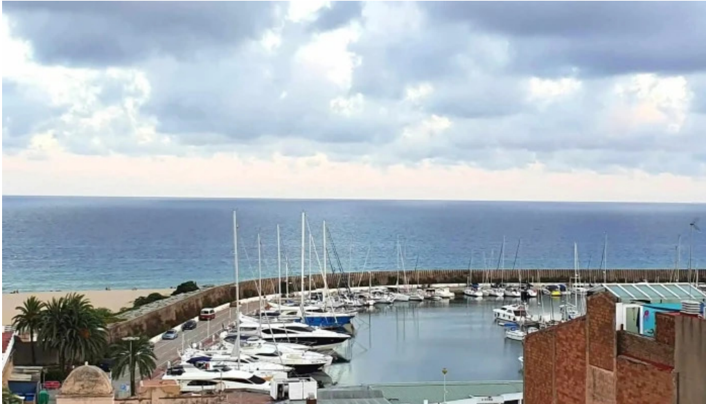
Iglesia de san pedro catalogo