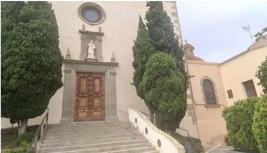
Iglesia de san pedro iglesia