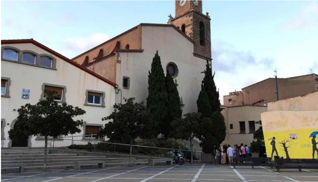
Iglesia de san pedro comentarios