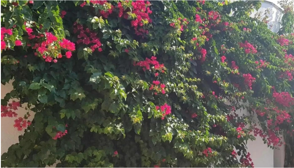
Iglesia de san pedro instagram