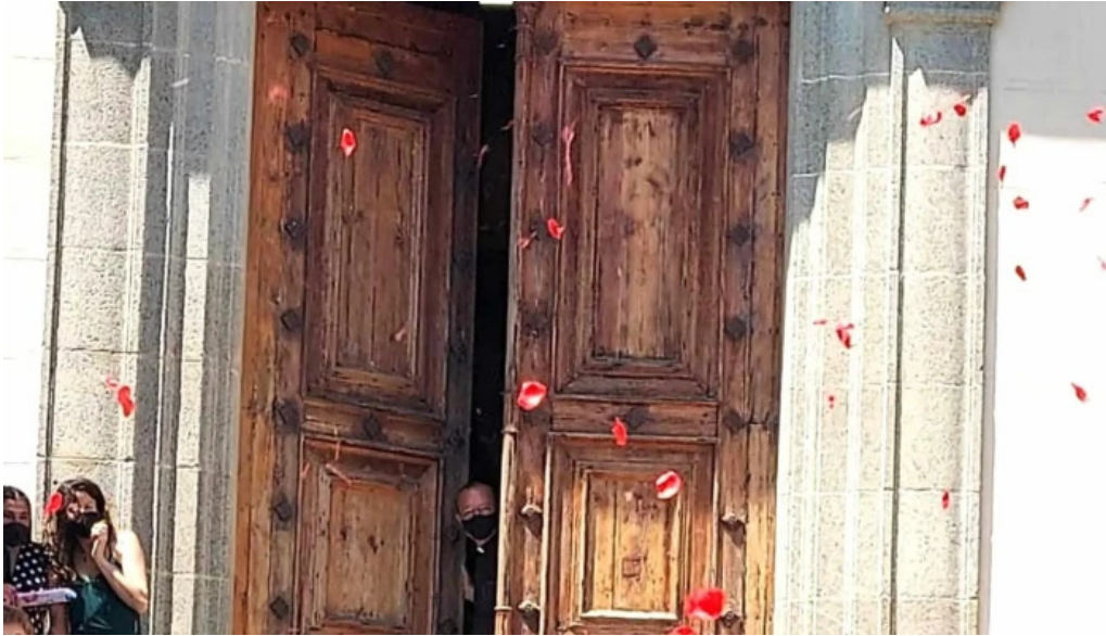
Iglesia de san pedro precios