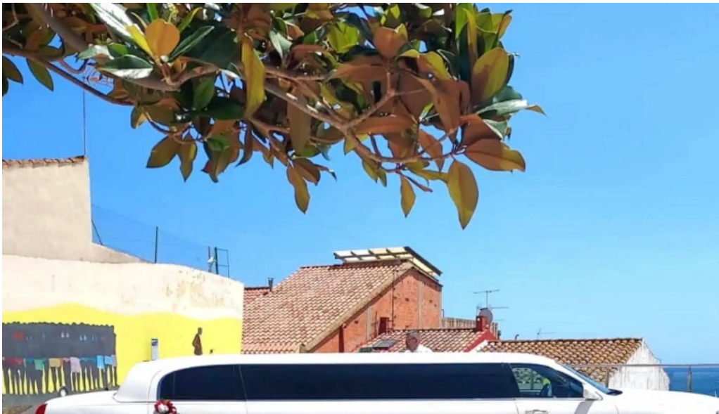
Iglesia de san pedro direccion