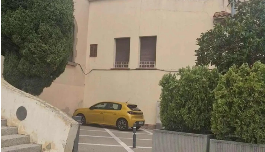
Iglesia de san pedro videos