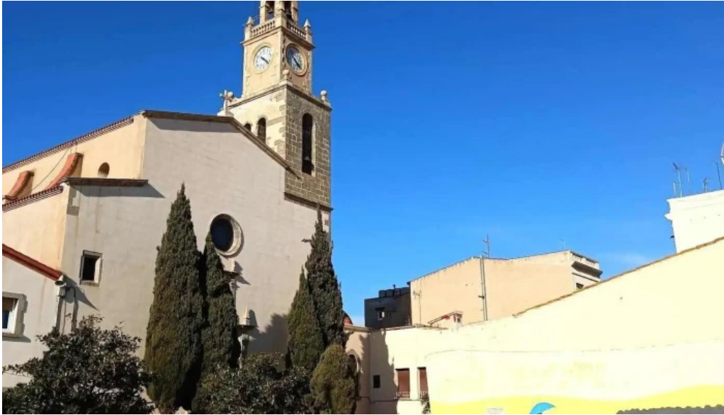
Iglesia de san pedro iglesia catolica