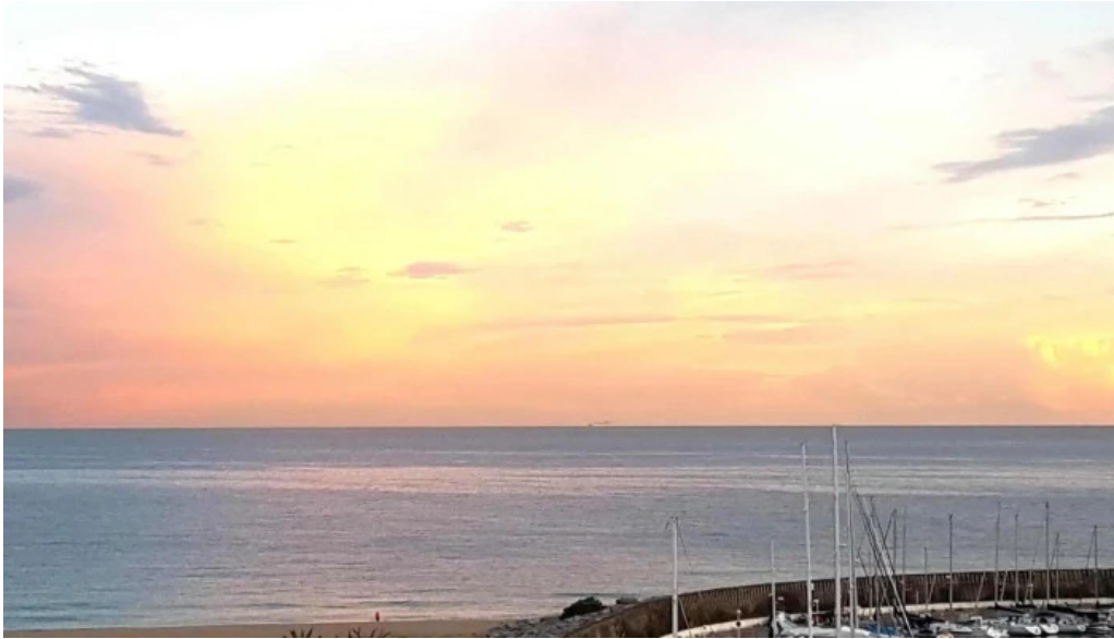
Iglesia de san pedro donde