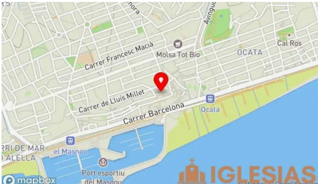
Iglesia de san pedro mapa