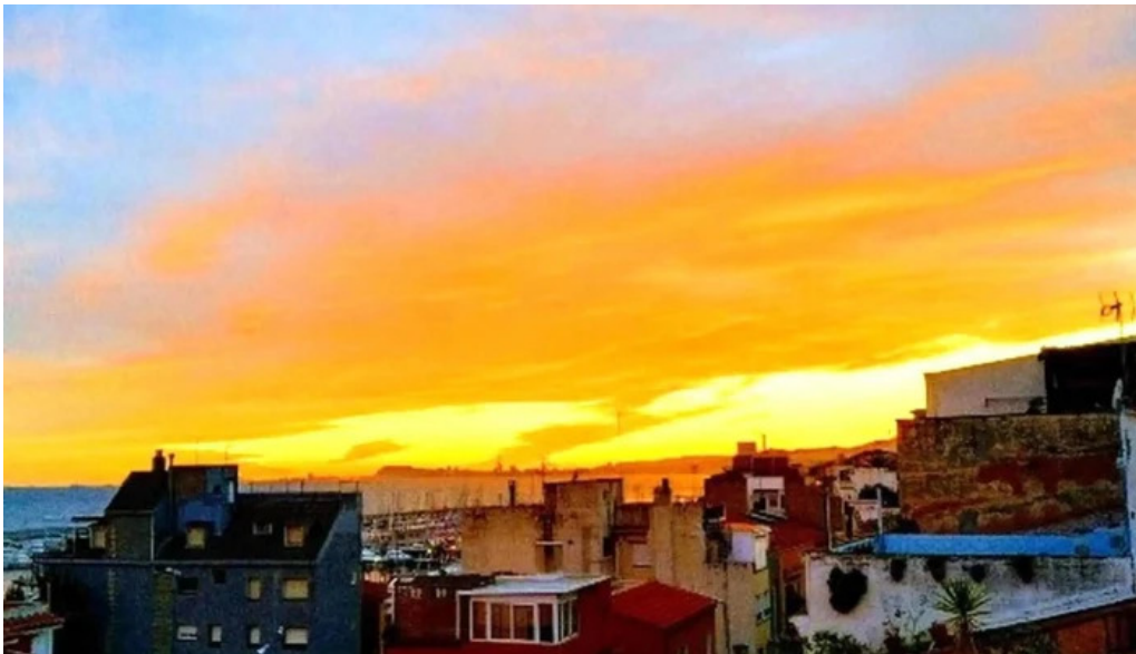
Iglesia de san pedro cerca de mi