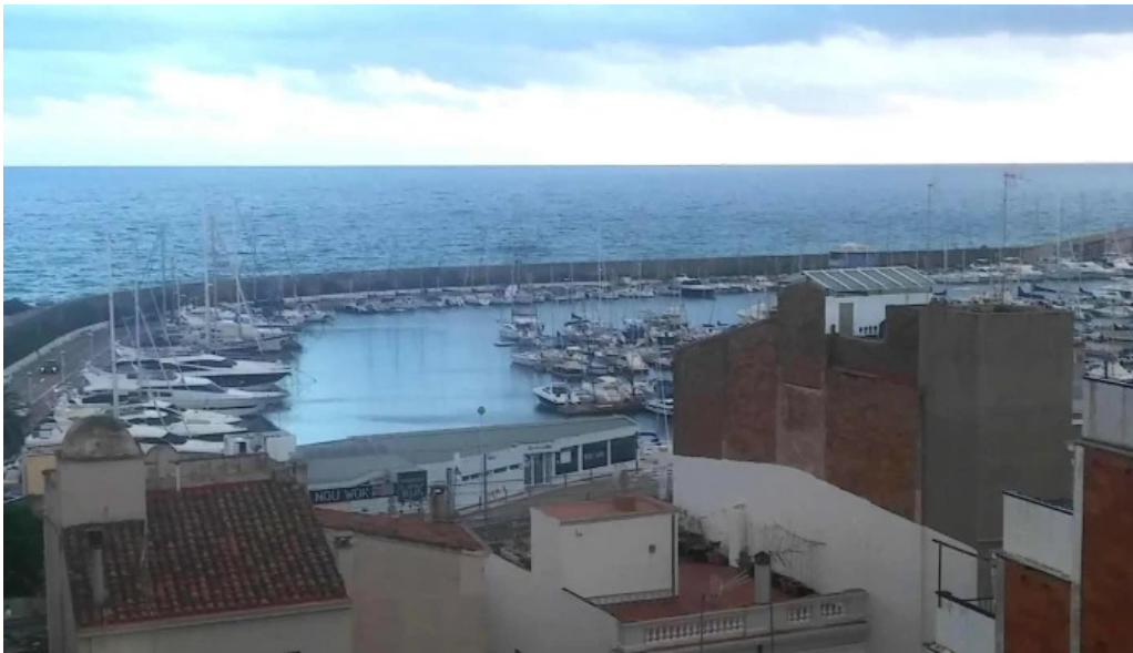
Iglesia de san pedro sitio web