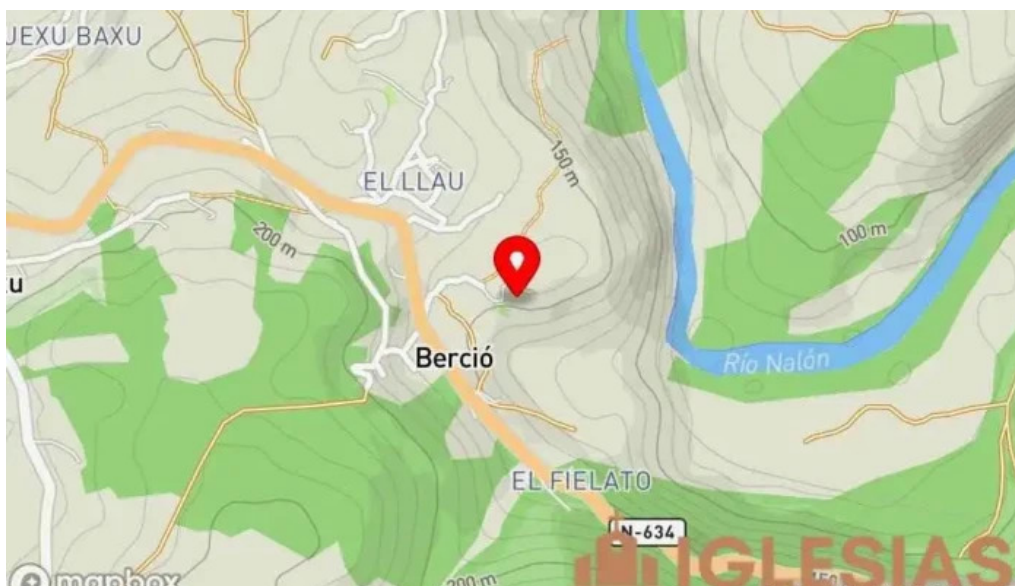
Capilla san emeterio el llau