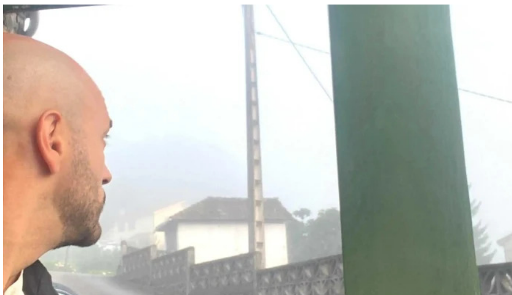
Capilla san emeterio iglesia catolica