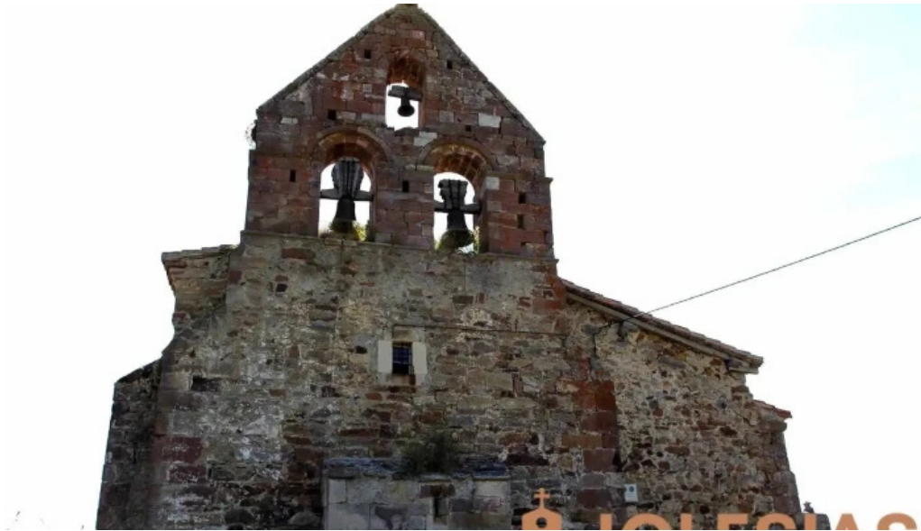
Iglesia de san pedro iglesia