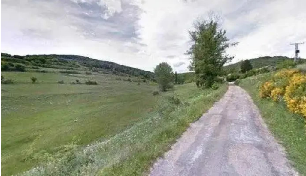
Iglesia de san pedro videos