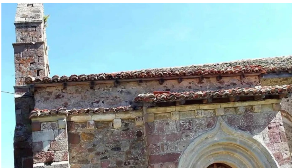
Iglesia de san pedro casavegas