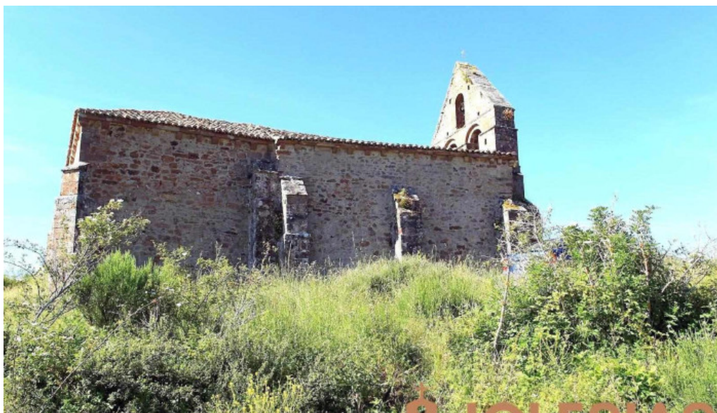
Iglesia de san pedro el campo