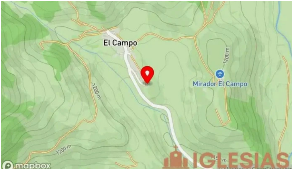
Iglesia de san pedro mapa