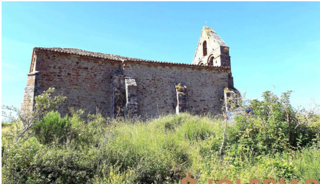
Iglesia de san pedro iglesia catolica