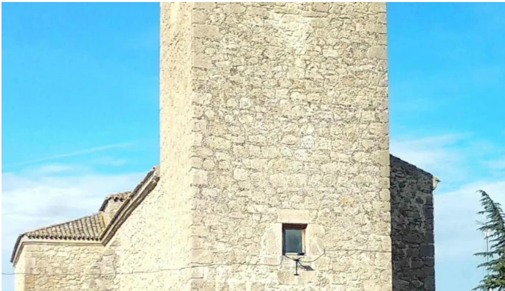
Iglesia de santo domingo de silos iglesia catolica