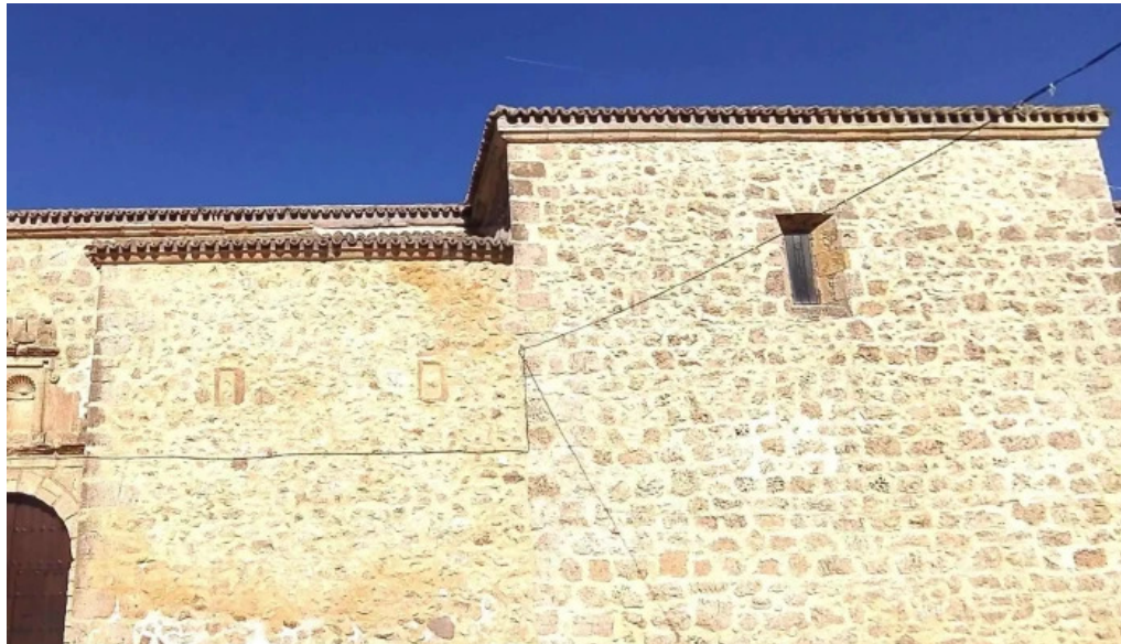
Iglesia de santo domingo de silos numero