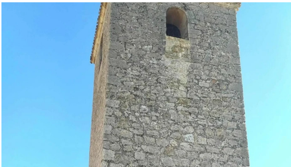
Iglesia de santo domingo de silos el acebron