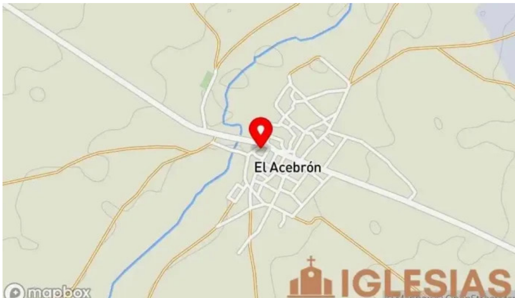
Iglesia de santo domingo de silos mapa