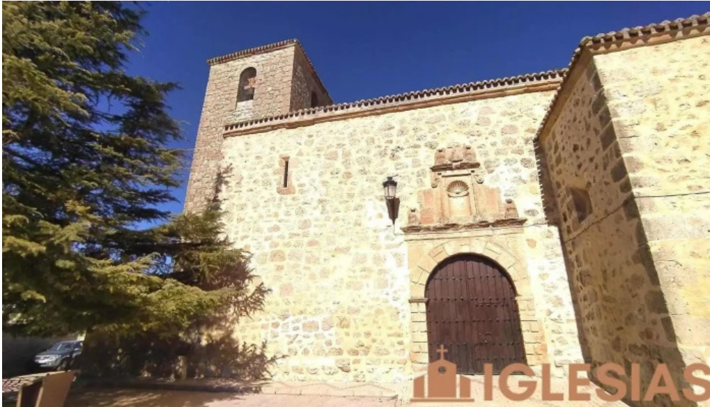
Iglesia de santo domingo de silos iglesia