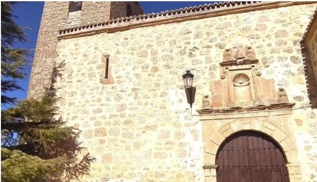
Iglesia de santo domingo de silos instagram