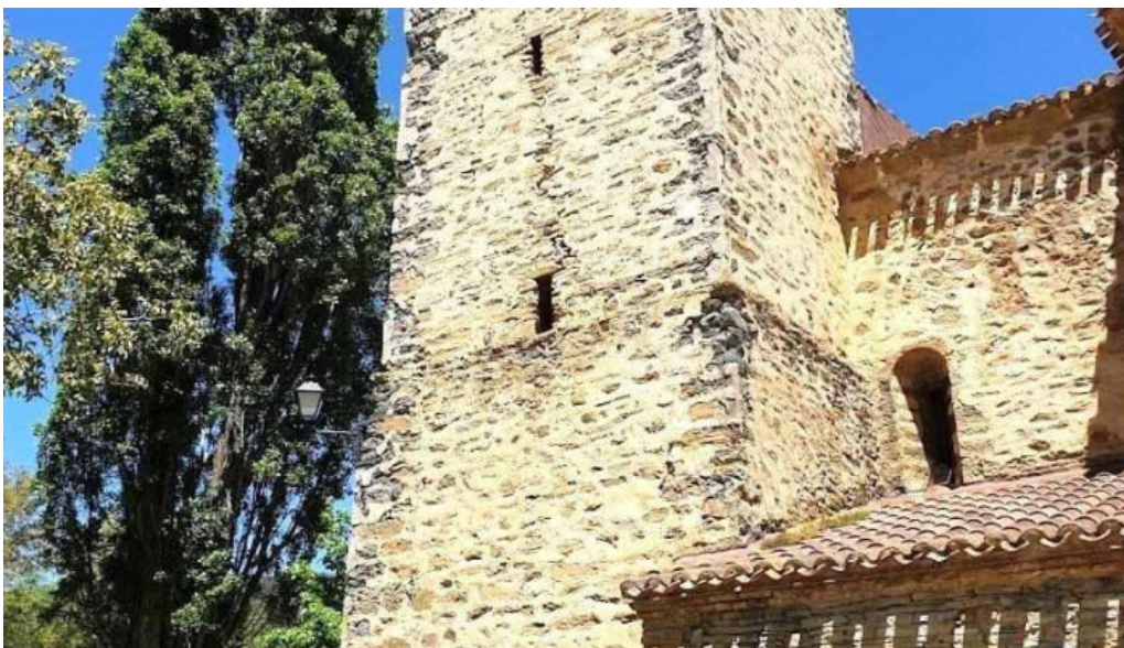
Iglesia de los santos justo y pastor diustes