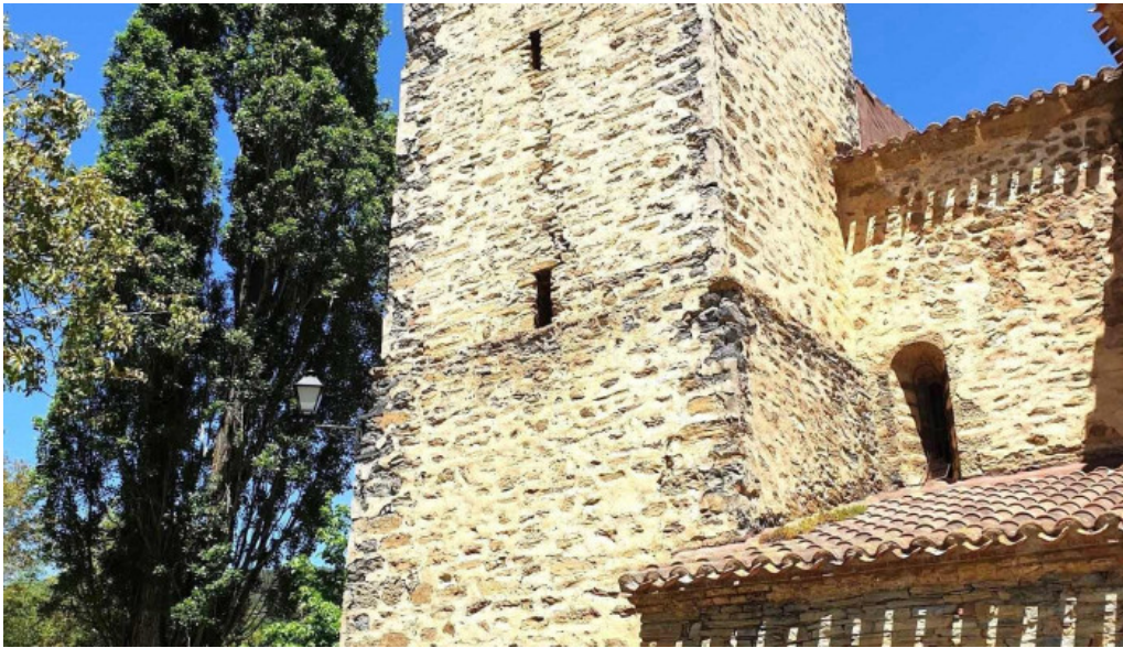
Iglesia de los santos justo y pastor iglesia catolica