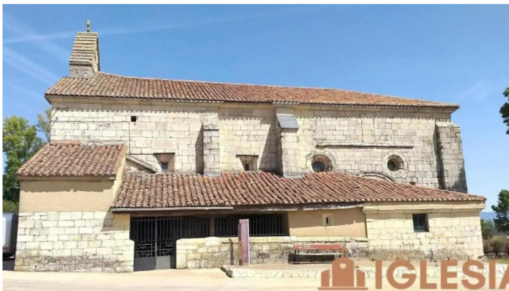
Iglesia de san pelayo dehesa de montejo