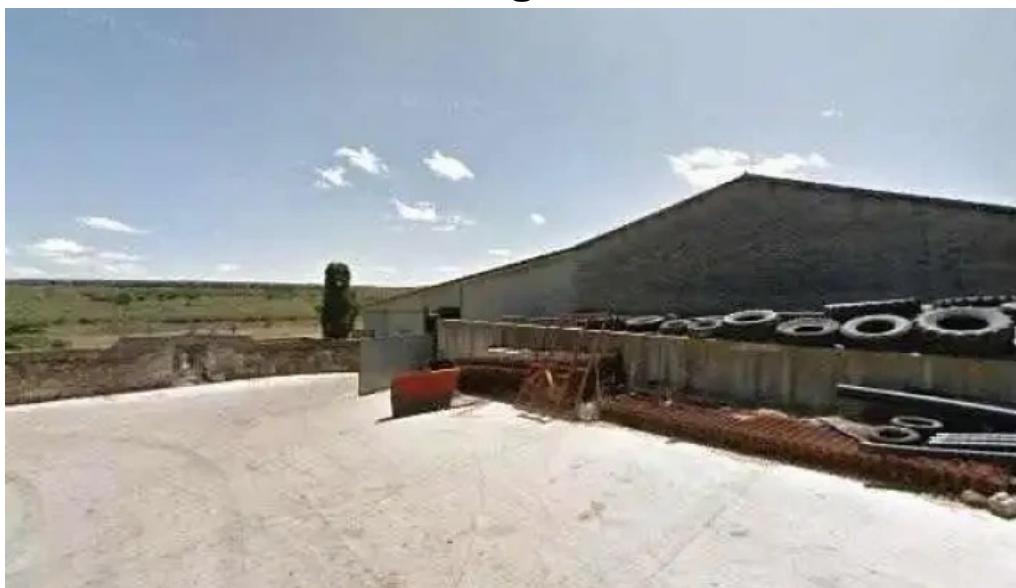
Iglesia de san pelayo precios