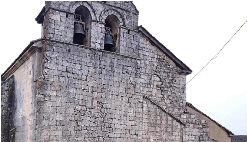
Iglesia de san pelayo iglesia