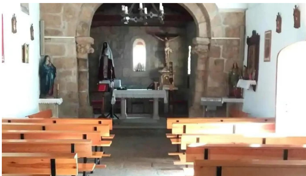
Iglesia de santa maria de rutis iglesia