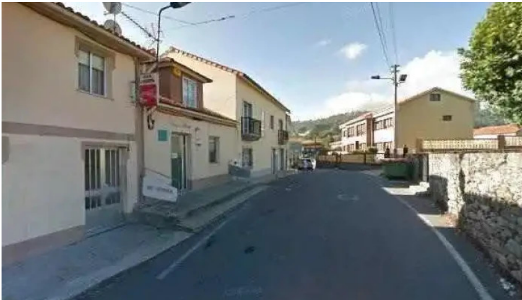
Iglesia de santa maria de rutis fotos