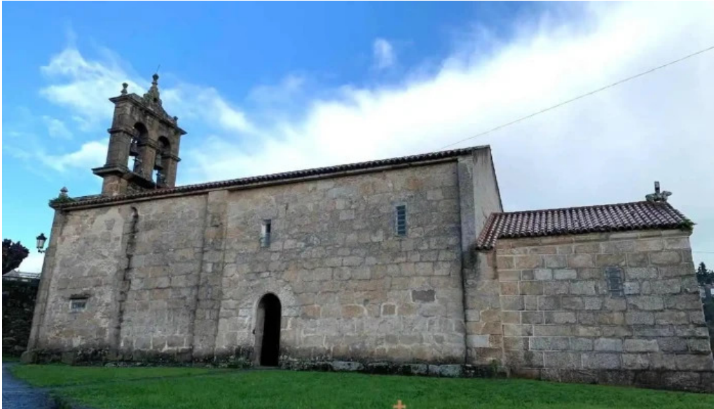
Iglesia de santa maria de rutis culleredo