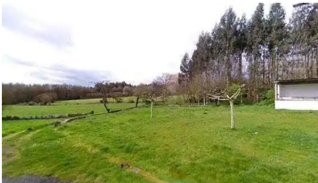
Iglesia de santa maria de cospeito iglesia catolica