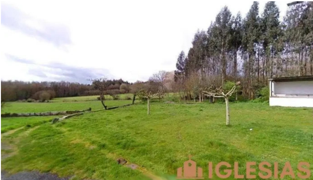
Iglesia de santa maria de cospeito cospeito