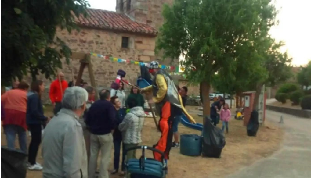
Iglesia de santa maria iglesia catolica