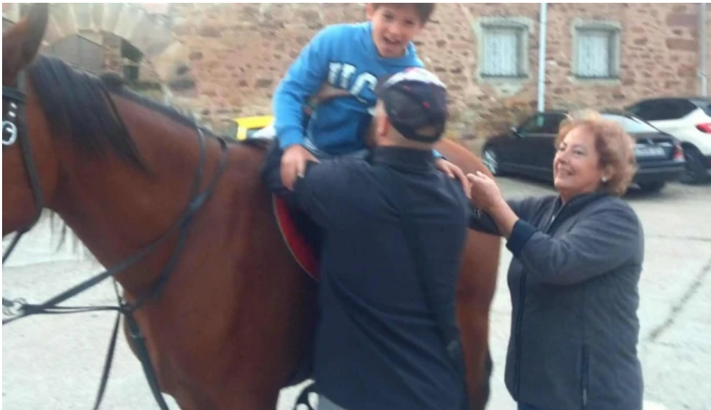
Iglesia de santa maria cordovilla de aguilar