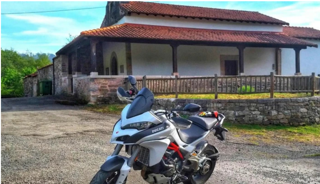
Iglesia parroquial de san pedro de cuaya coalla