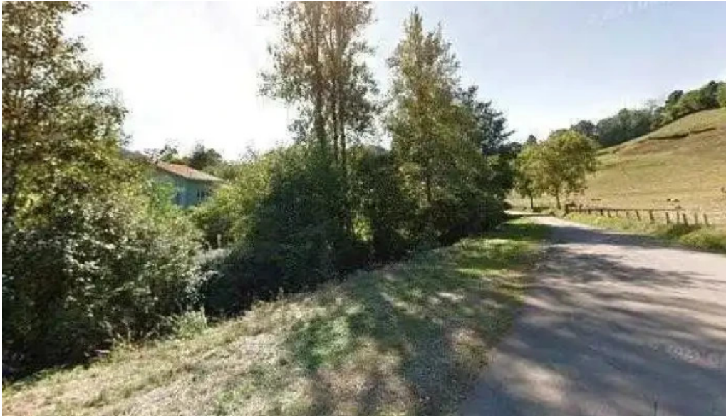
Iglesia parroquial de san pedro de cuaya iglesia catolica