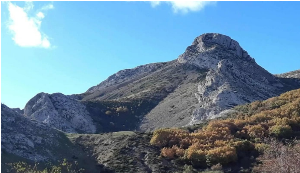
Iglesia de san cristobal fotos