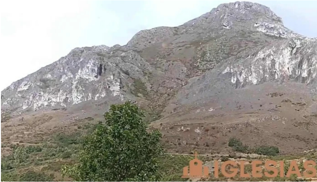
Iglesia de san cristobal videos