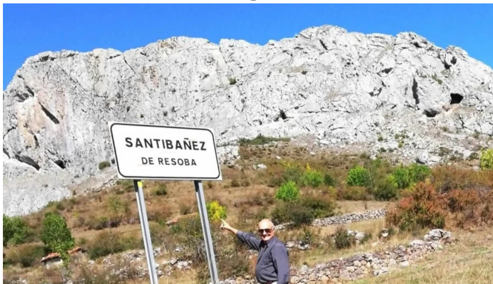
Iglesia de san cristobal zona