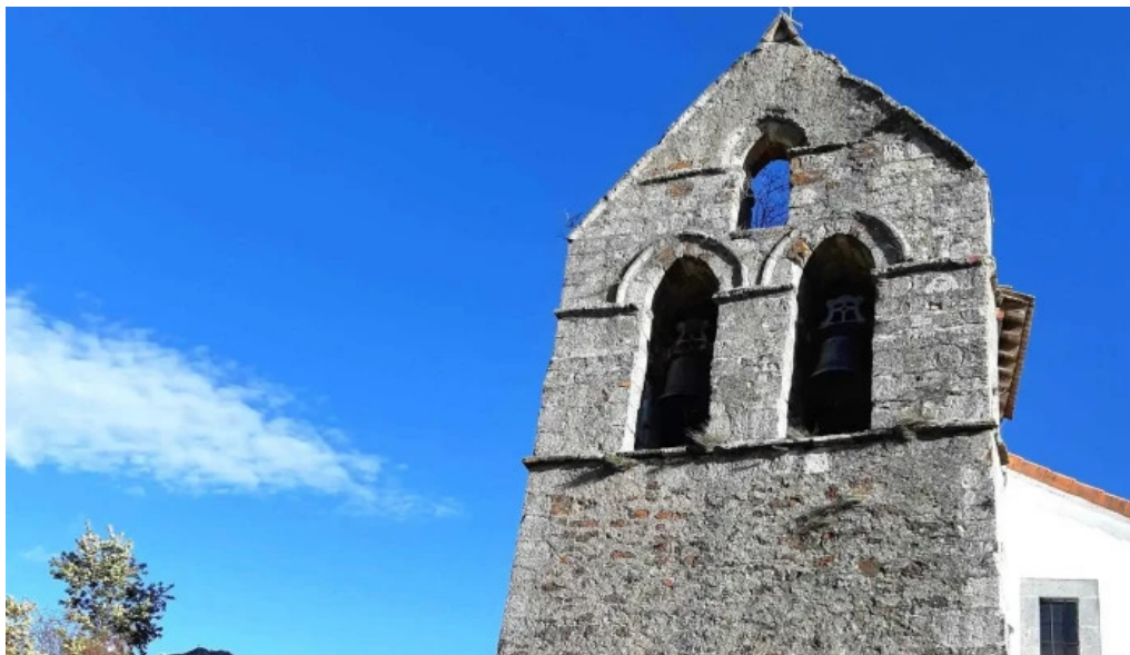
Iglesia de san cristobal abierto ahora