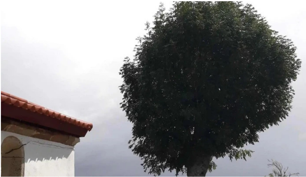
Iglesia de san cristobal donde