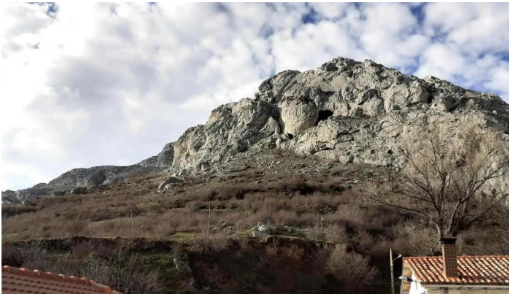
Iglesia de san cristobal promocion