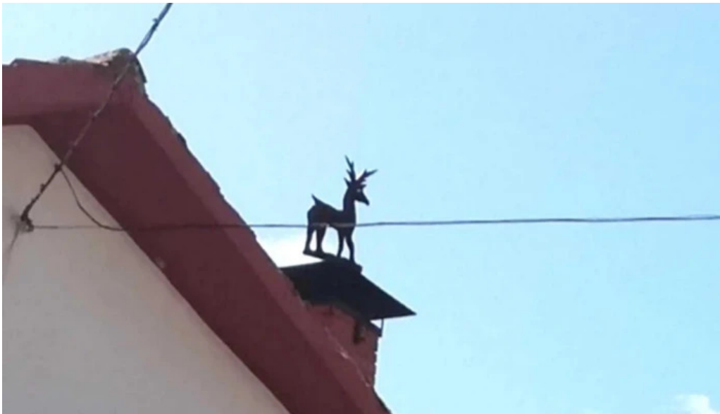
Iglesia de san cristobal sitio web