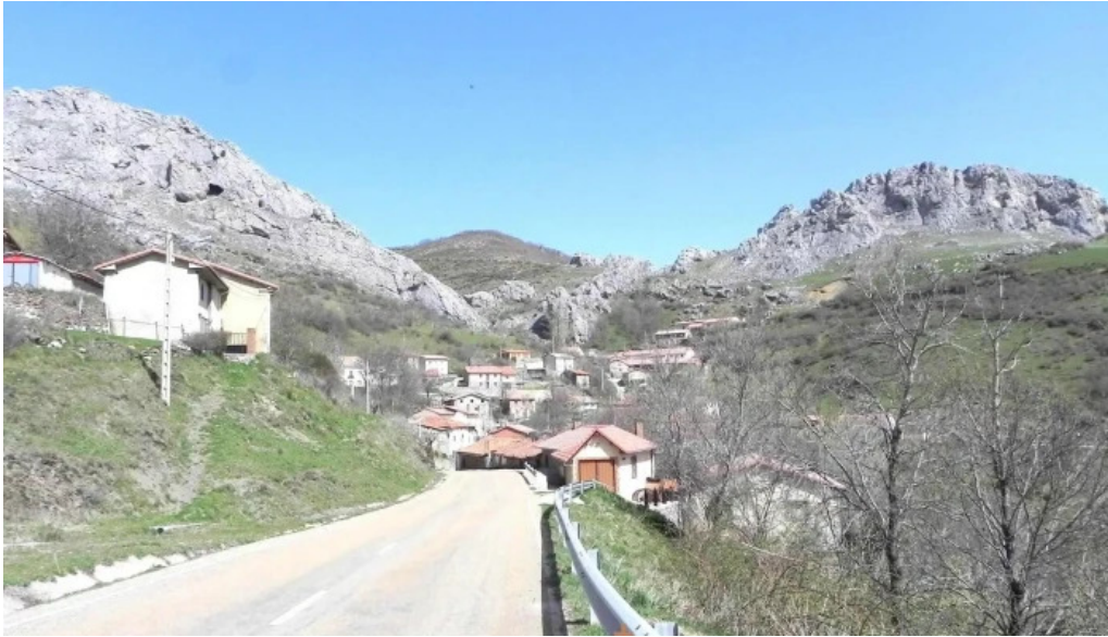
Iglesia de san cristobal santibanez de resoba