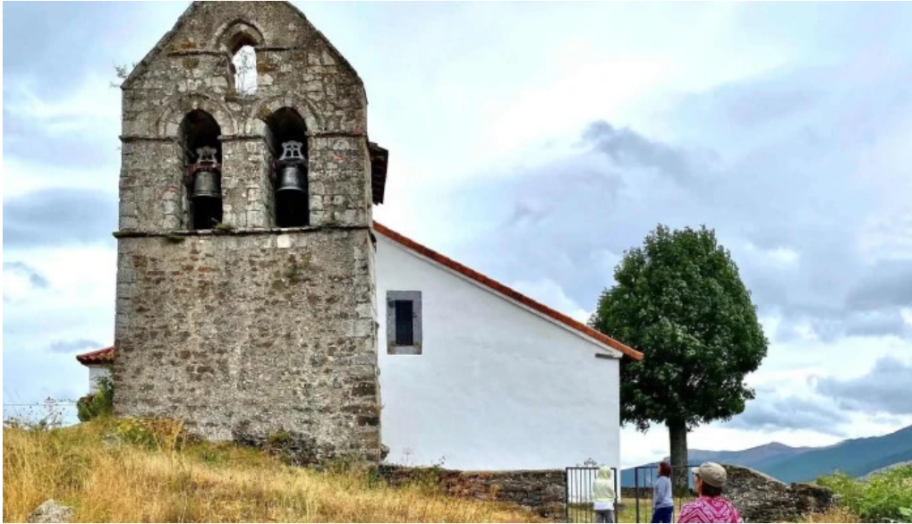
Iglesia de san cristobal iglesia catolica