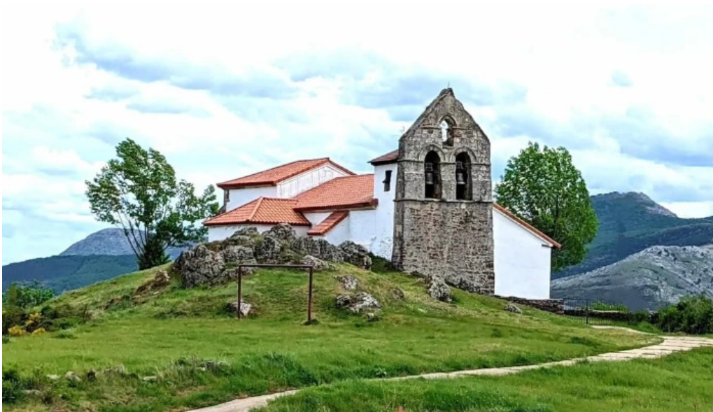
Iglesia de san cristobal iglesia