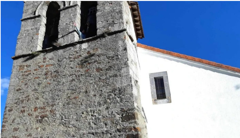
Iglesia de san cristobal cervera de pisuerga