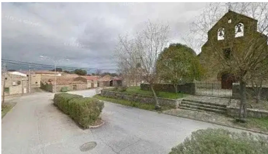
Iglesia de nuestra senora del rosario iglesia catolica