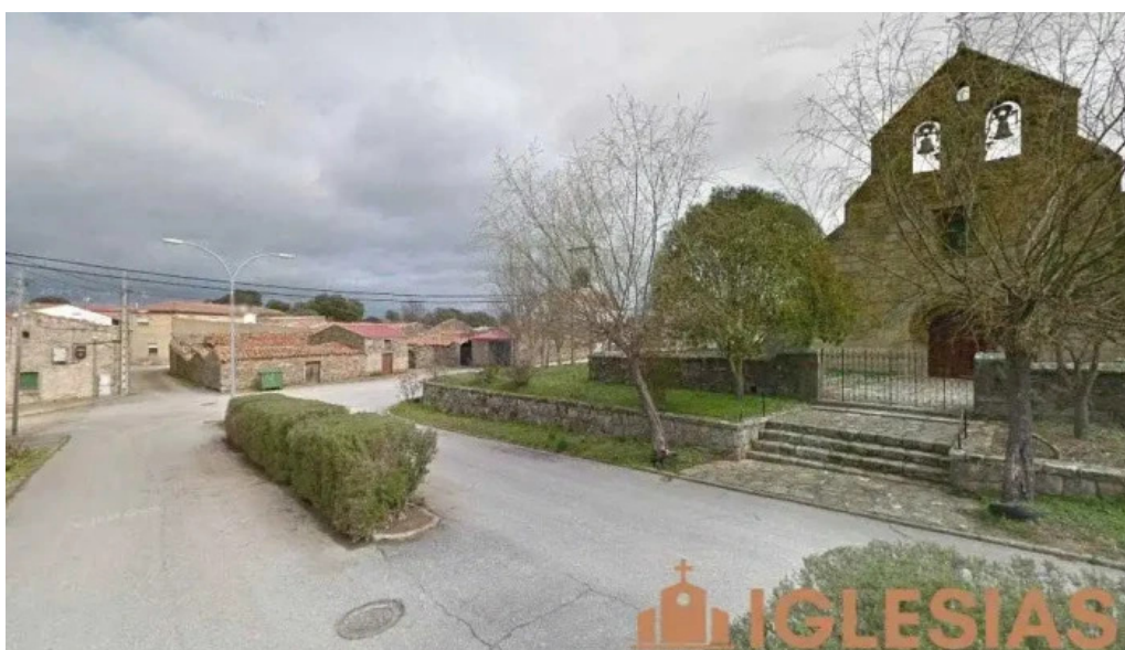
Iglesia de nuestra senora del rosario cerralbo