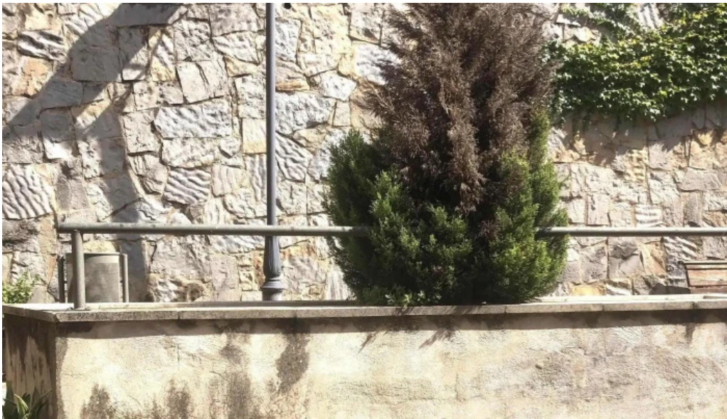
Esglesia de santa maria comentarios