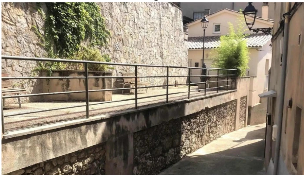
Esglesia de santa maria puntaje