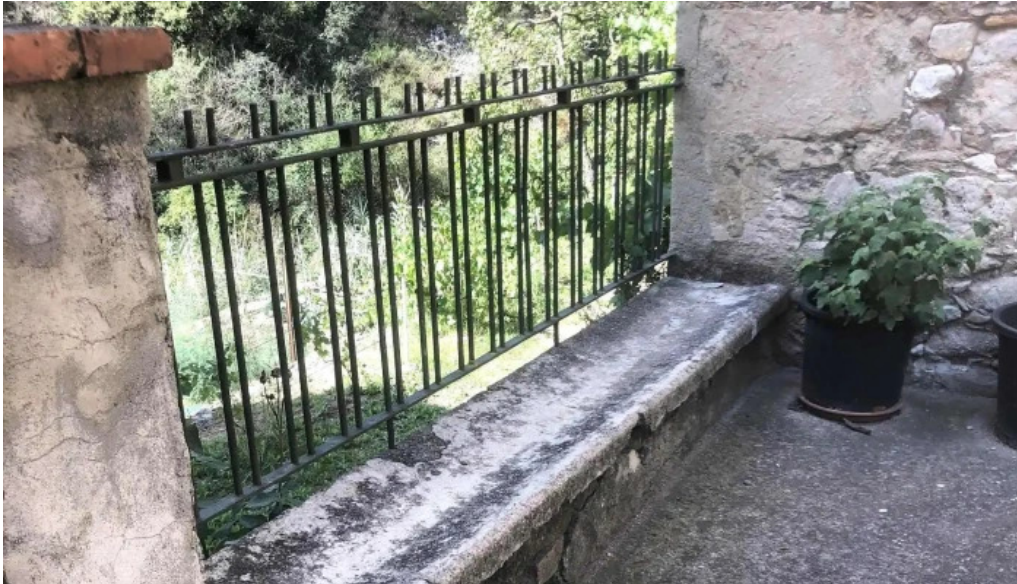
Esglesia de santa maria cercs