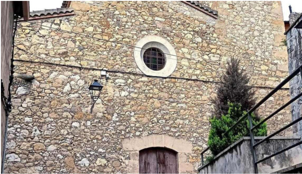
Esglesia de santa maria iglesia