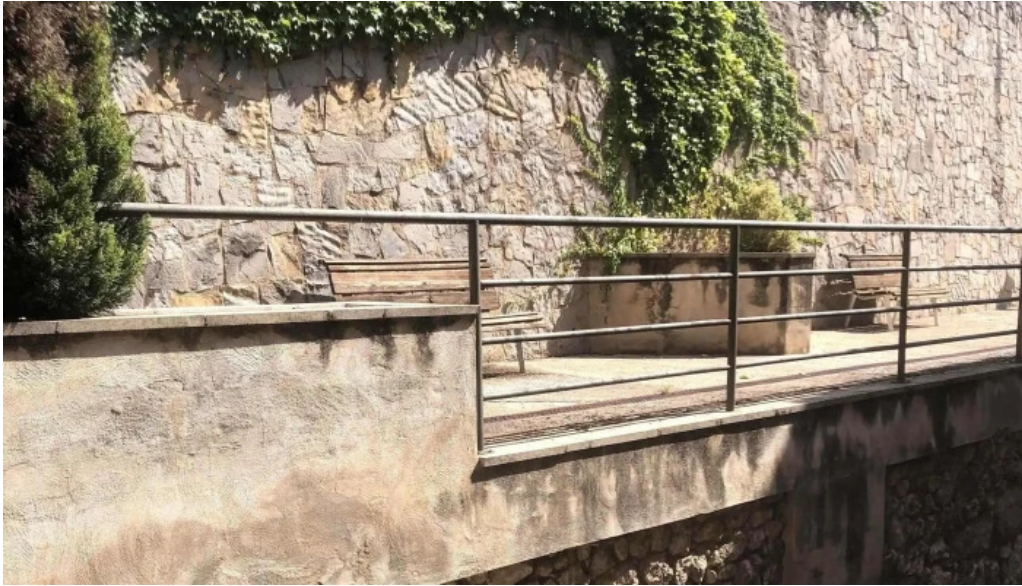
Esglesia de santa maria como llegar