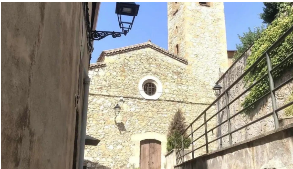
Esglesia de santa maria iglesia catolica