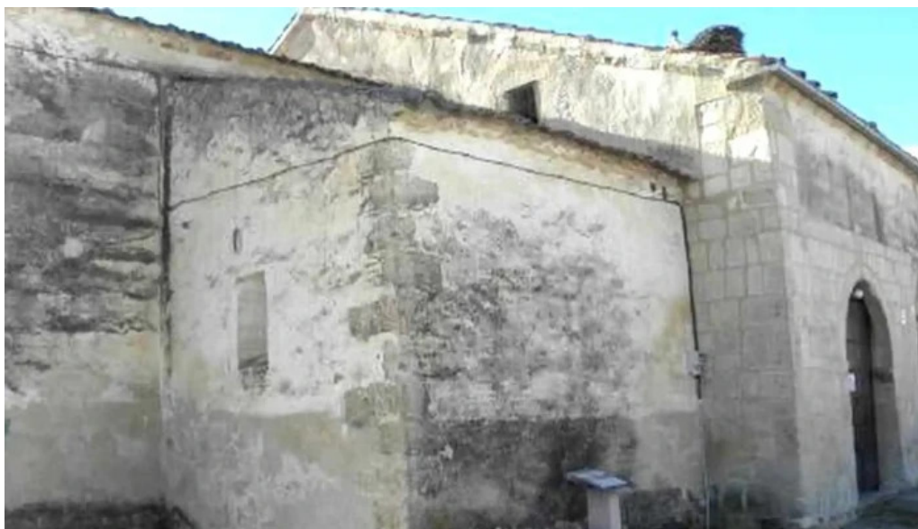
Iglesia de san miguel arcangel castroserna de abajo