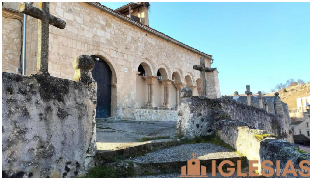
Iglesia de san miguel arcangel iglesia catolica