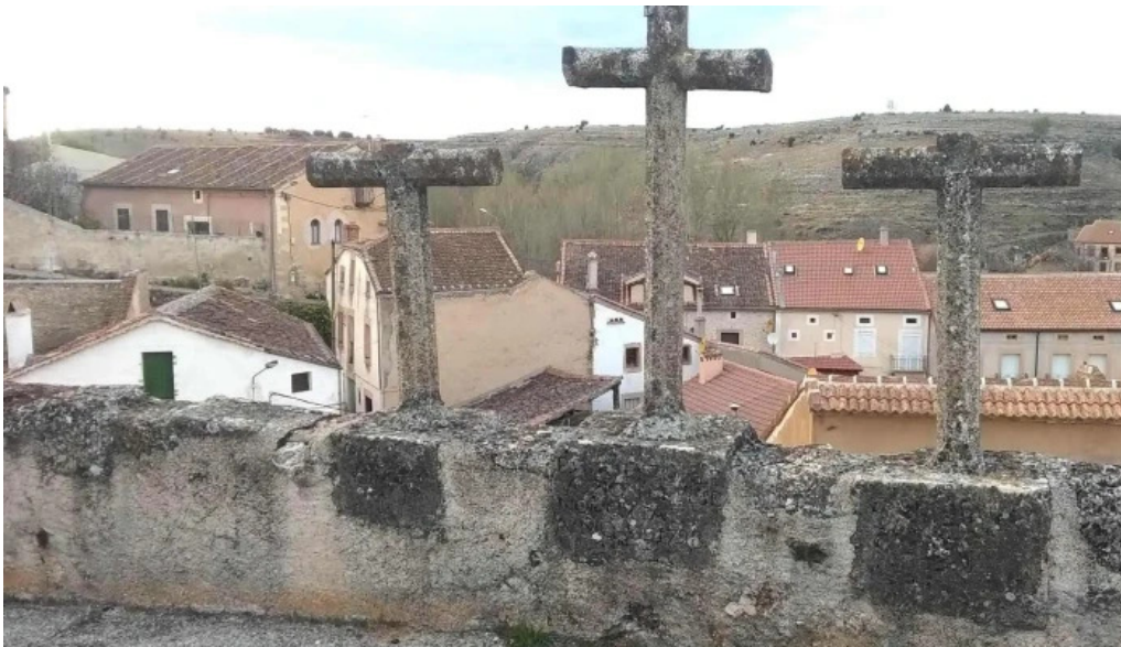
Iglesia de san miguel arcangel telefono