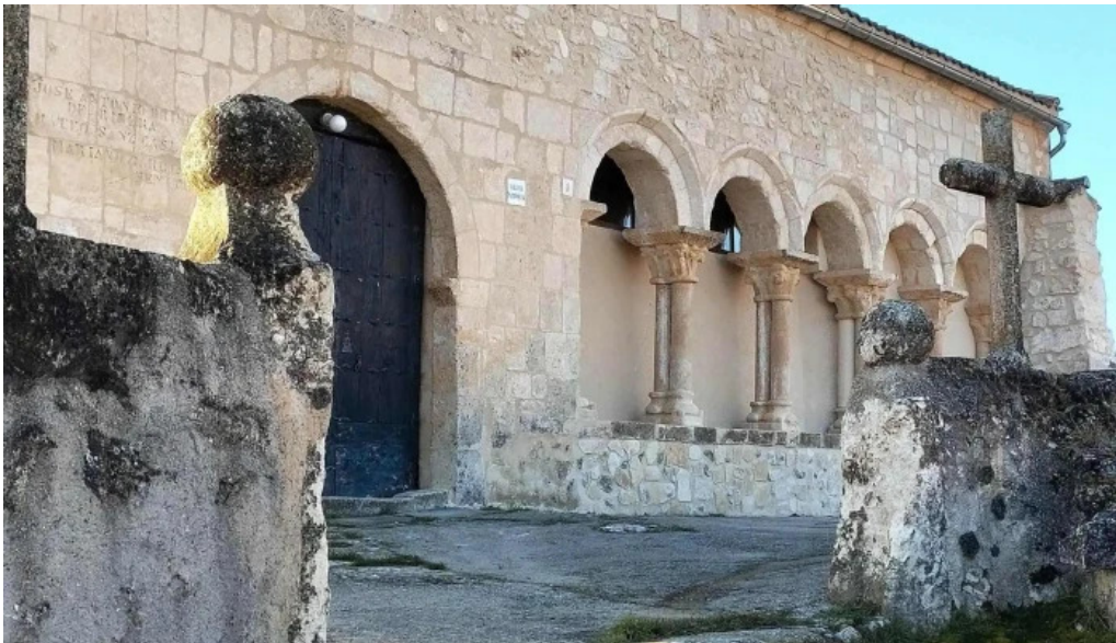
Iglesia de san miguel arcangel instagram