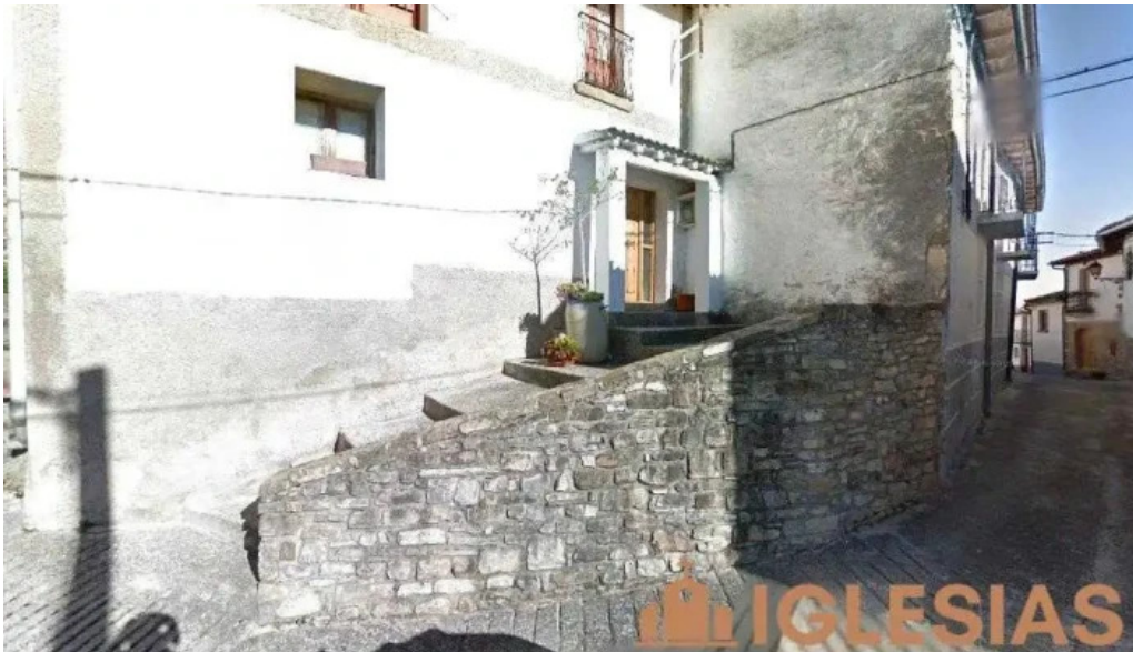
Iglesia de san martin castillonuevo