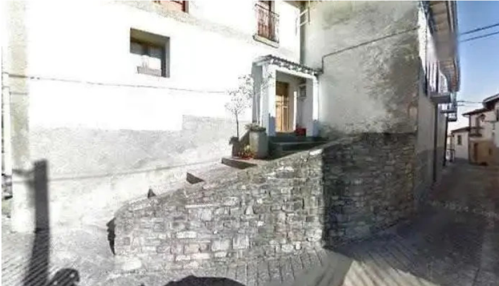
Iglesia de san martin iglesia catolica