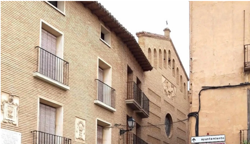
Iglesia santa vicenta maria numero