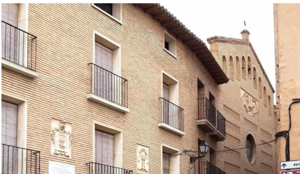
Iglesia santa vicenta maria cascante