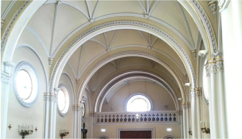
Iglesia santa vicenta maria opiniones