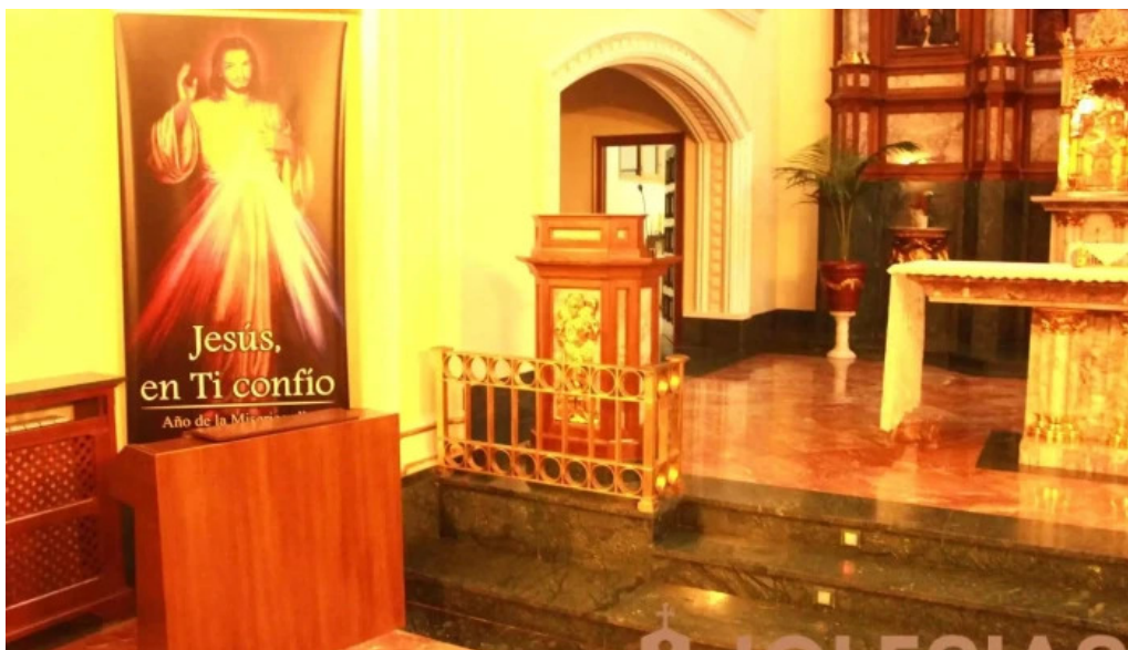
Iglesia santa vicenta maria iglesia catolica