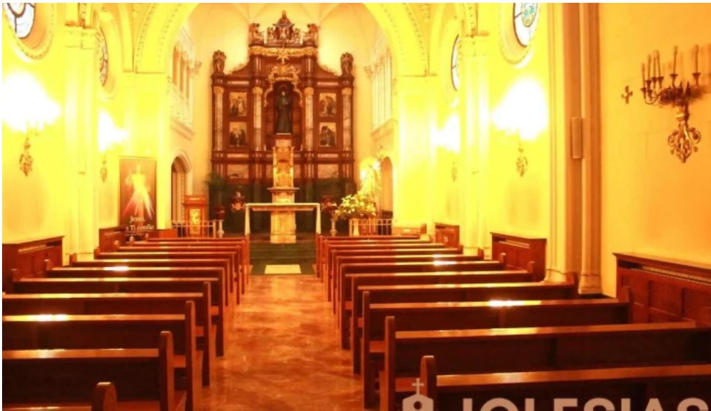
Iglesia santa vicenta maria iglesia