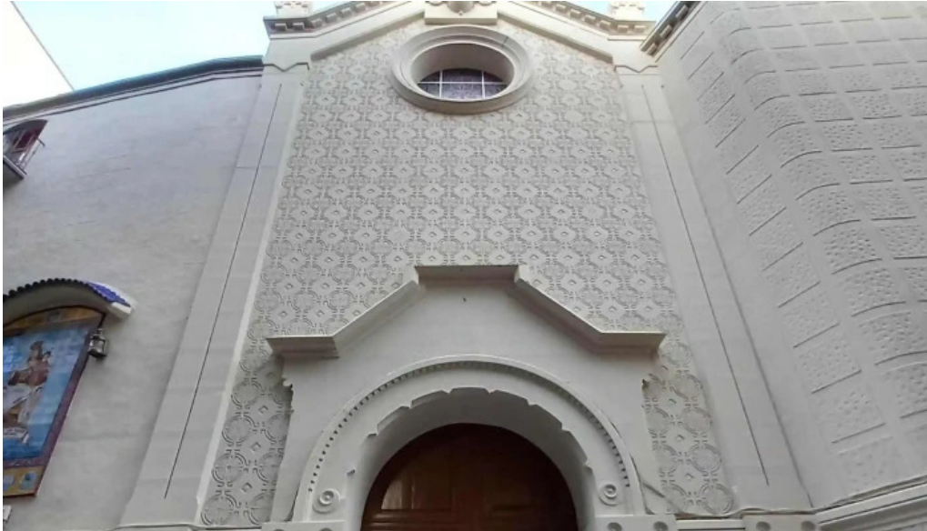
Iglesia castrense de santo domingo cartagena