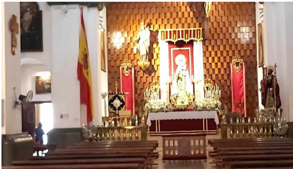
Iglesia castrense de santo domingo descuentos