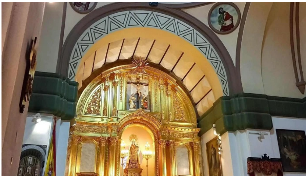
Iglesia castrense de santo domingo instagram