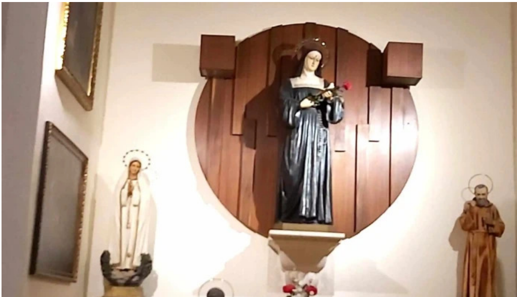
Iglesia castrense de santo domingo fotos