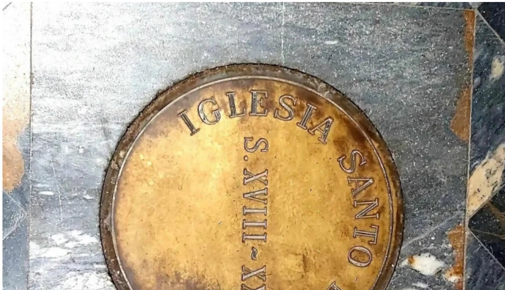
Iglesia castrense de santo domingo direccion