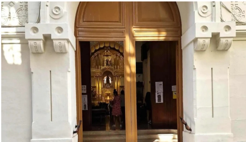
Iglesia castrense de santo domingo precios