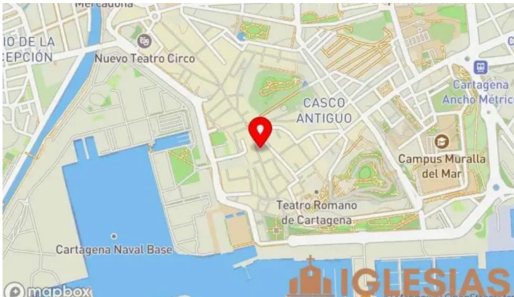
Iglesia castrense de santo domingo mapa