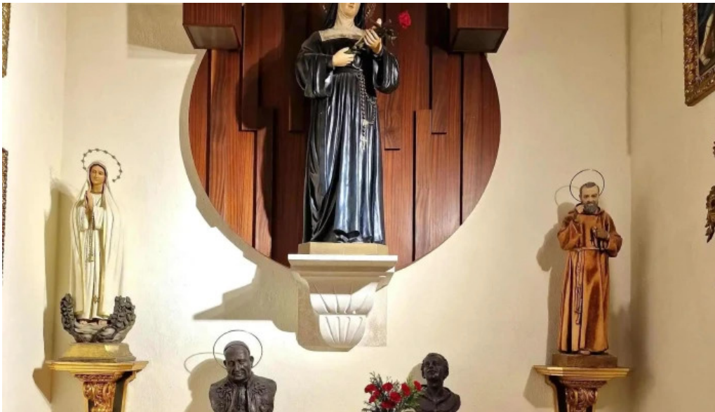
Iglesia castrense de santo domingo telefono