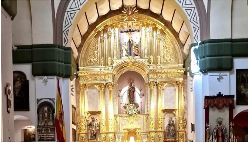
Iglesia castrense de santo domingo horario