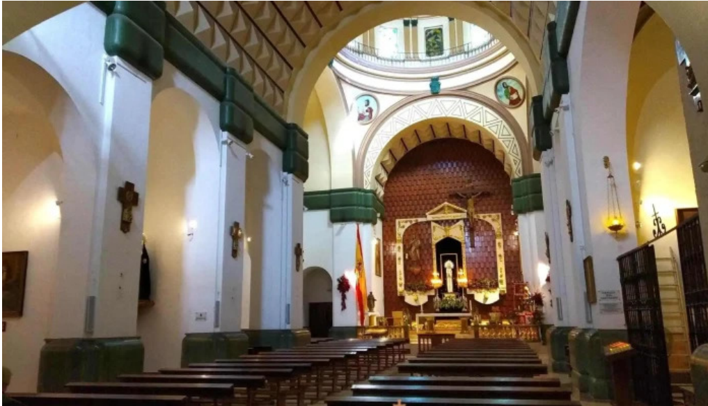
Iglesia castrense de santo domingo iglesia

10:00 h. Misa tercios infantiles Agrupación de San Pedro Apóstol. 11:00 h. Santa Misa y Bendición de Ramos 11:30 h. Santa Misa y Bendición de Ramos. 12:30 h. Misa Mayor y Bendición de Ramos. 19:00 h. Santa Misa y Bendición de Ramos. ;Adoradores para el Santísimo el Jueves Santo, pasar por la Sacristía!