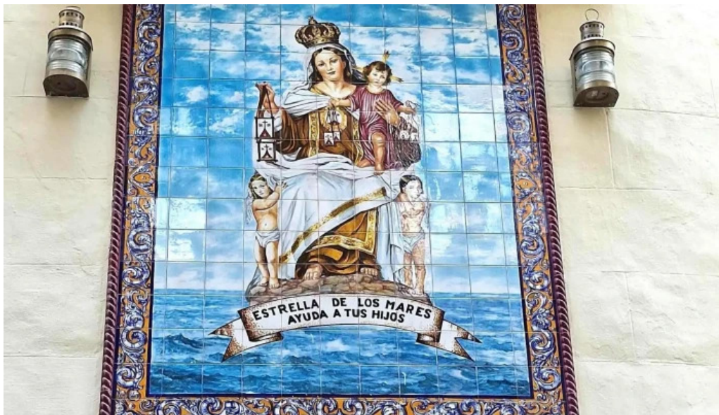
Iglesia castrense de santo domingo como llegar