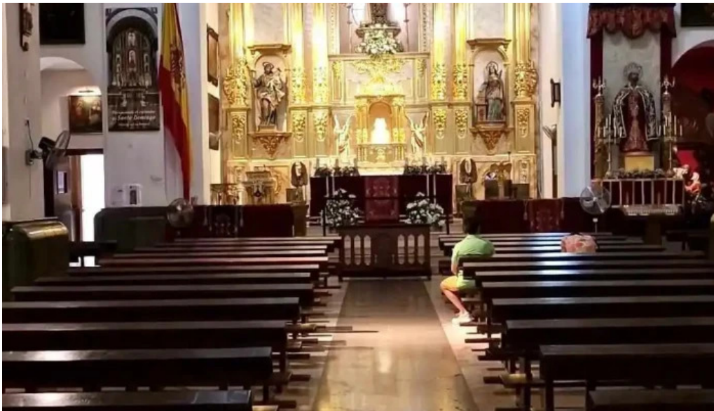
Iglesia castrense de santo domingo videos