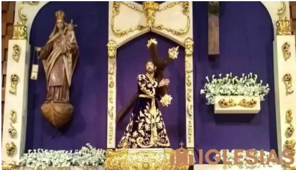
Iglesia castrense de santo domingo del propietario