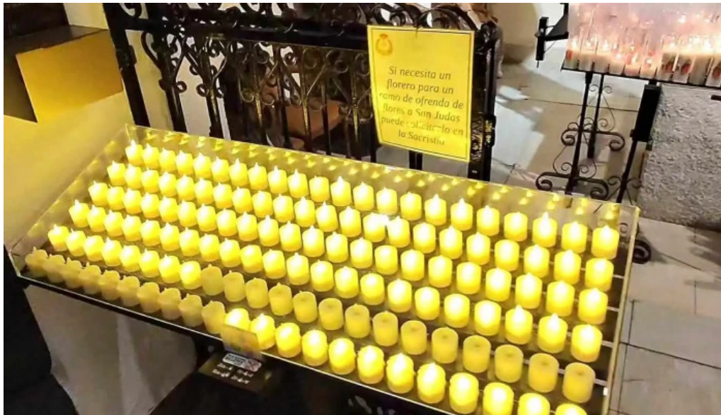
Iglesia castrense de santo domingo recientes