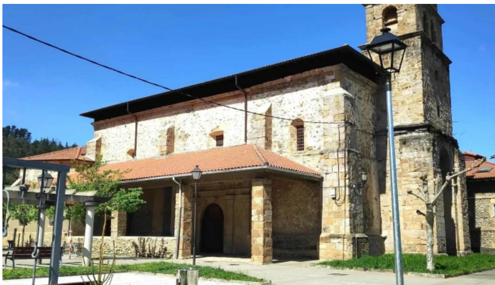
Iglesia de san martin abierto ahora