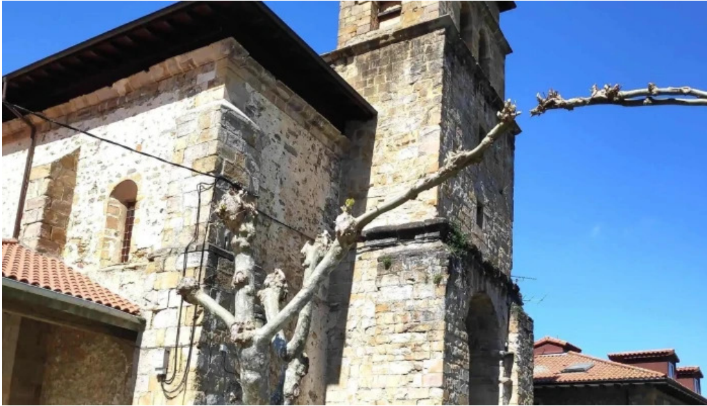
Iglesia de san martin catalago