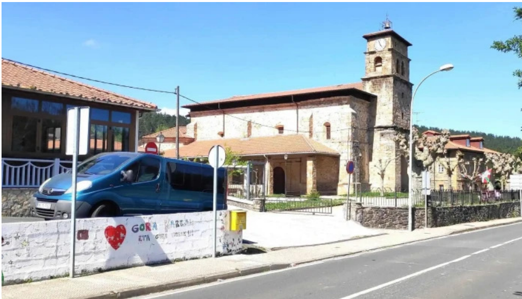
Iglesia de san martin como llegar