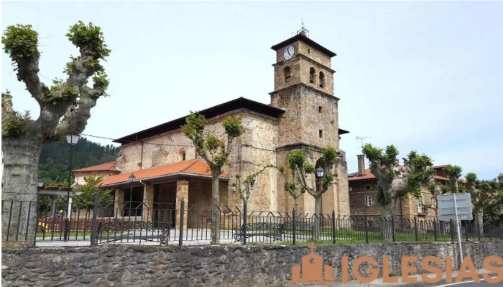
Iglesia de san martin iglesia catolica