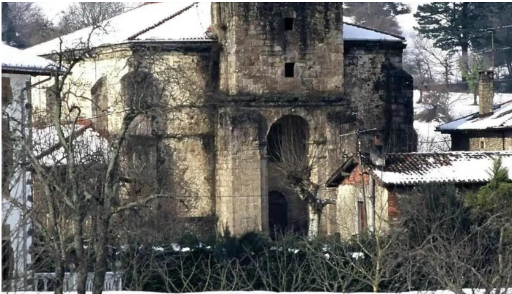
Iglesia de san martin iglesia