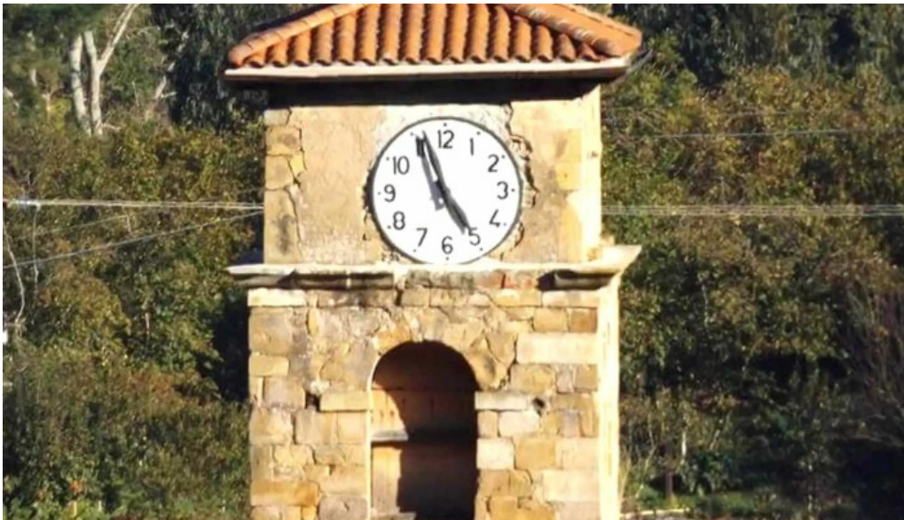
Iglesia de san martin carral