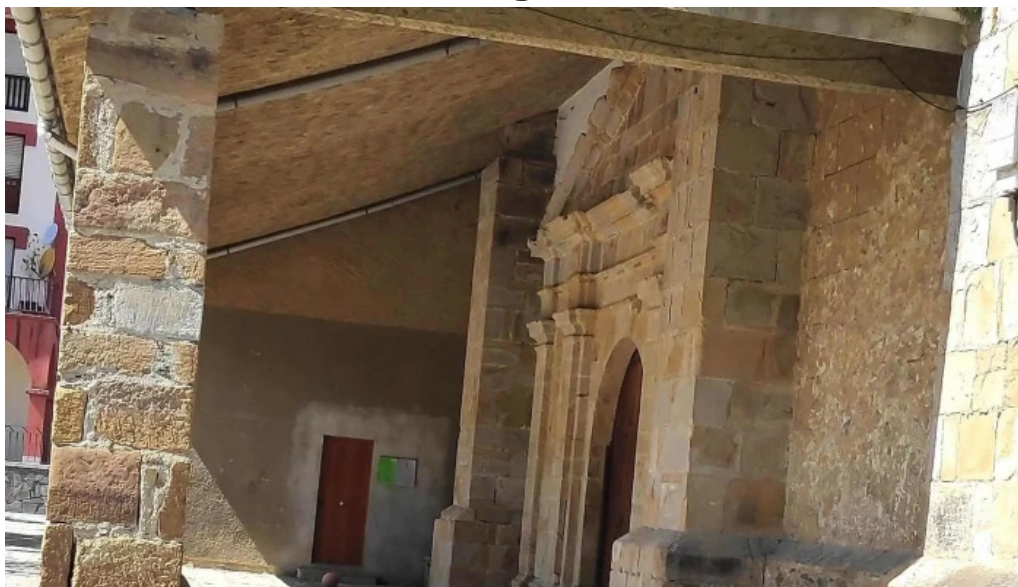
Iglesia de san martin numero