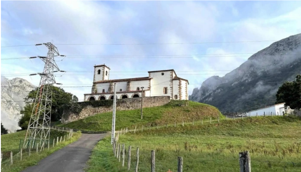
Iglesia de santa maria iglesia catolica