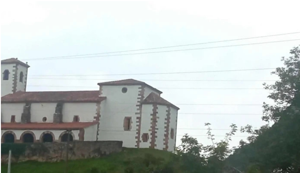
Iglesia de santa maria cantabria