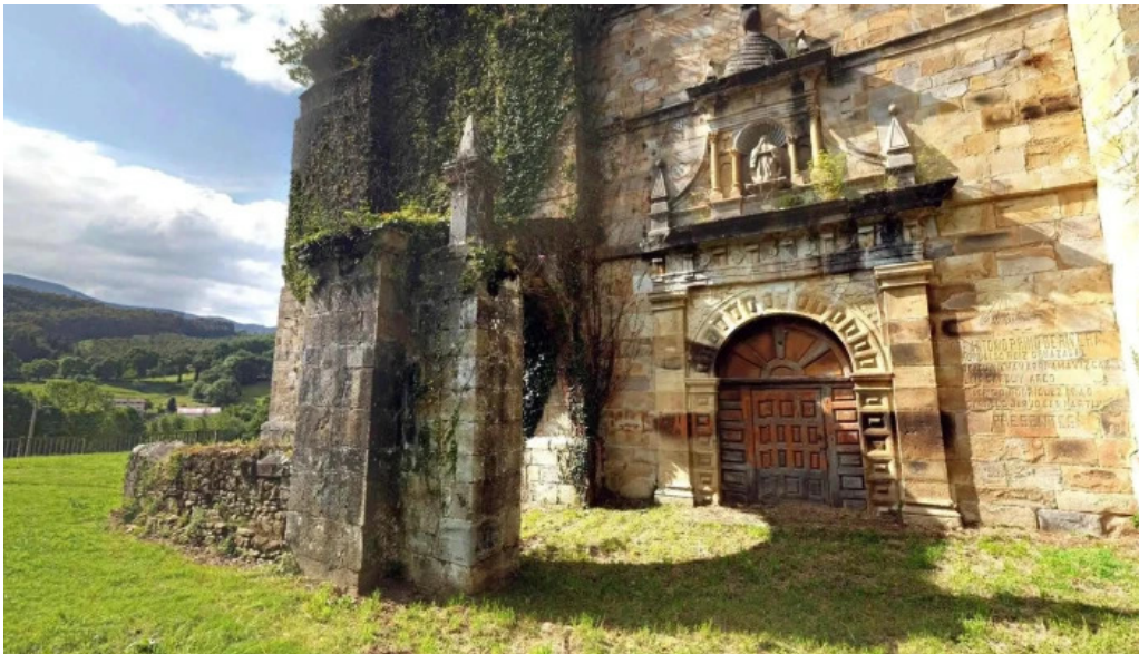
Iglesia de santa maria iglesia catolica