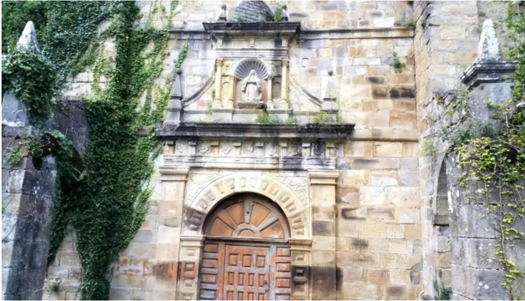
Iglesia de santa maria iglesia