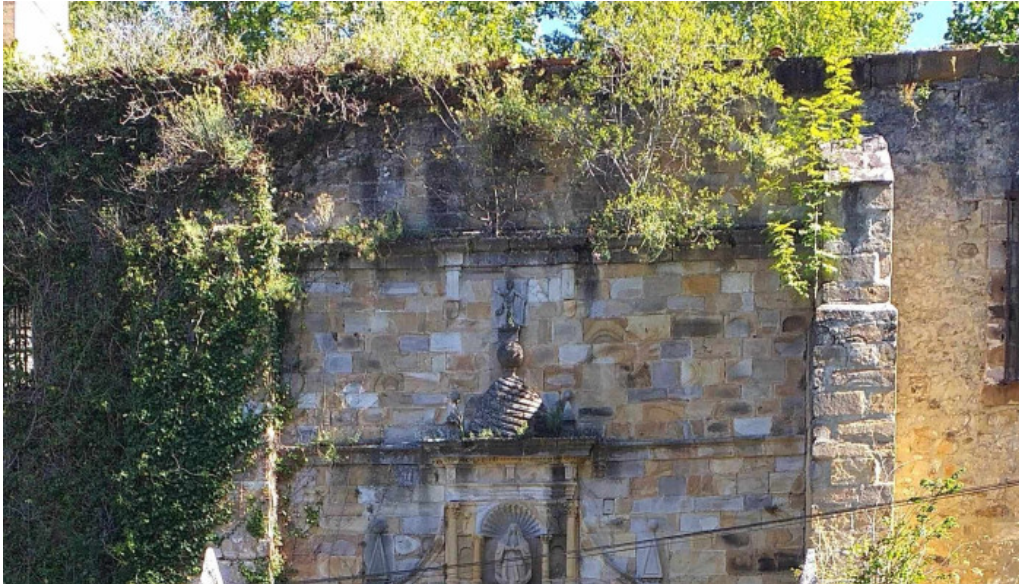
Iglesia de santa maria cantabria