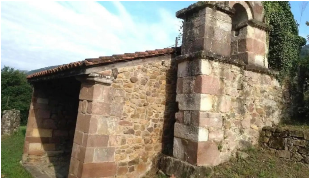
Ermita de san antonio abad s xvii cantabria