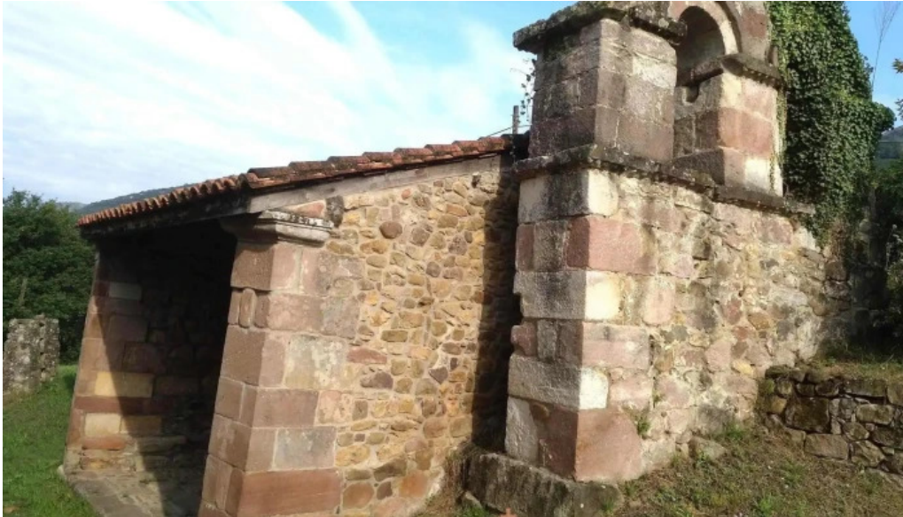
Ermita de san antonio abad sxvii iglesia catolica