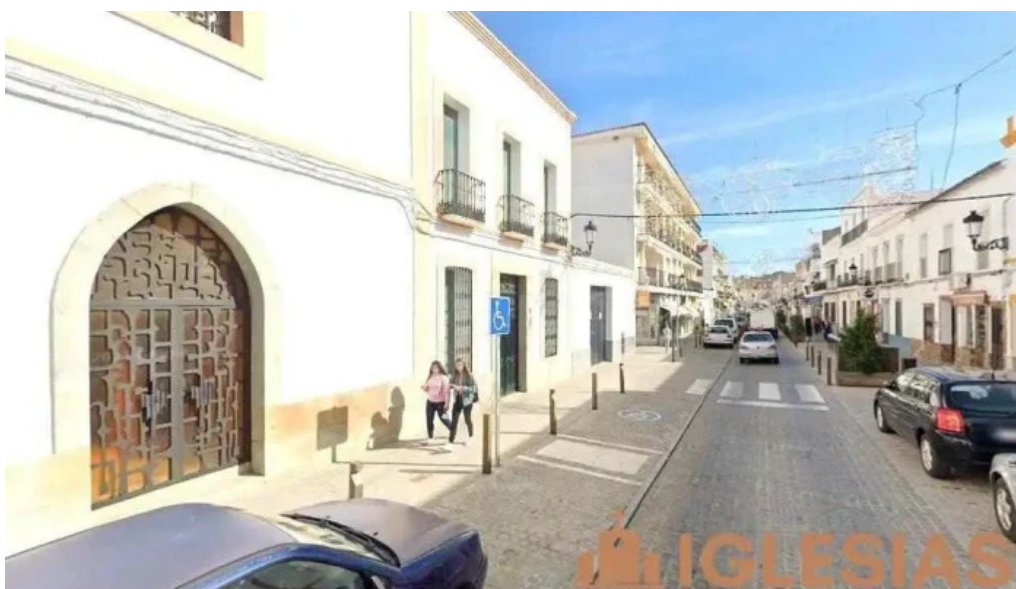
Iglesia de las hermanas carmelitas de la caridad de vedruna cabeza del buey