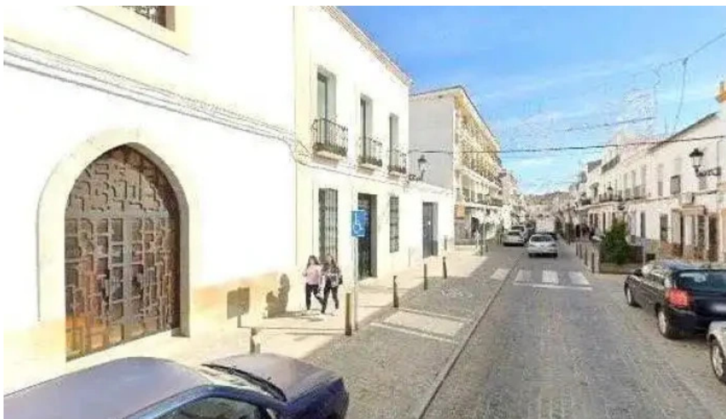
Iglesia de las hermanas carmelitas de la caridad de vedruna iglesia catolica