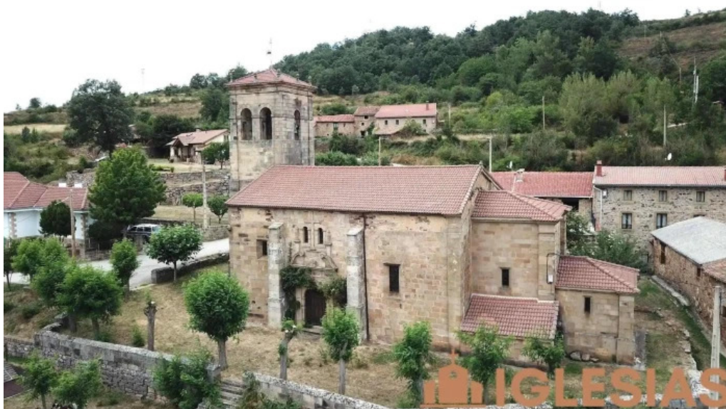
Iglesia de san martin bustillo del monte