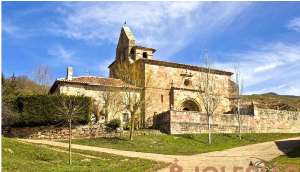
Iglesia de san bartolome iglesia