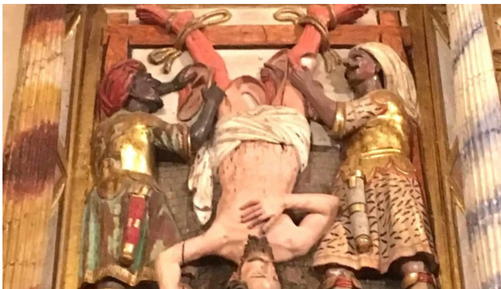
Iglesia de san bartolome catalogo