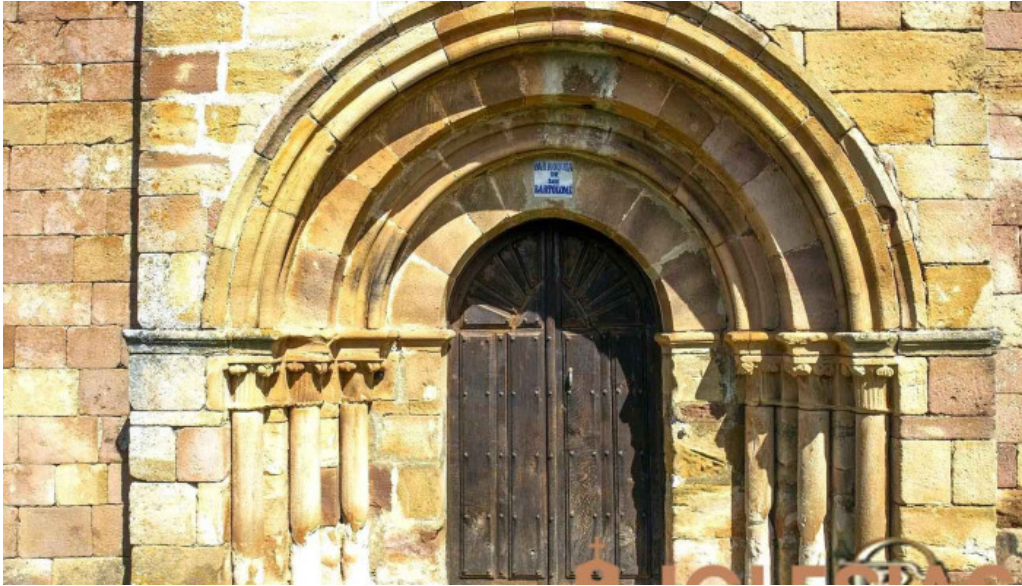
Iglesia de san bartolome iglesia catolica