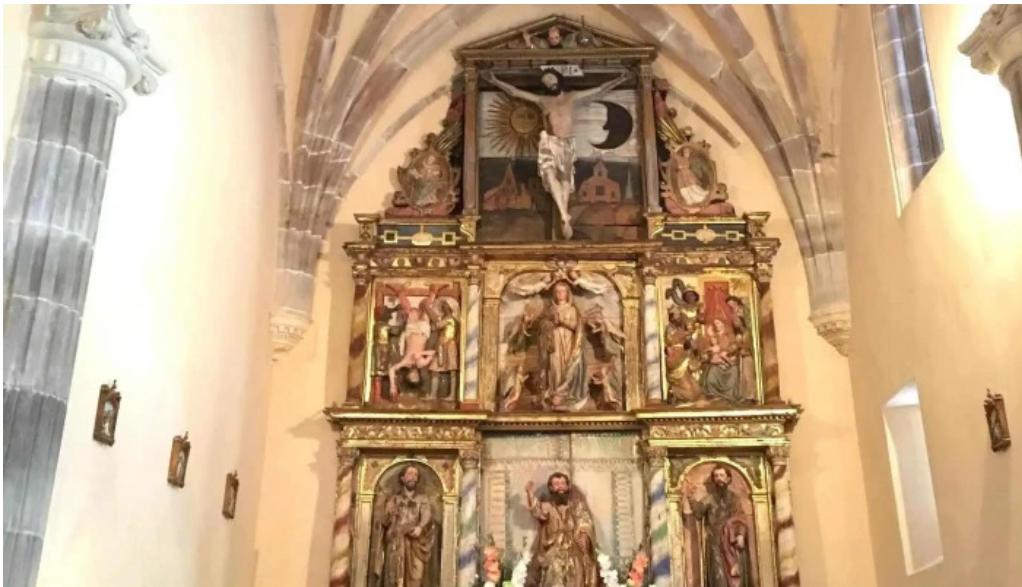
Iglesia de san bartolome cerca de mi