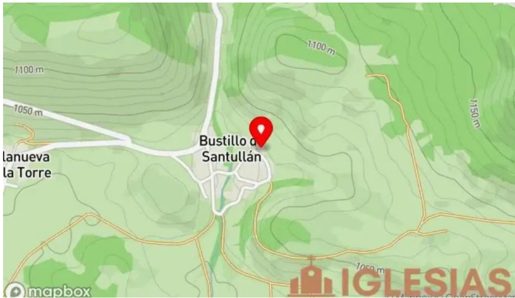
Iglesia de san bartolome mapa