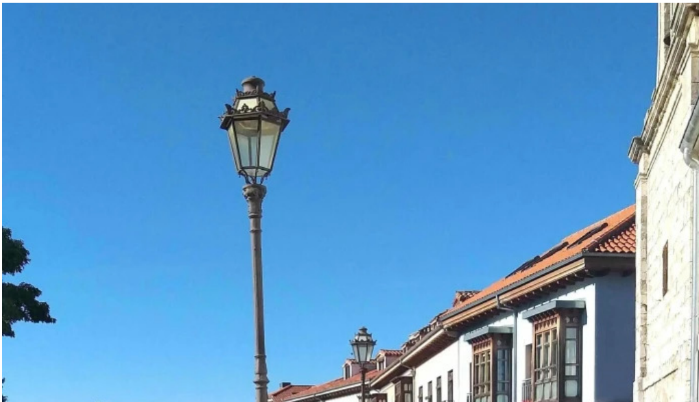
Iglesia de san antonio abad burgos