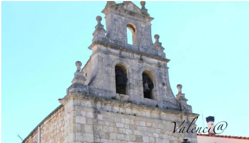
Iglesia de san antonio abad precios