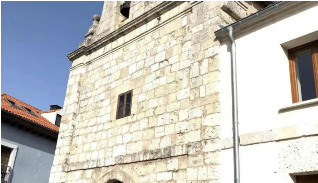
Iglesia de san antonio abad iglesia catolica