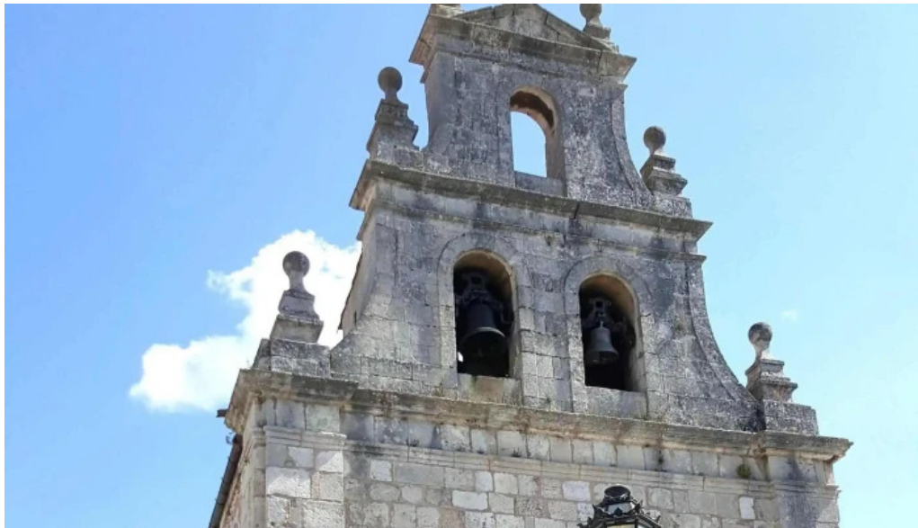
Iglesia de san antonio abad instagram