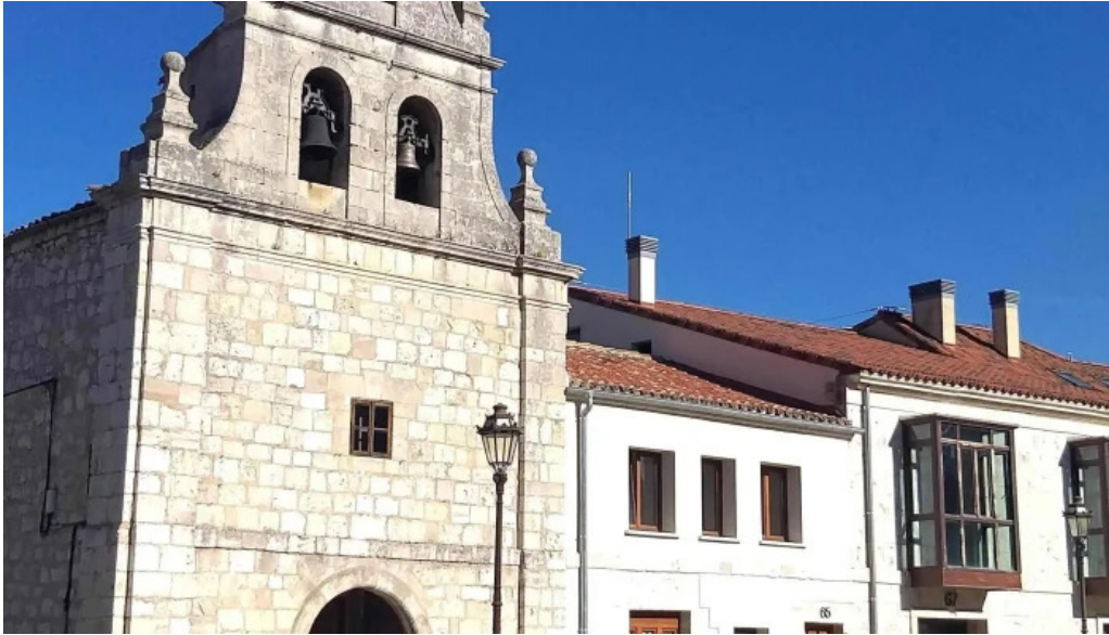
Iglesia de san antonio abad fotos