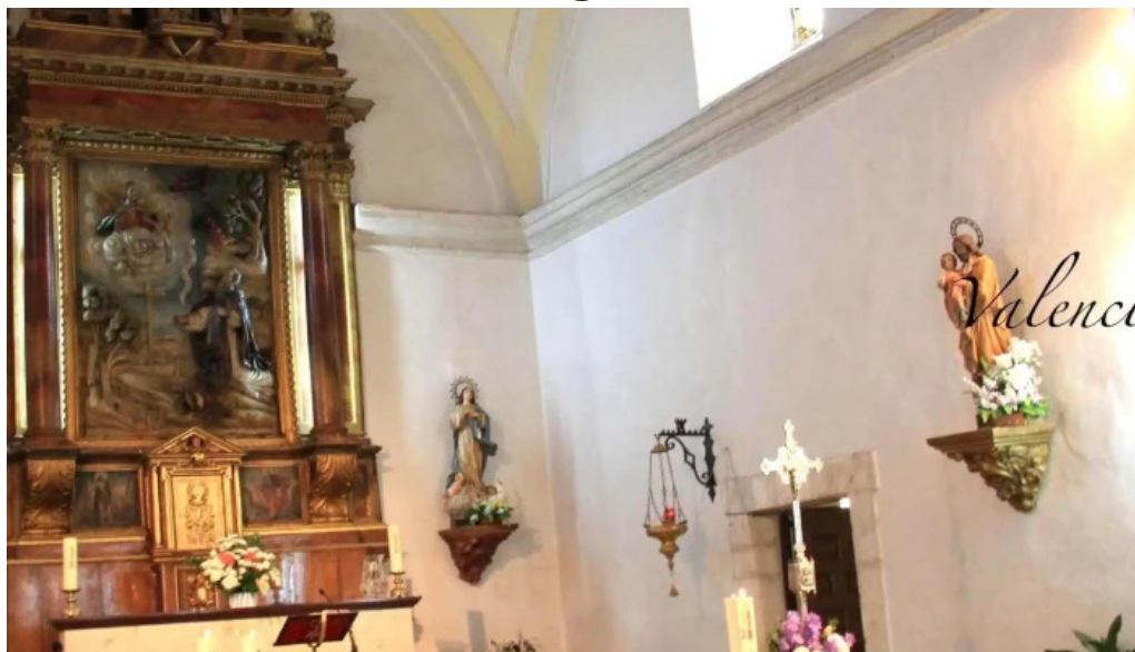
Iglesia de san antonio abad ubicacion