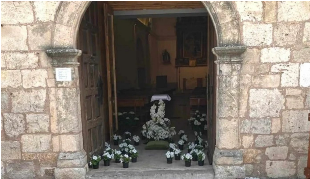
Iglesia de san antonio abad donde