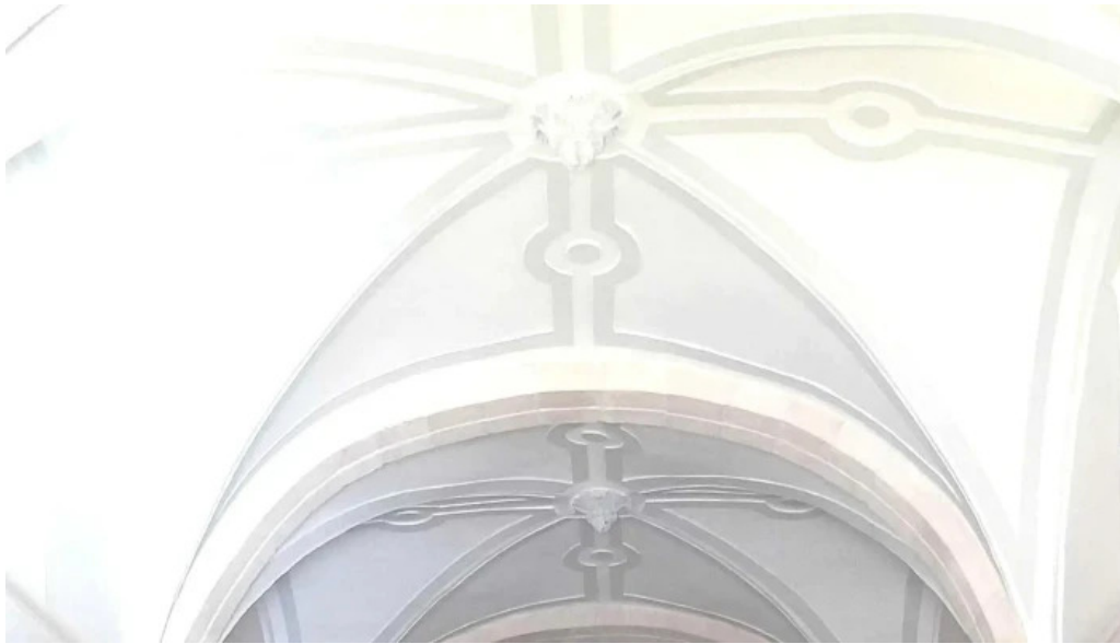
Iglesia de san antonio abad puntaje