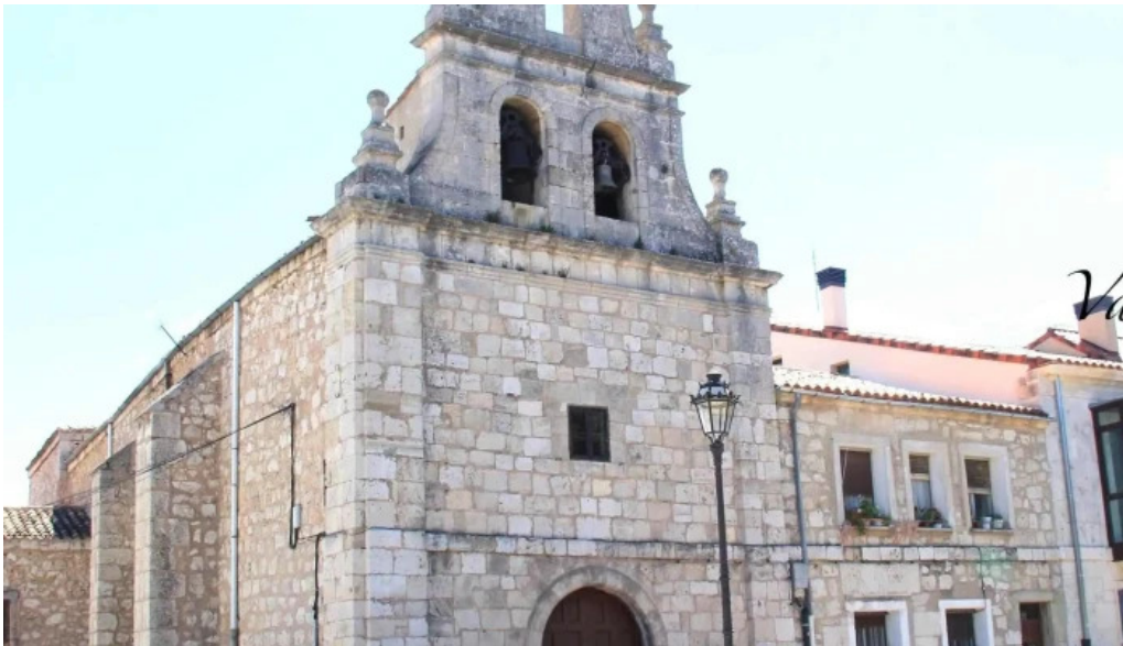
Iglesia de san antonio abad direccion