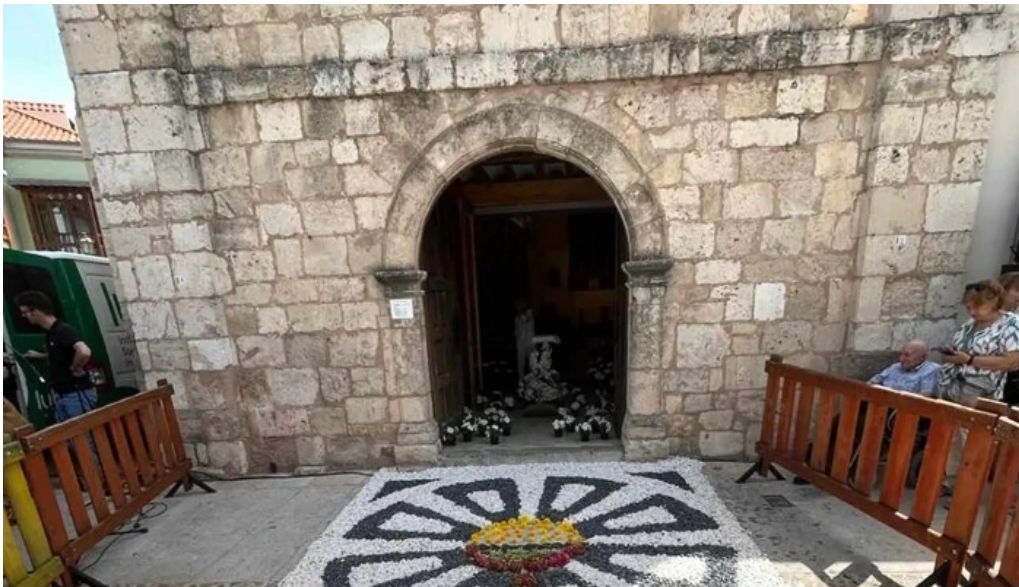
Iglesia de san antonio abad descuentos