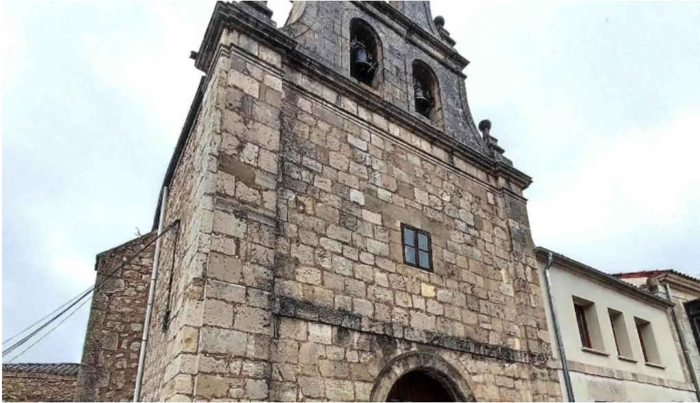
Iglesia de san antonio abad catalogo