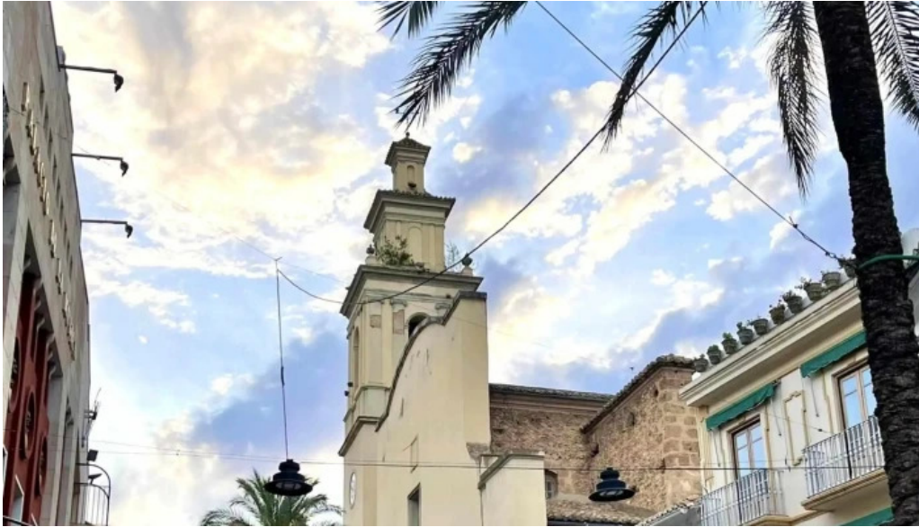
Parroquia san pedro apostol promocion