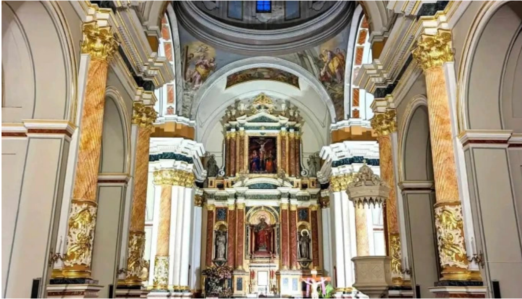
Parroquia san pedro apostol iglesia catolica