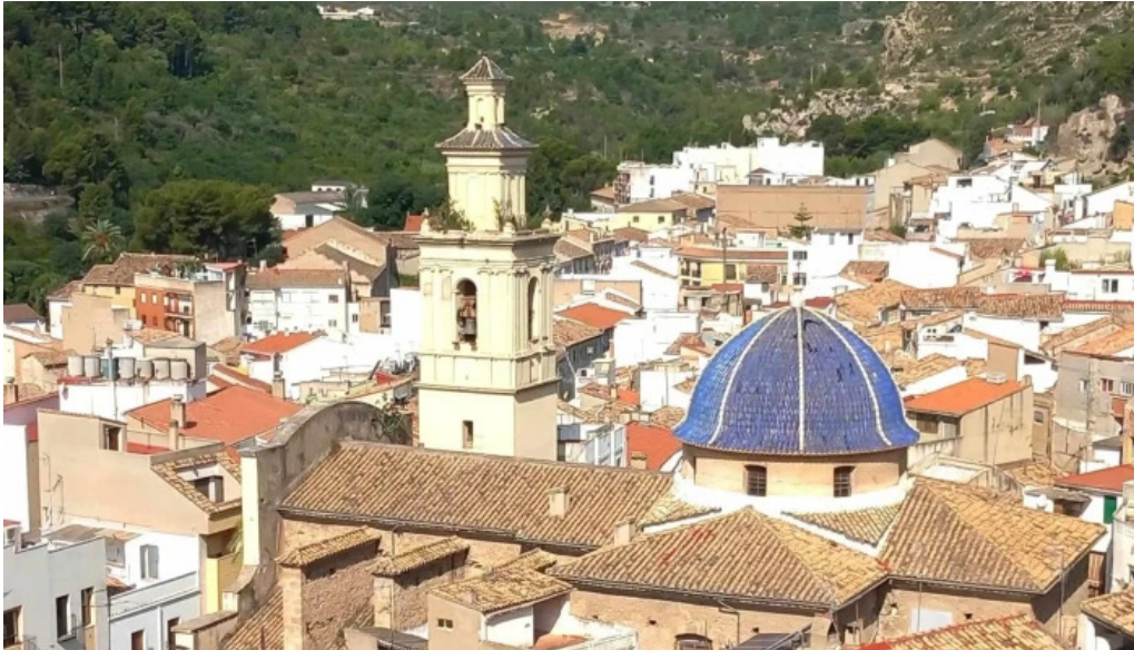
Parroquia san pedro apostol bunol