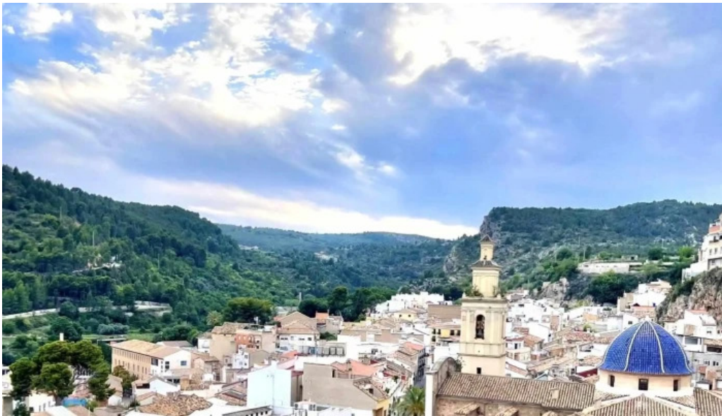
Parroquia san pedro apostol fotos