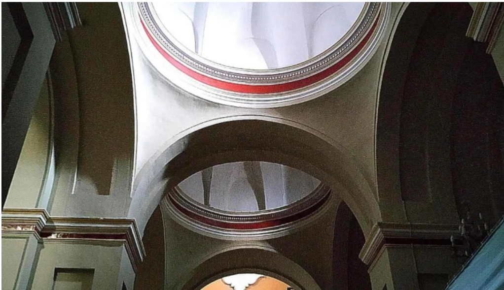
Parroquia san pedro apostol precios