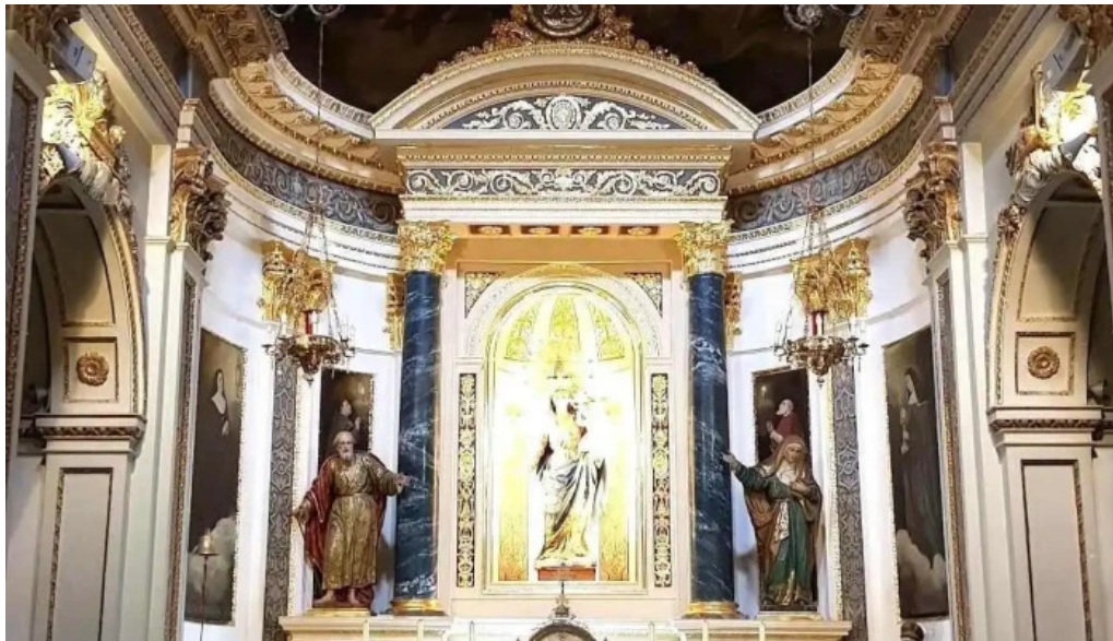
Parroquia san pedro apostol iglesia