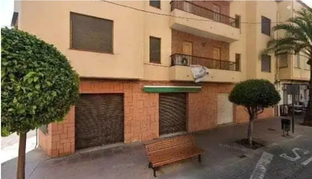
Kirche iglesia catolica