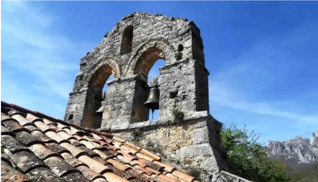
Iglesia de san cipriano brez