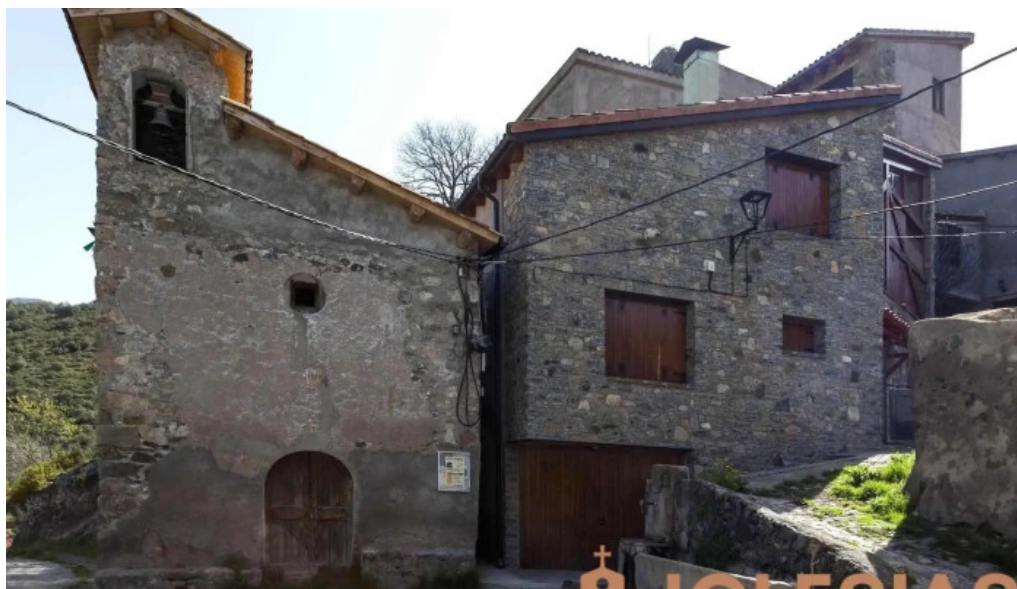
Sant miquel de bresca iglesia catolica