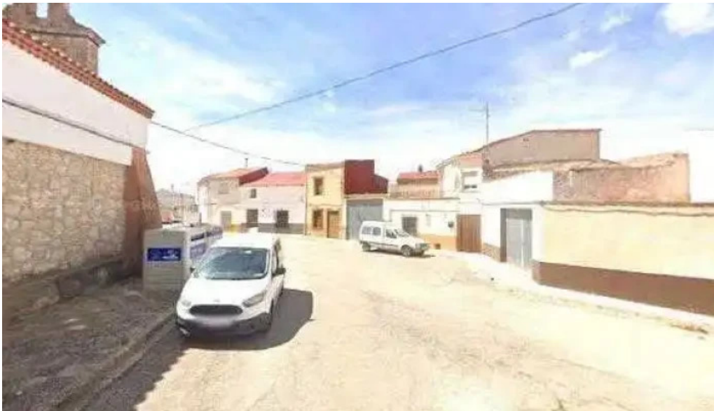
Nuestra senora del rosario fotos