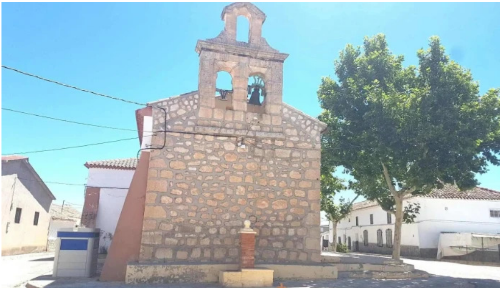
Nuestra senora del rosario iglesia catolica