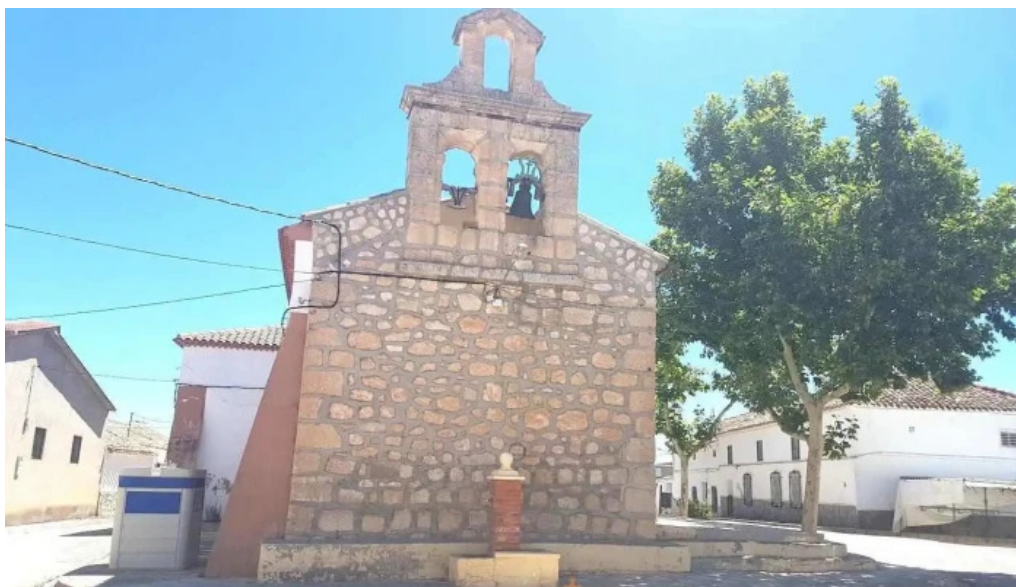
Nuestra señora del rosario bormate