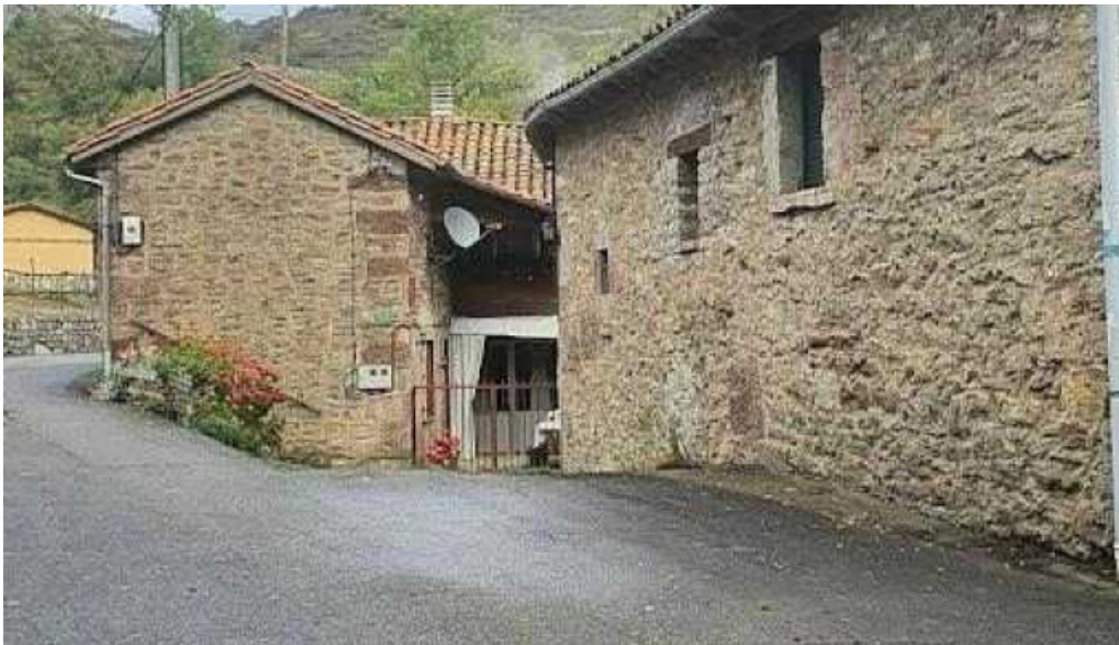
Iglesia de santa eugenia bonar