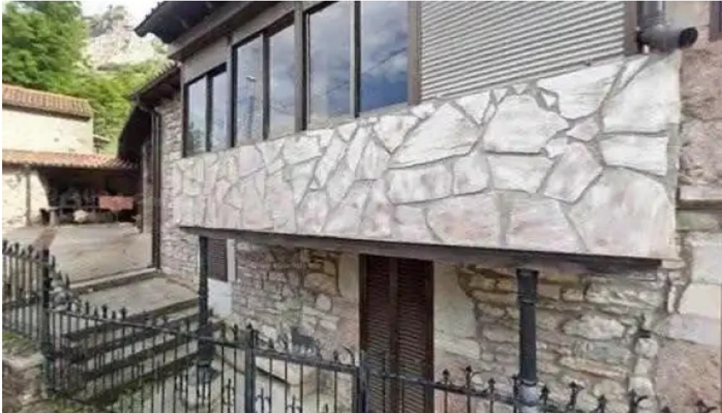
Iglesia de santa eugenia cerca de mi