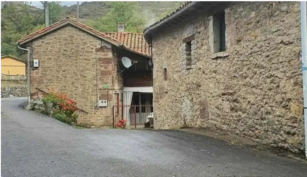
Iglesia de santa eugenia iglesia catolica