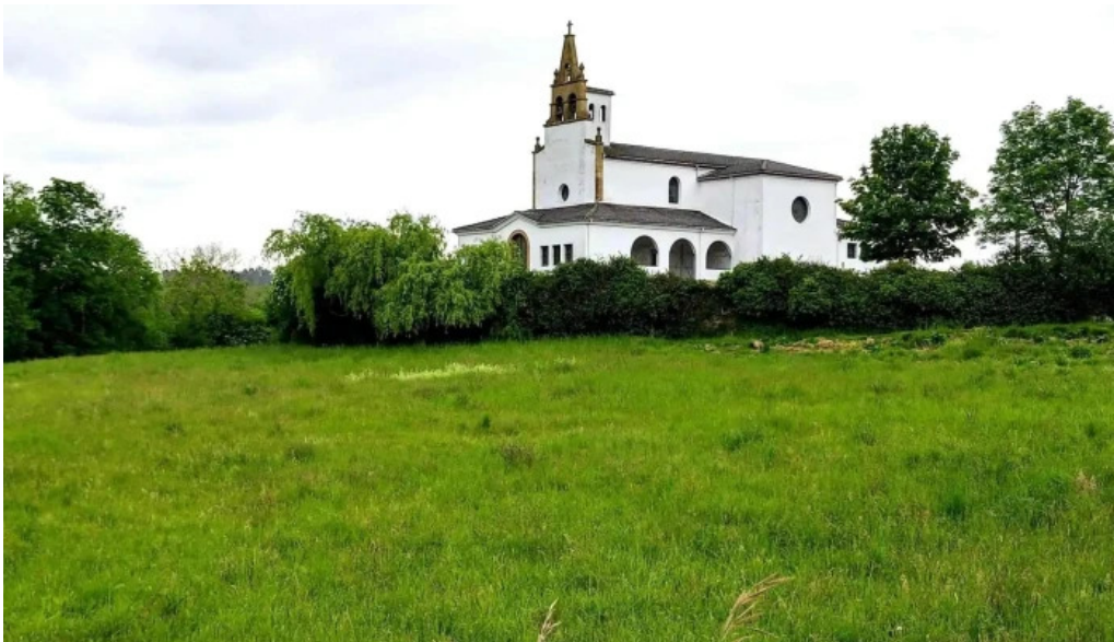
Parroquia de san cosme de bobes horario