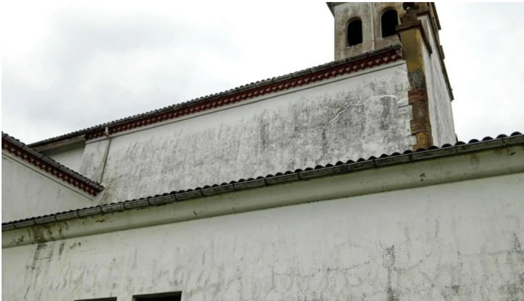
Parroquia de san cosme de bobes instagram