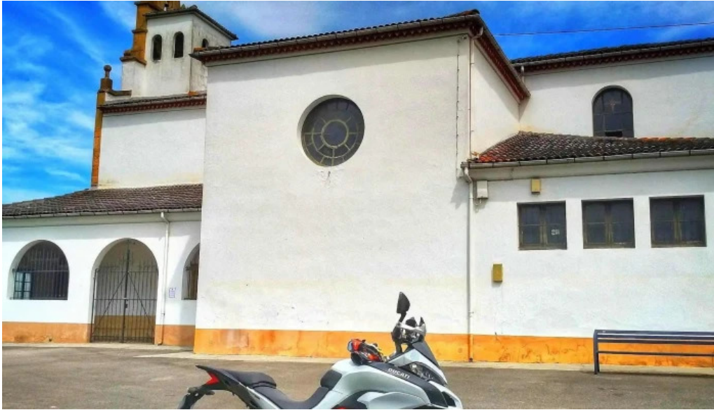
Parroquia de san cosme de bobes direccion