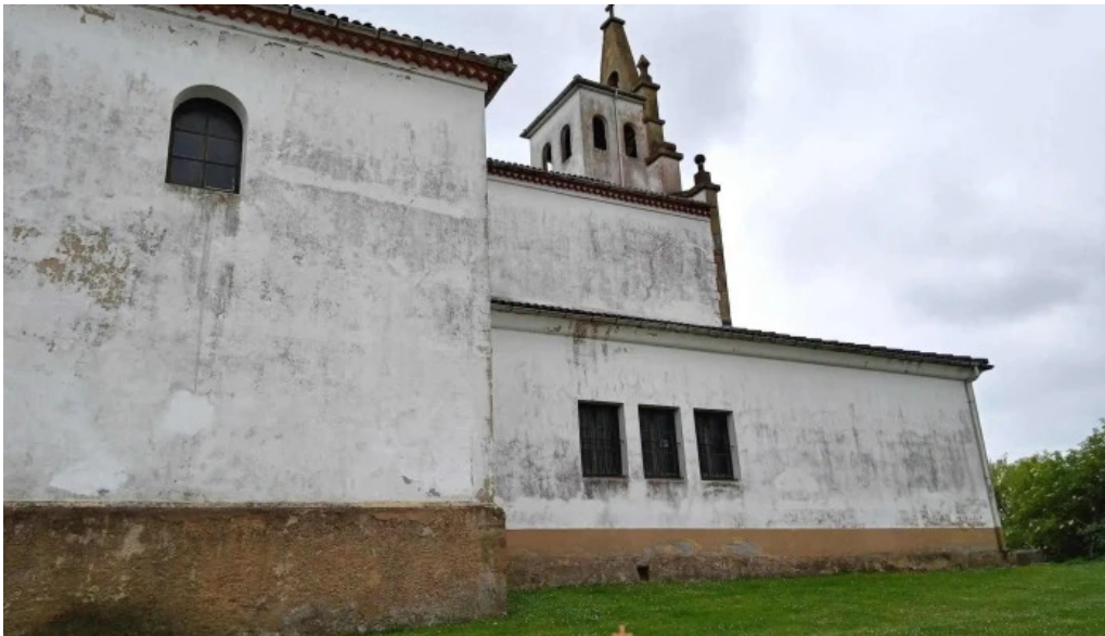
Parroquia de san cosme de bobes iglesia catolica