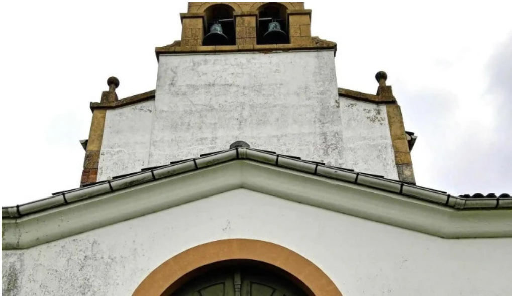
Parroquia de san cosme de bobes descuentos