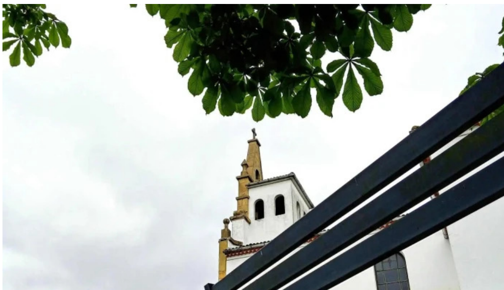
Parroquia de san cosme de bobes bobes