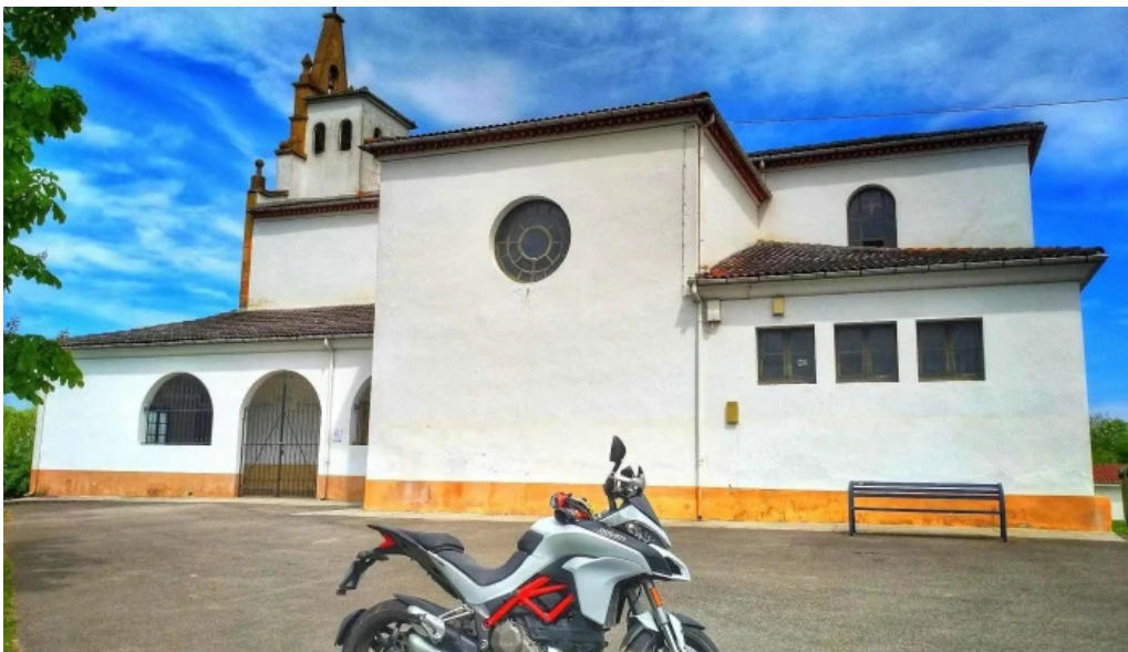
Parroquia de san cosme de bobes iglesia