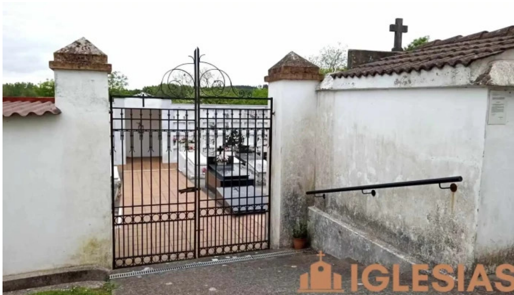
Parroquia de san cosme de bobes videos