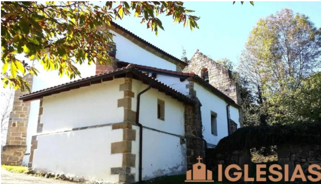
Parroquia de san martin de presa iglesia catolica