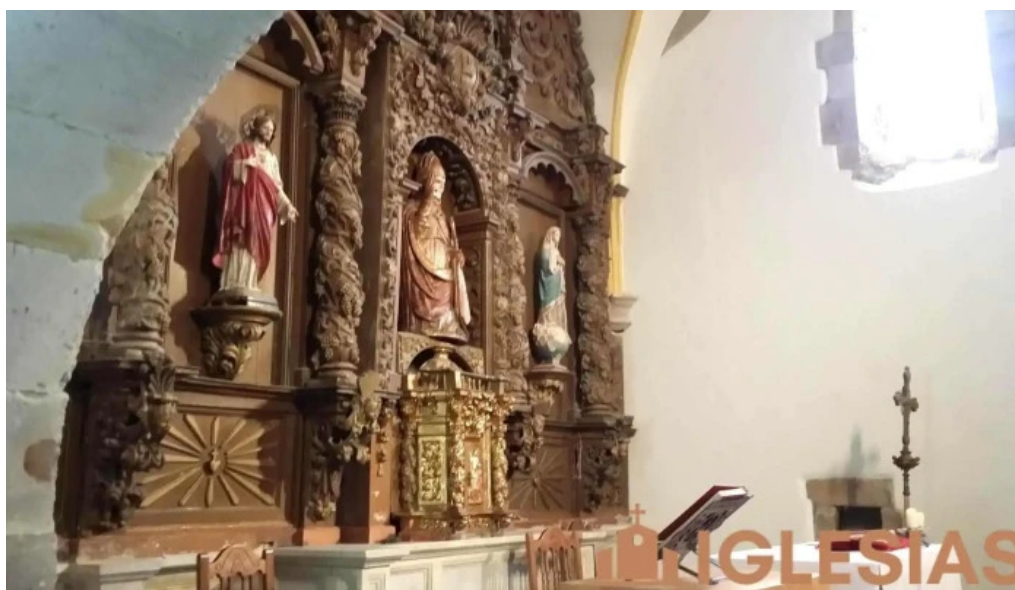
Parroquia de san martin de presa iglesia