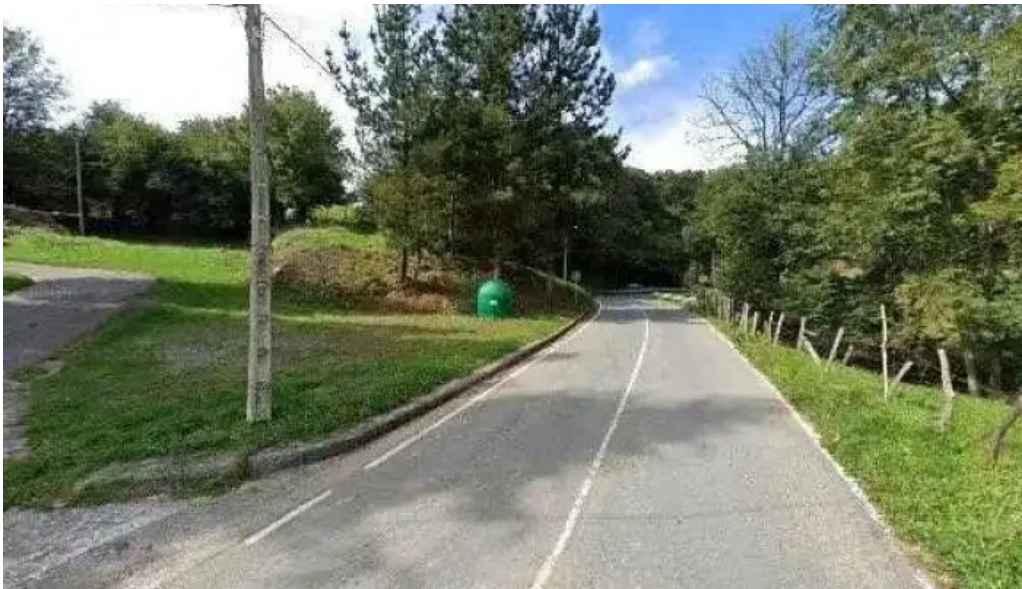
Parroquia de san martin de presa catalogo