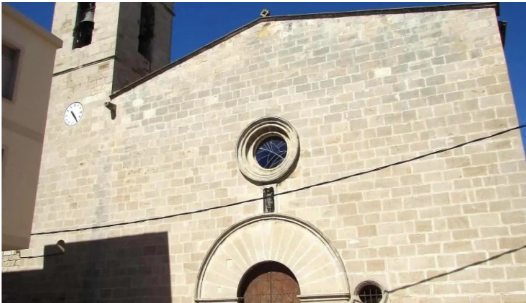
Esglesia de sant jaume iglesia catolica