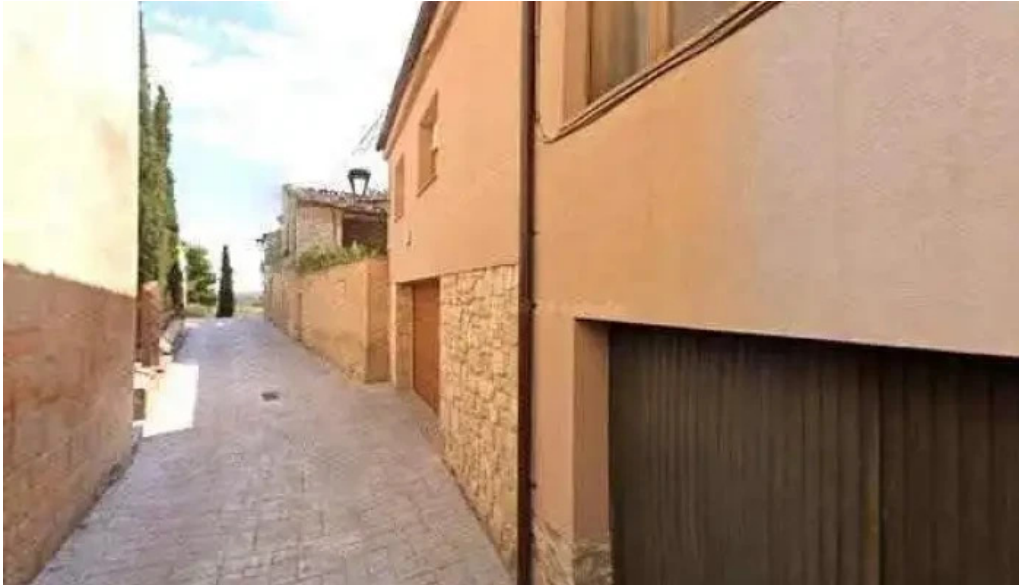
Esglesia de sant jaume opiniones