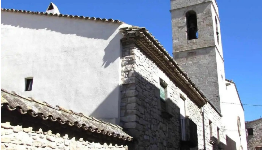
Esglesia de sant jaume iglesia