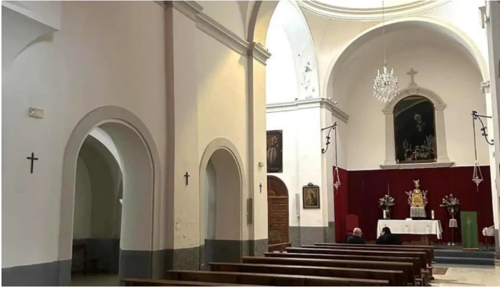
Iglesia de los dolores iglesia