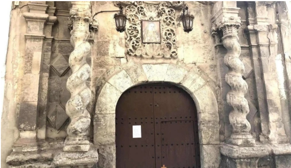
Iglesia de los dolores iglesia catolica