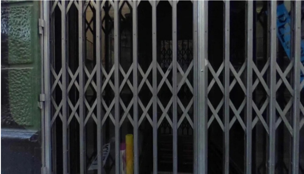
Iglesia de los dolores fotos