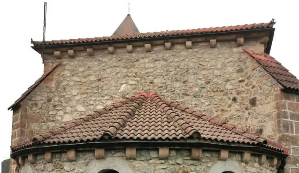
Iglesia de barniedo abierto ahora