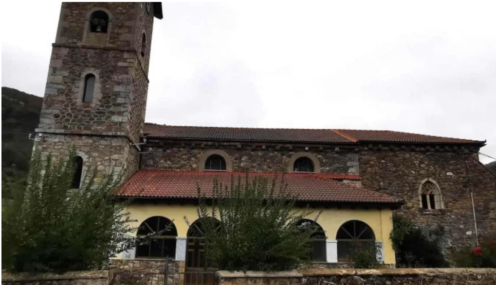
Iglesia de barniedo barniedo de la reina