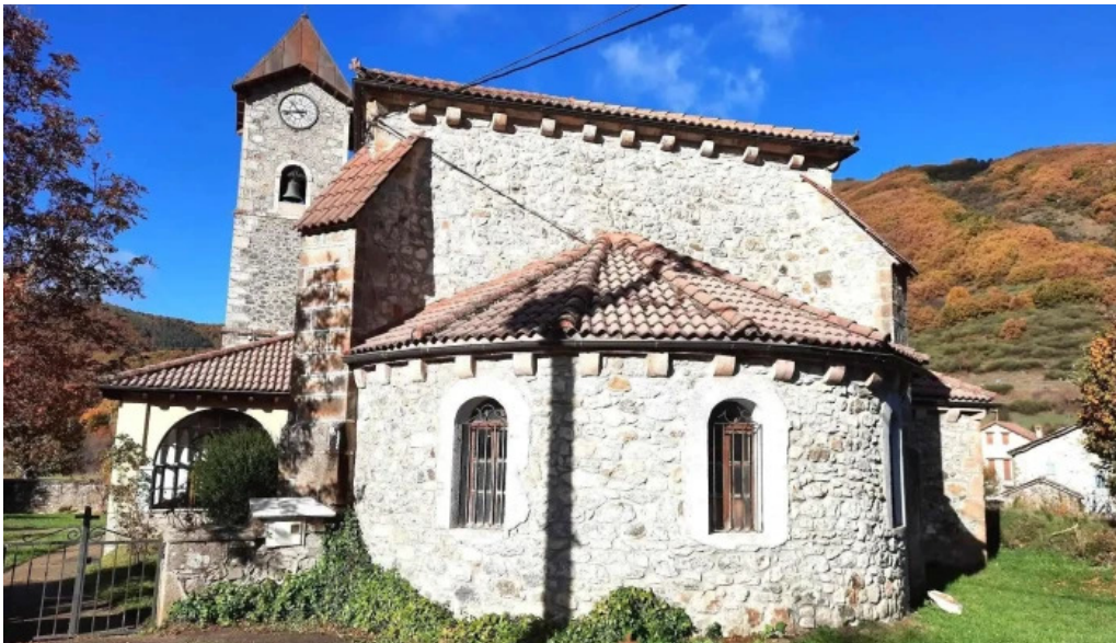
Iglesia de barniedo iglesia catolica