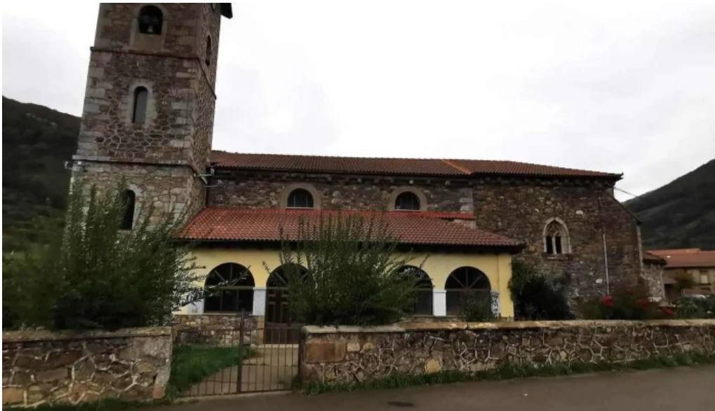
Iglesia de barniedo catalogo