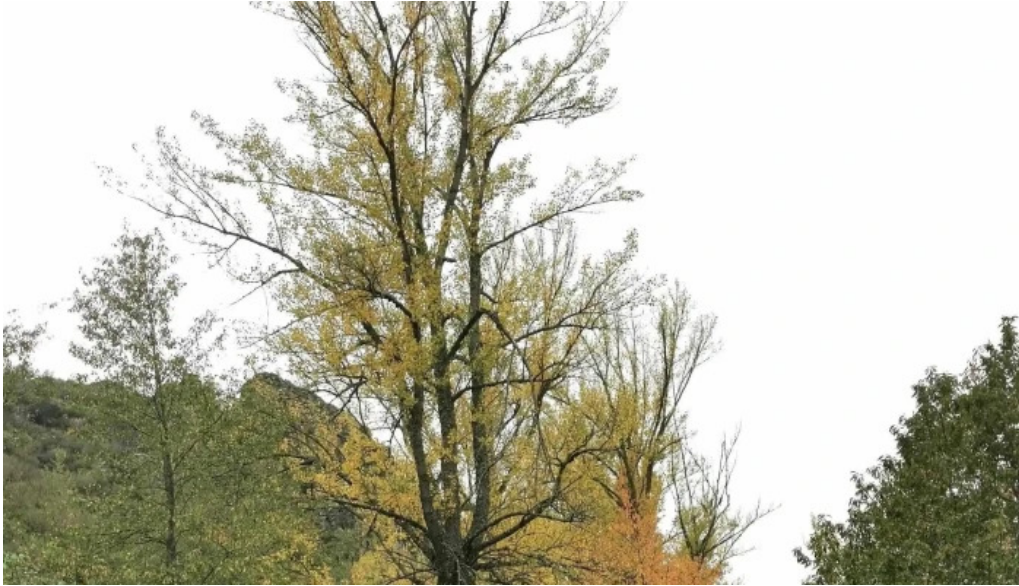
Iglesia de barniedo numero