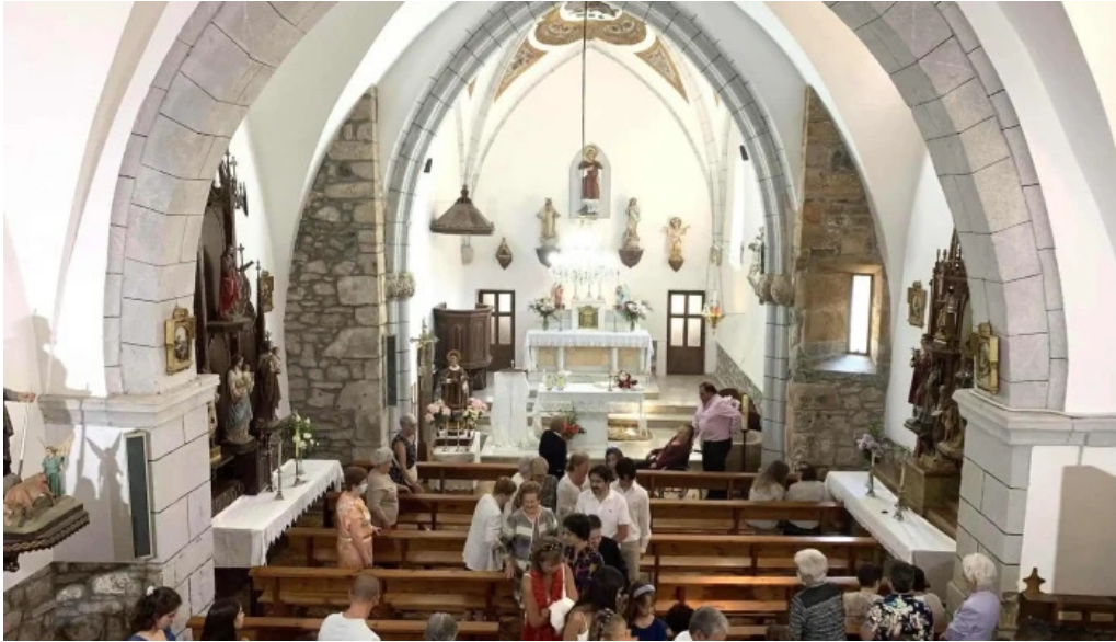
Iglesia de barniedo iglesia