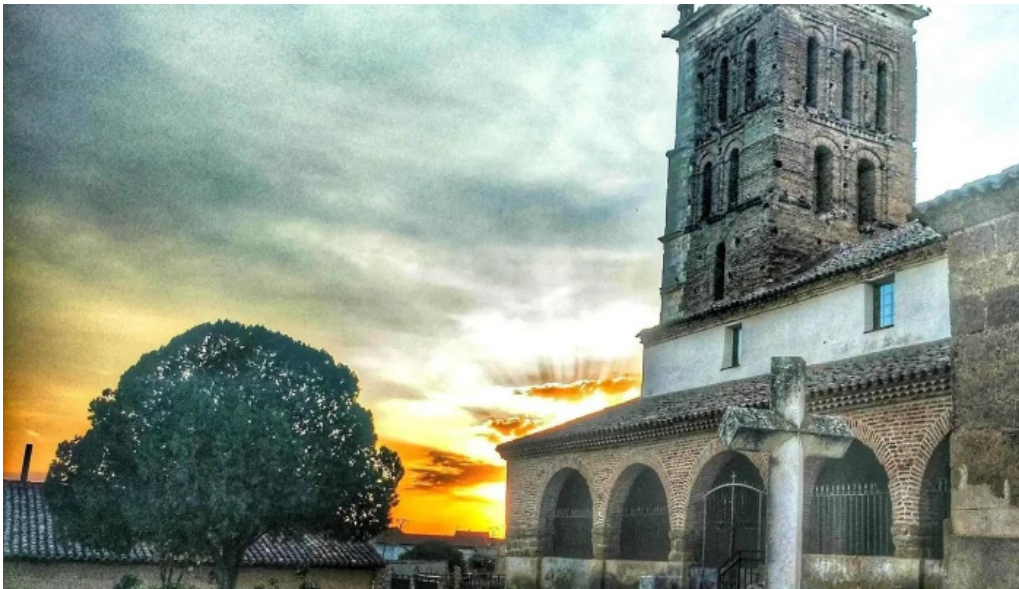
Iglesia de san pelayo catalogo