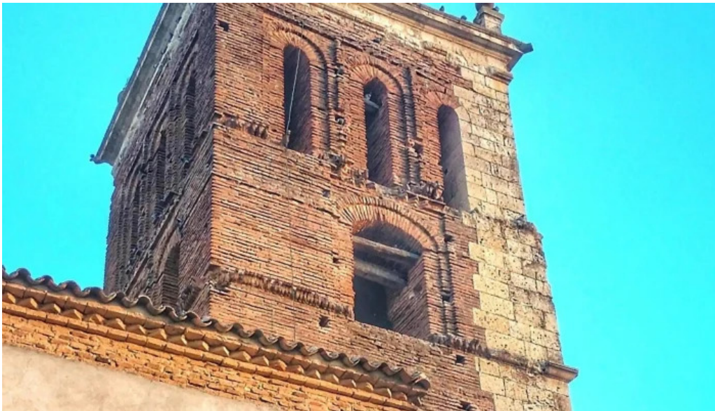
Iglesia de san pelayo fotos