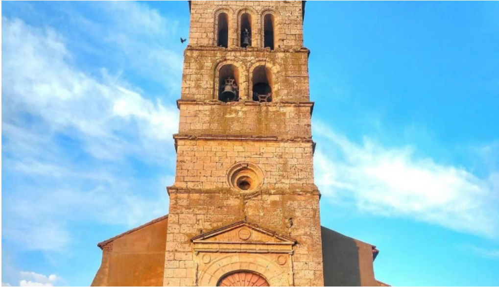
Iglesia de san pelayo descuentos