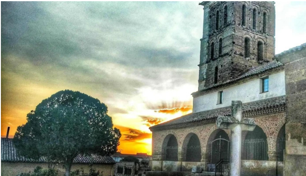
Iglesia de san pelayo iglesia