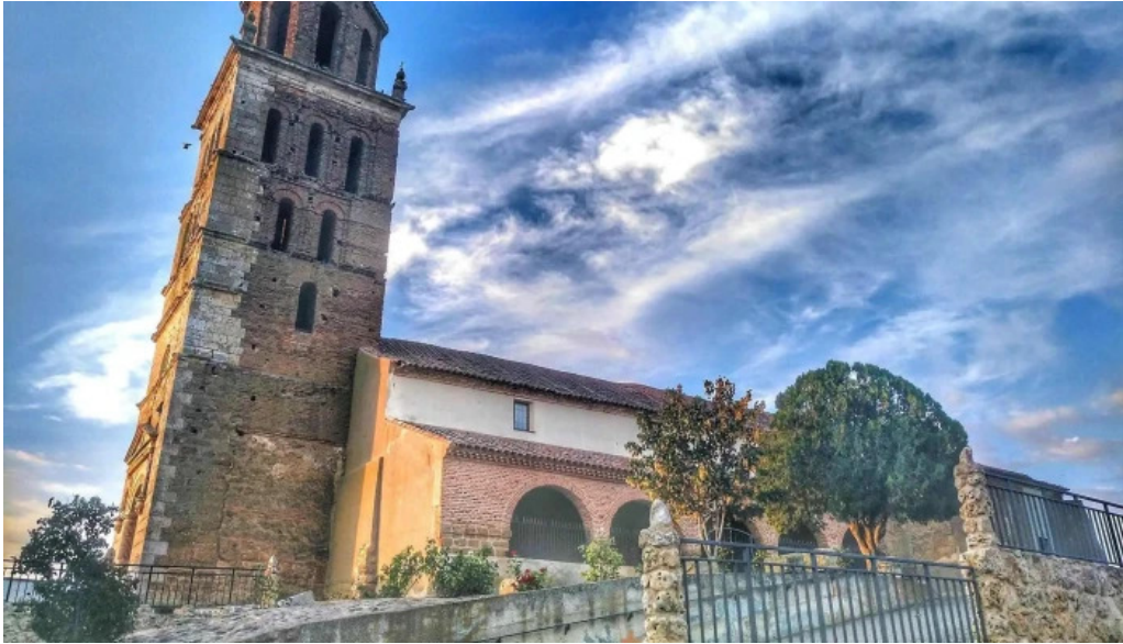
Iglesia de san pelayo iglesia catolica