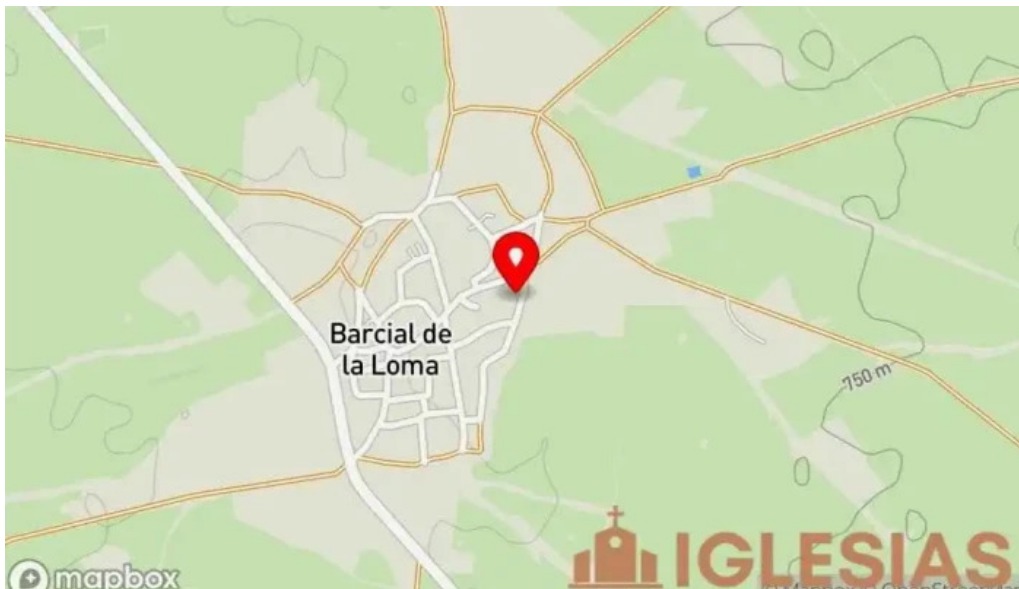
Iglesia de san pelayo mapa