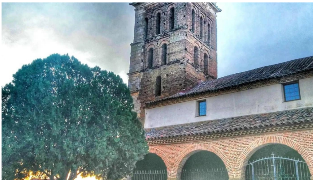
Iglesia de san pelayo barcial de la loma