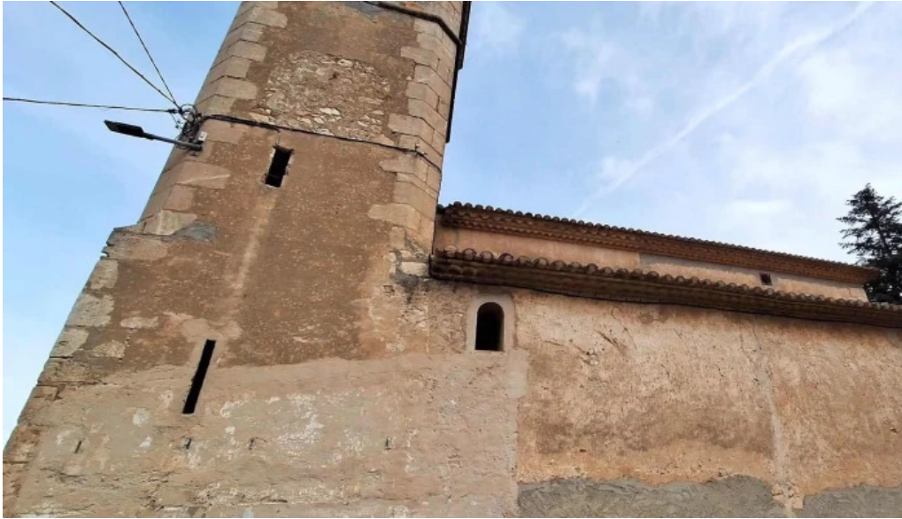
Iglesia de sant pere de molanta telefono