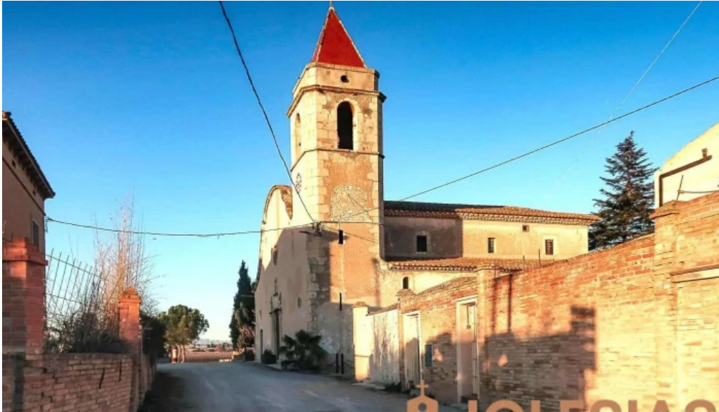
Iglesia de sant pere de molanta iglesia catolica