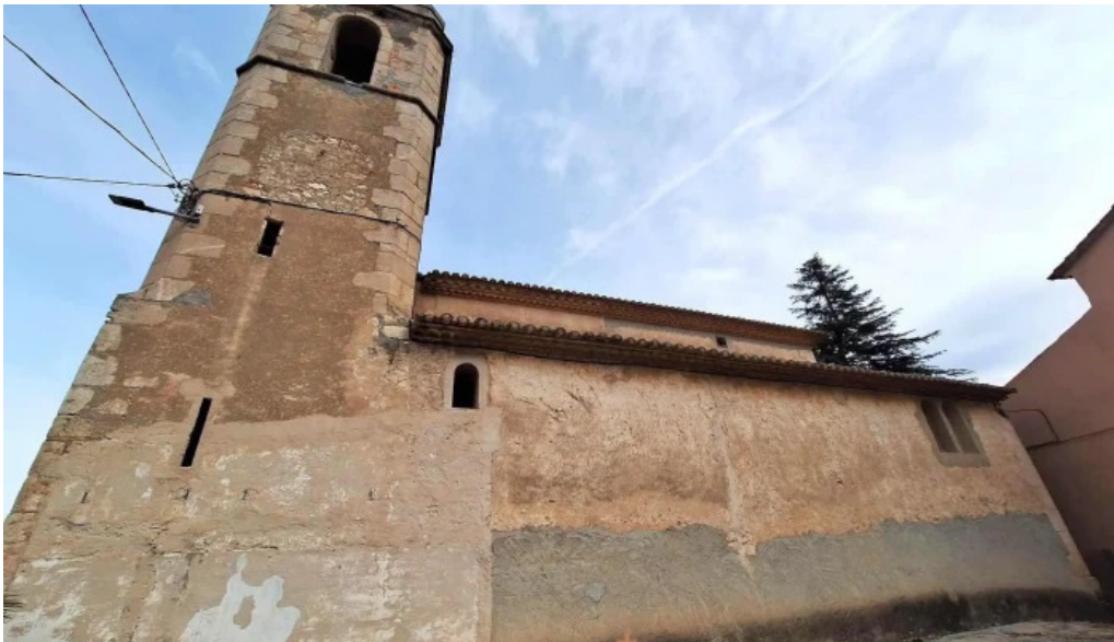
Iglesia de sant pere de molanta recientes