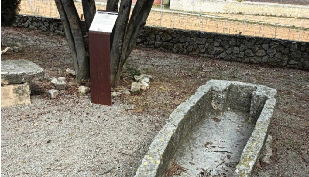
Iglesia de sant pere de molanta abierto ahora