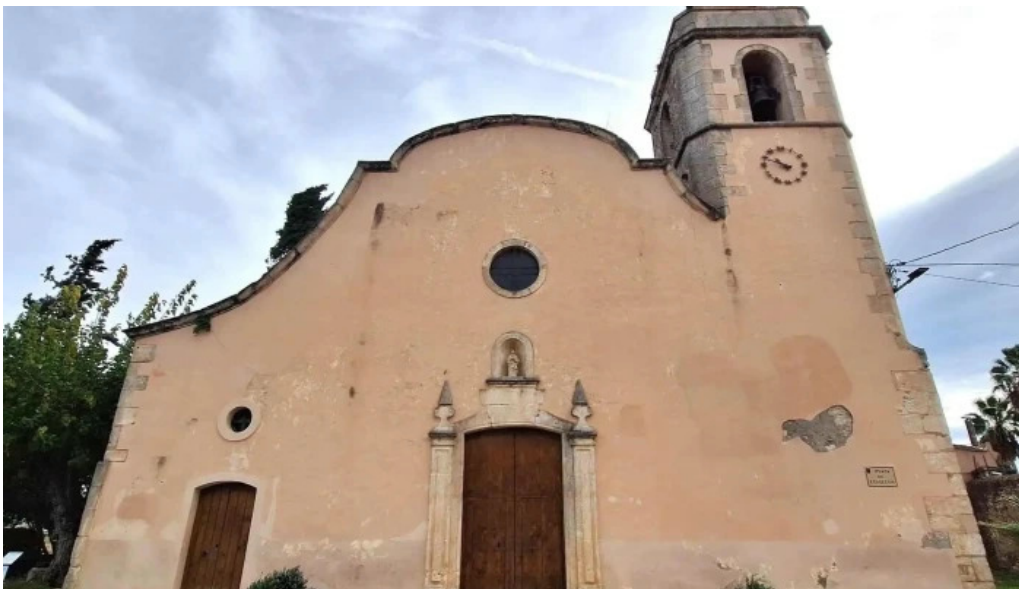
Iglesia de sant pere de molanta barcelona