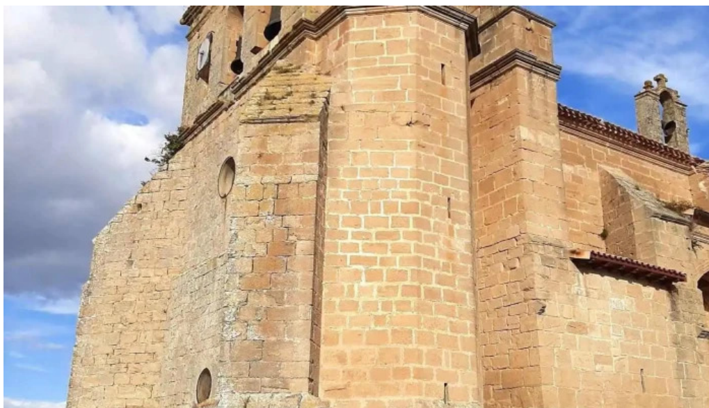
Iglesia de san juan evangelista iglesia catolica