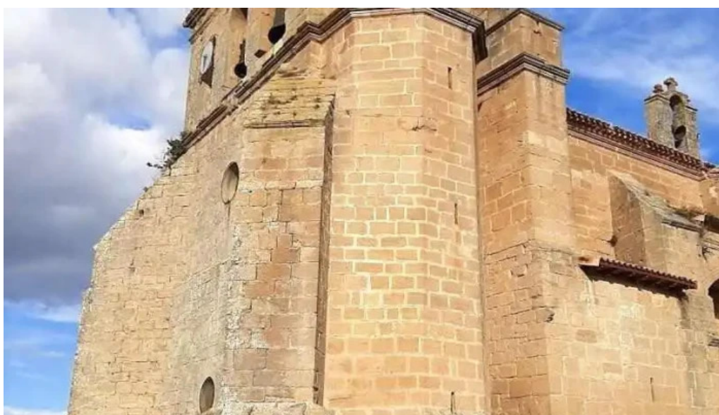
Iglesia de san juan evangelista barbarin