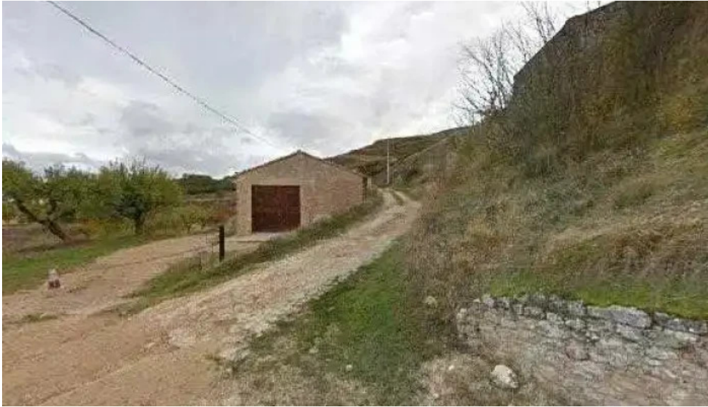
Iglesia de san juan evangelista numero