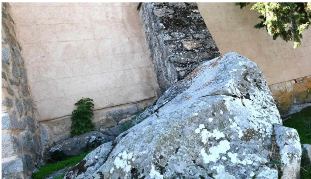
Iglesia de san martin abierto ahora