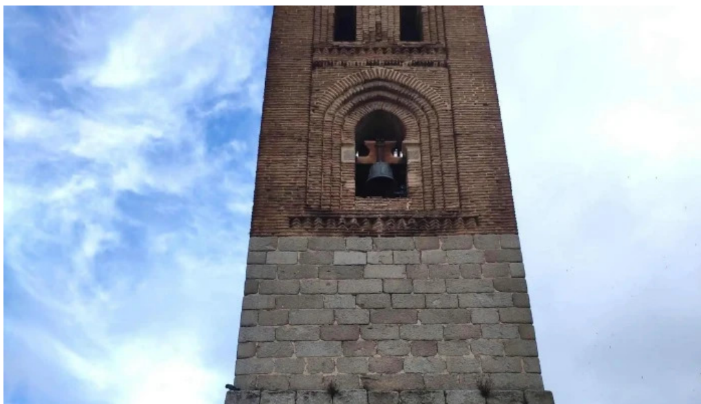
Iglesia de san martin avila