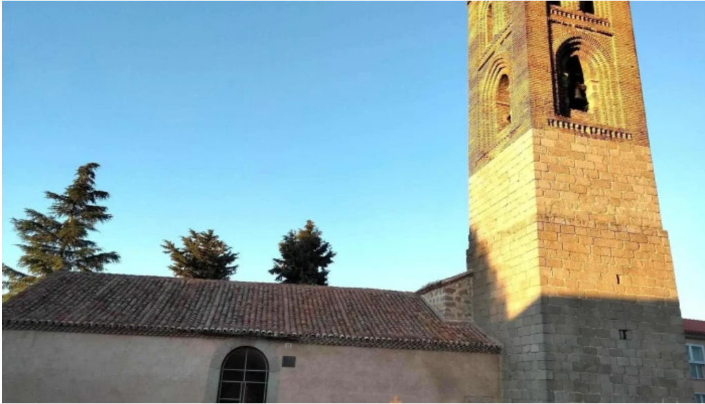
Iglesia de san martin iglesia