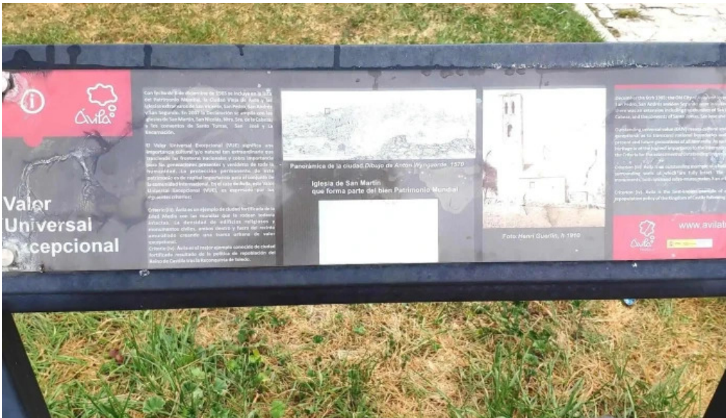
Iglesia de san martin como llegar