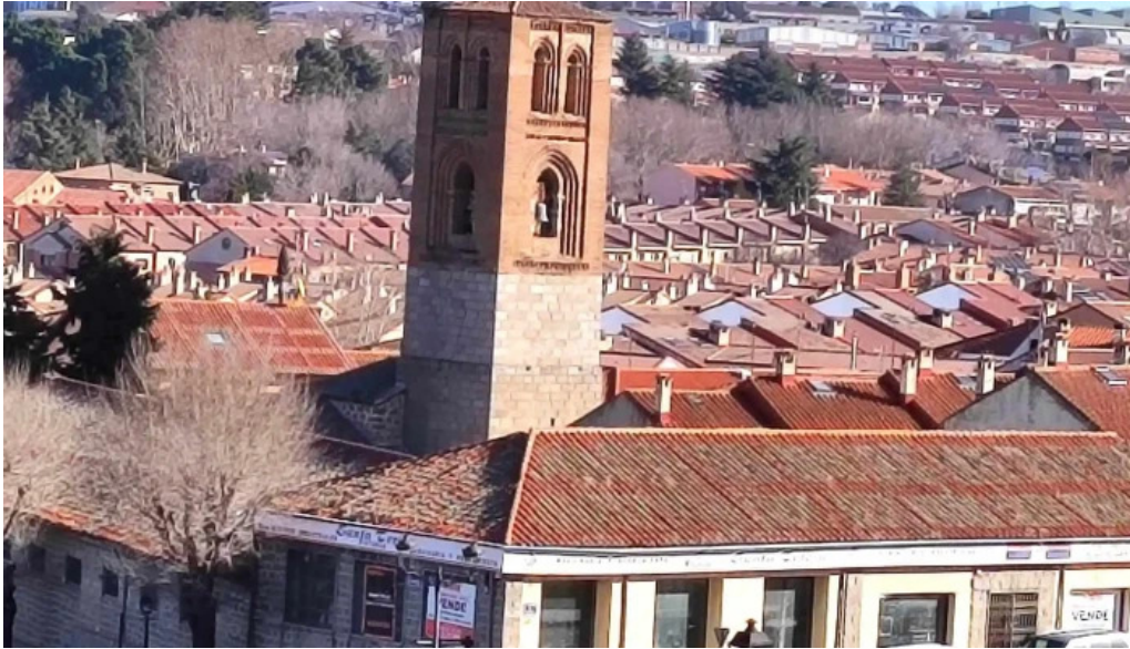
Iglesia de san martin puntaje