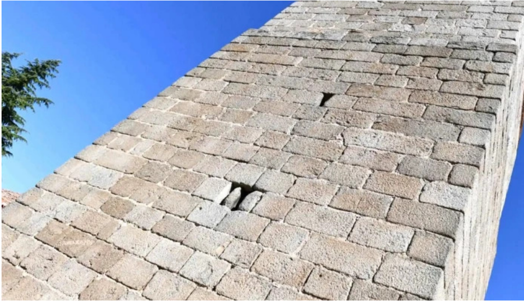
Iglesia de san martin horario