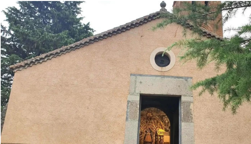
Iglesia de san martin ubicacion