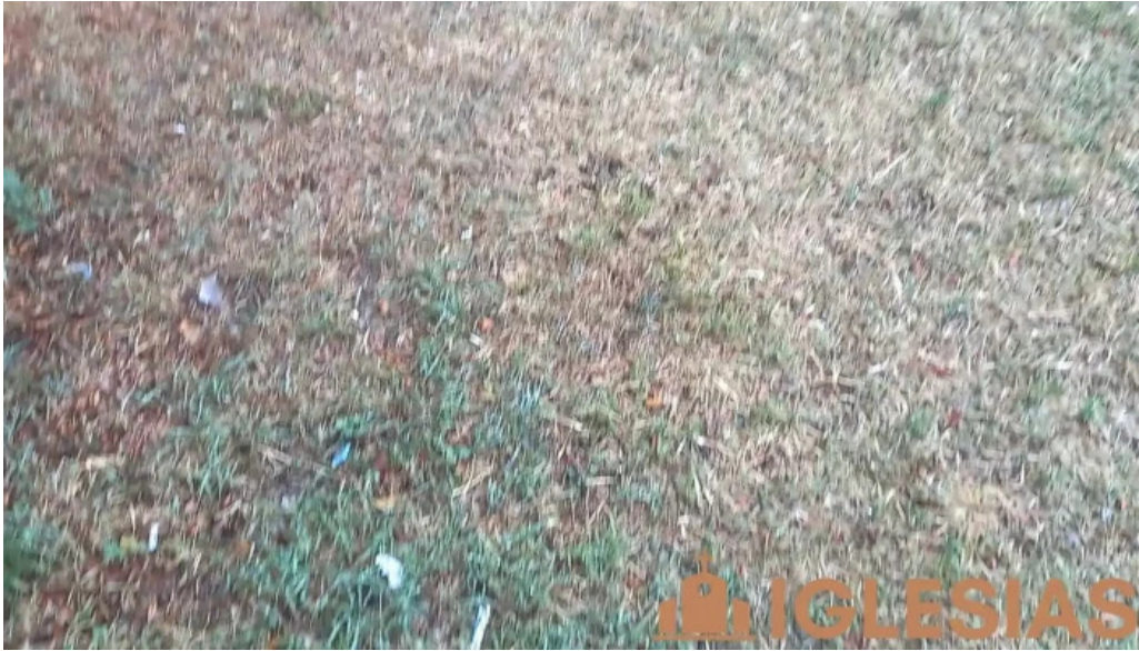
Iglesia de san martin videos