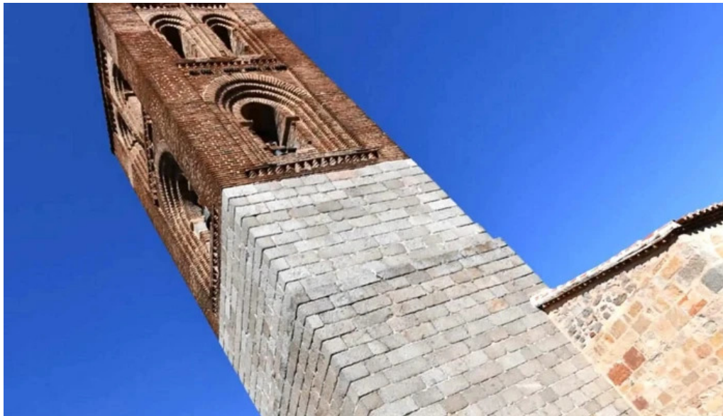
Iglesia de san martin cerca de mi