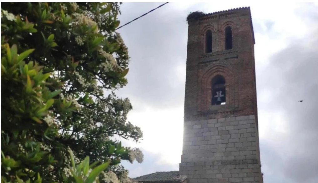
Iglesia de san martin zona