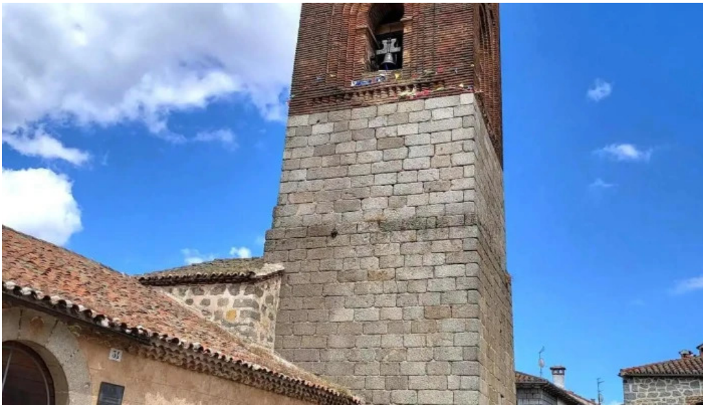
Iglesia de san martin iglesia catolica