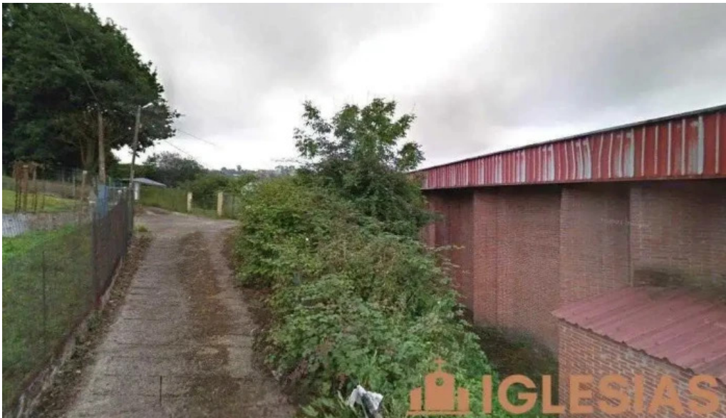
Iglesia de santa marta asturias