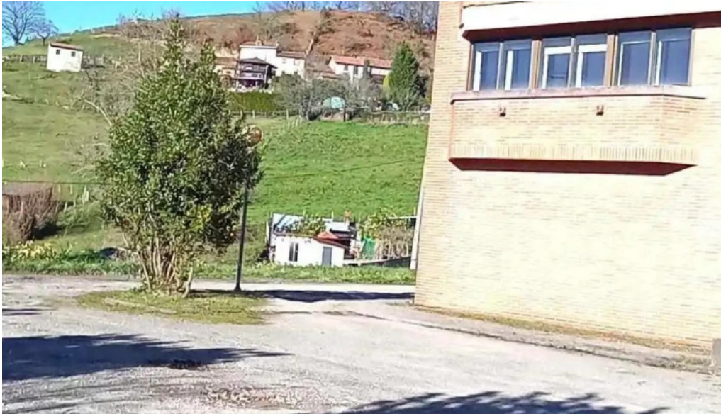
Iglesia de santa marta videos