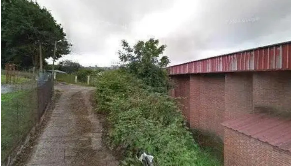
Iglesia de santa marta iglesia catolica