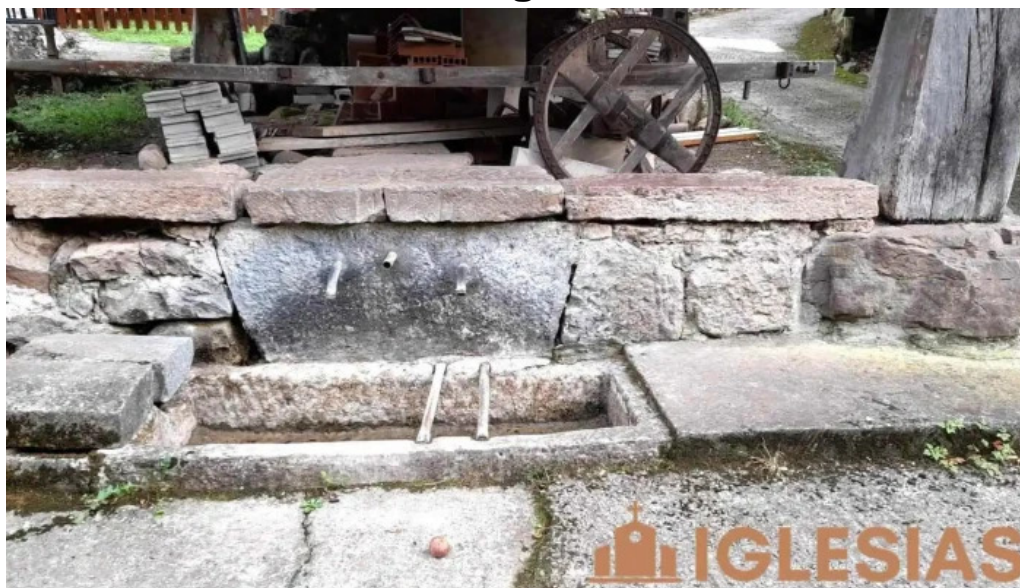
Iglesia de santa maria de almurfe recientes