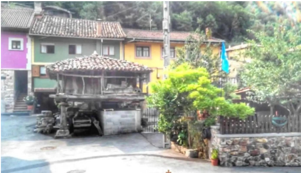
Iglesia de santa maria de almurfe asturias