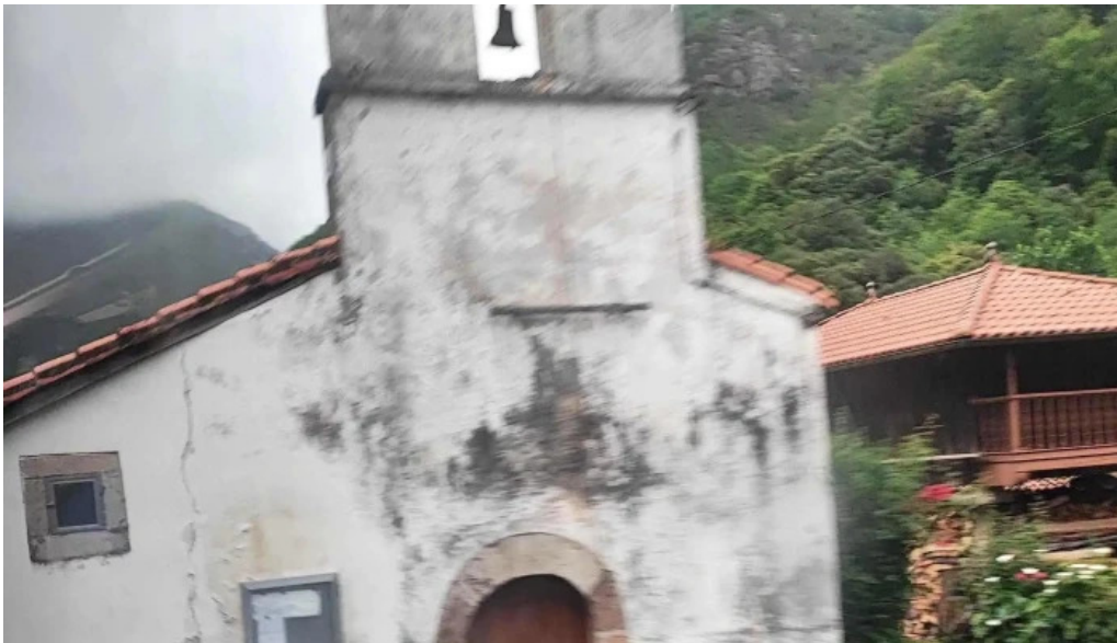
Iglesia de santa maria de almurfe iglesia