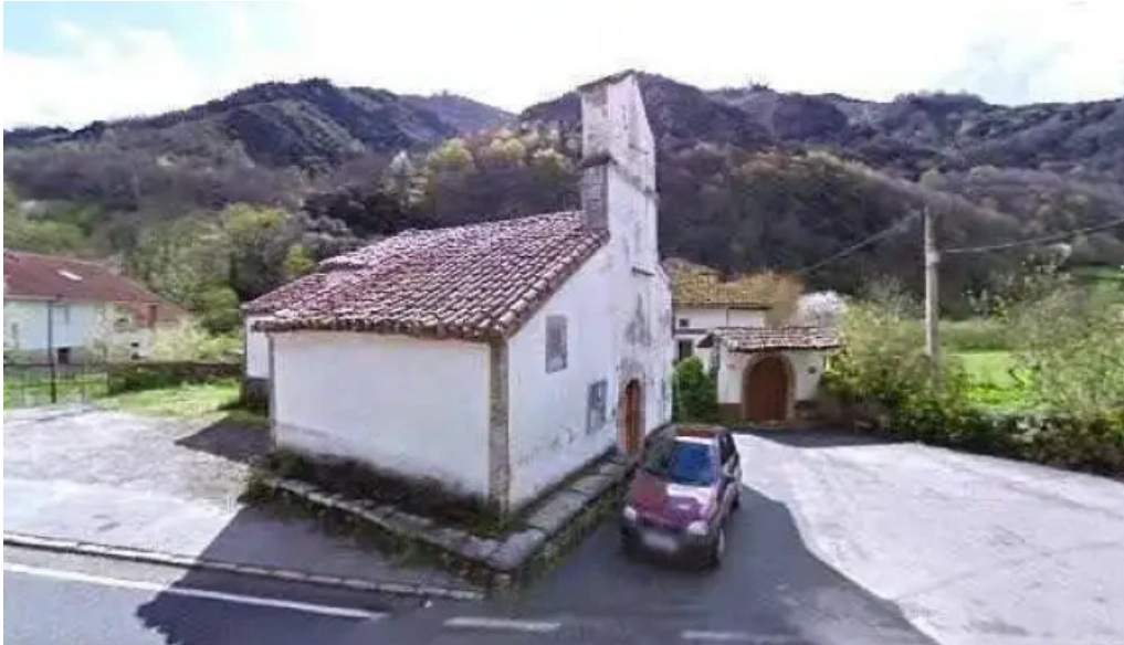
Iglesia de santa maria de almurfe almurfe