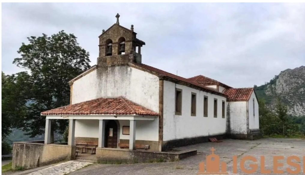
Iglesia de santa maria asturias