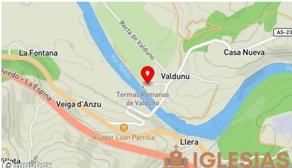
Iglesia de santa eulalia de valdunu mapa