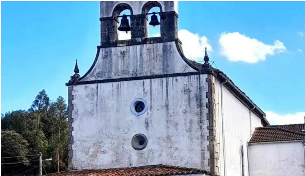
Iglesia de santa eulalia de valdunu iglesia catolica