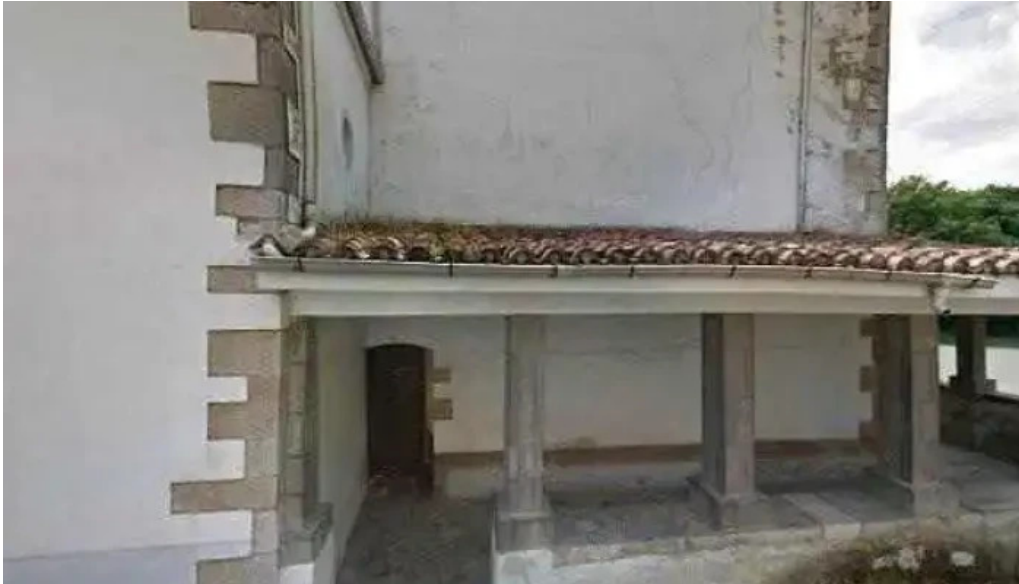
Iglesia de santa eulalia de valdunu numero