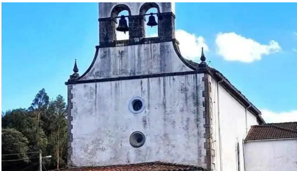
Iglesia de santa eulalia de valdunu asturias