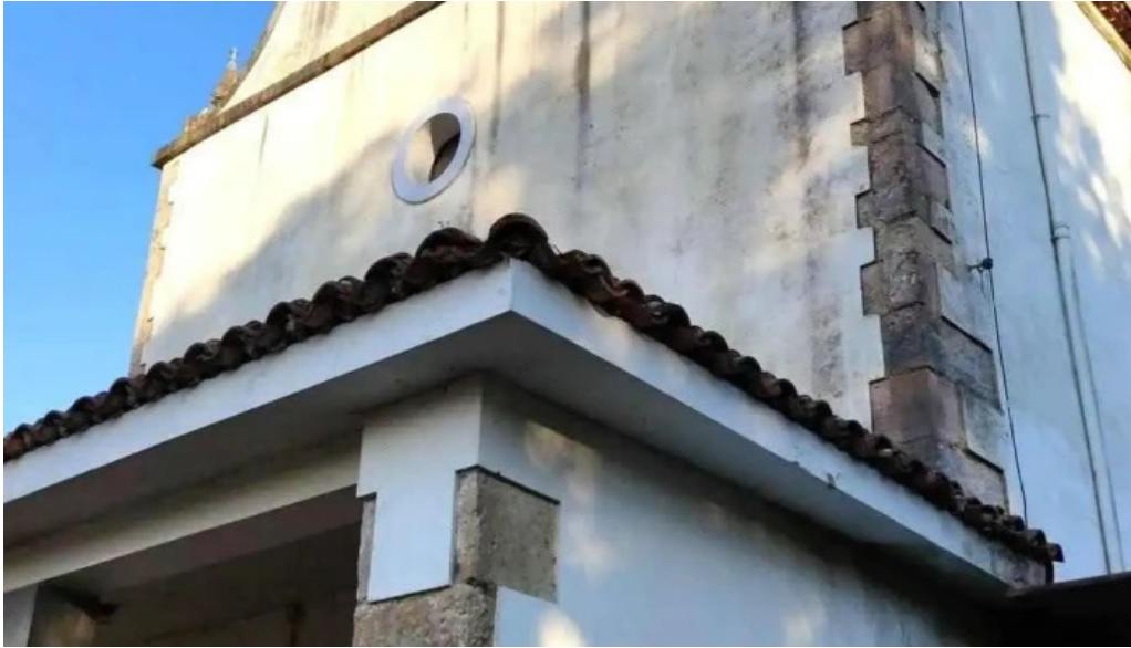
Iglesia de santa eulalia de valdunu iglesia