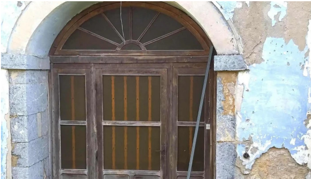
Iglesia de santa eulalia de la mata fotos