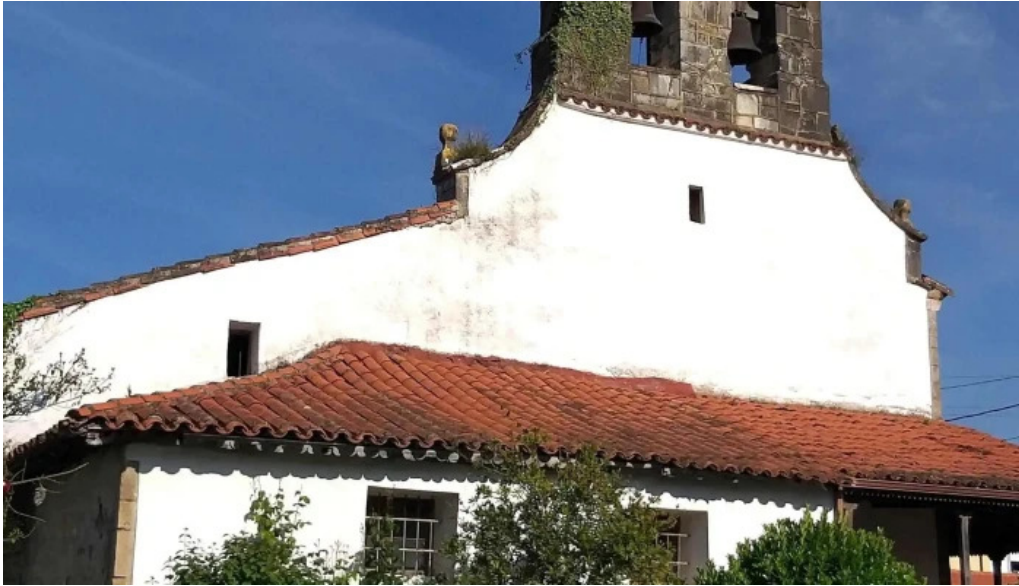
Iglesia de santa eulalia de la mata horario