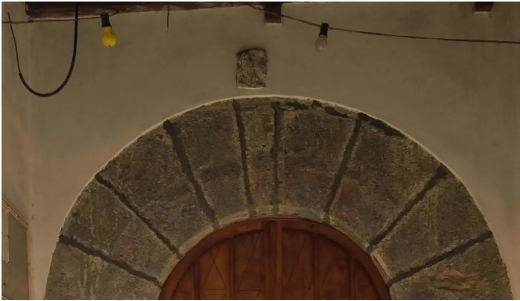
Iglesia de santa eulalia de la mata telefono