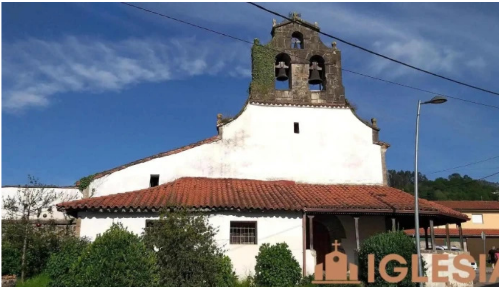
Iglesia de santa eulalia de la mata iglesia catolica