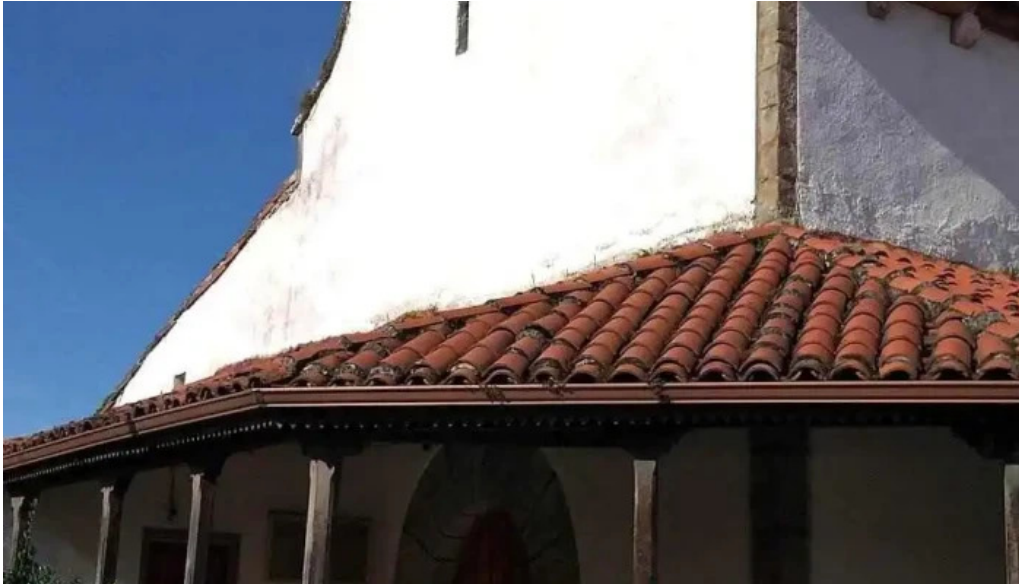
Iglesia de santa eulalia de la mata iglesia