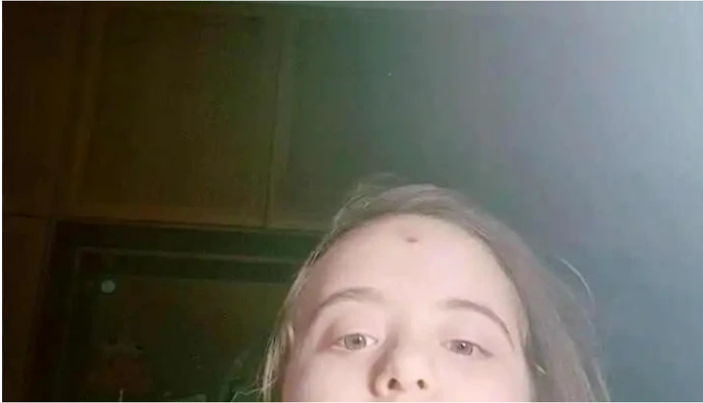
Iglesia de san romano videos