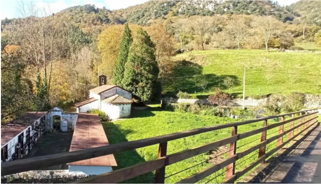
Iglesia de san romano fotos