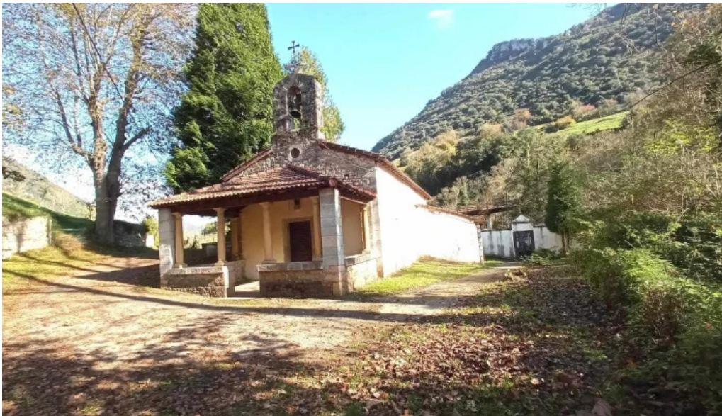
Iglesia de san romano iglesia catolica