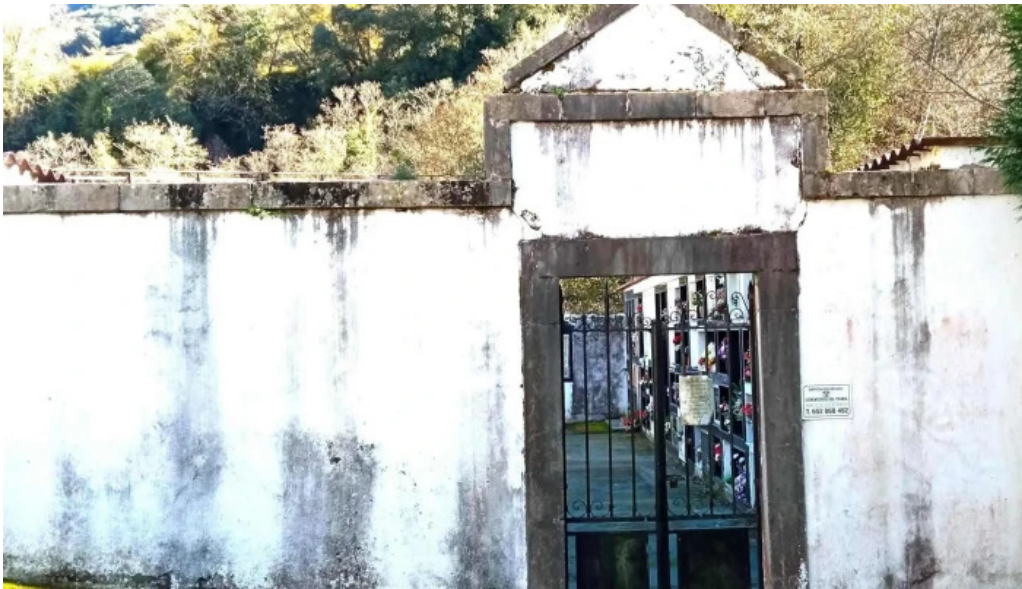
Iglesia de san romano catalogo