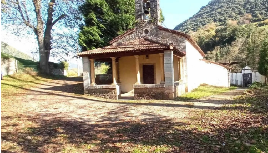
Iglesia de san romano asturias