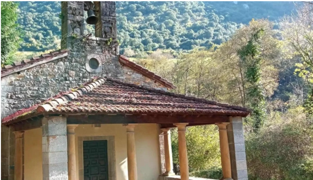
Iglesia de san romano ubicacion