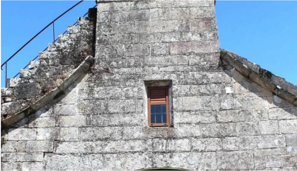
Iglesia de santiago de ribarteme iglesia catolica