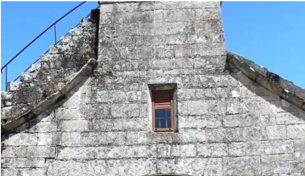
Iglesia de santiago de ribarteme as neves