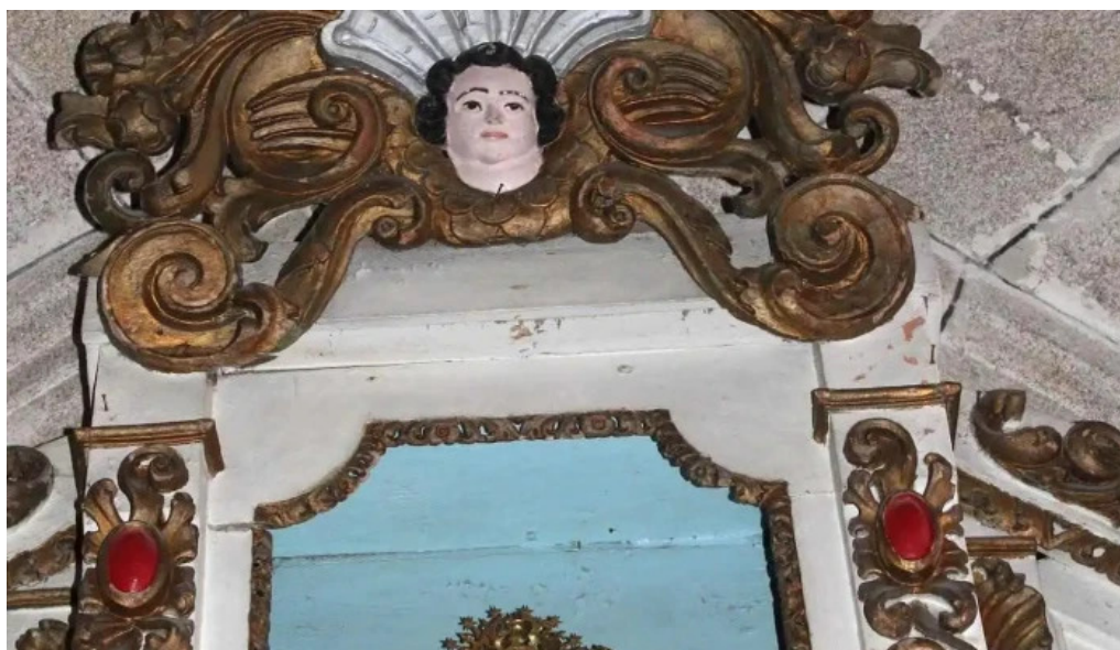
Iglesia de santiago de ribarteme iglesia